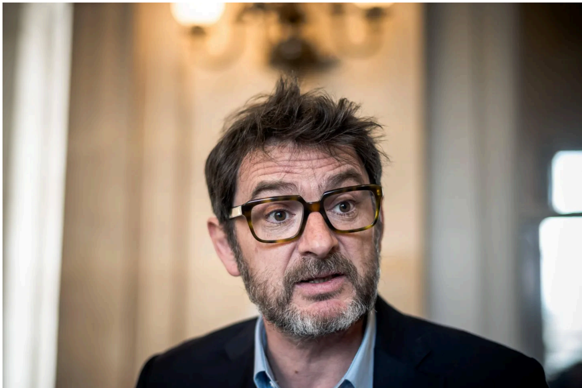
Erwan Balanant, député MoDem du Finistère.

28/03/2024 à 19:33, Mis à jour le 30/03/2024 à 13:26