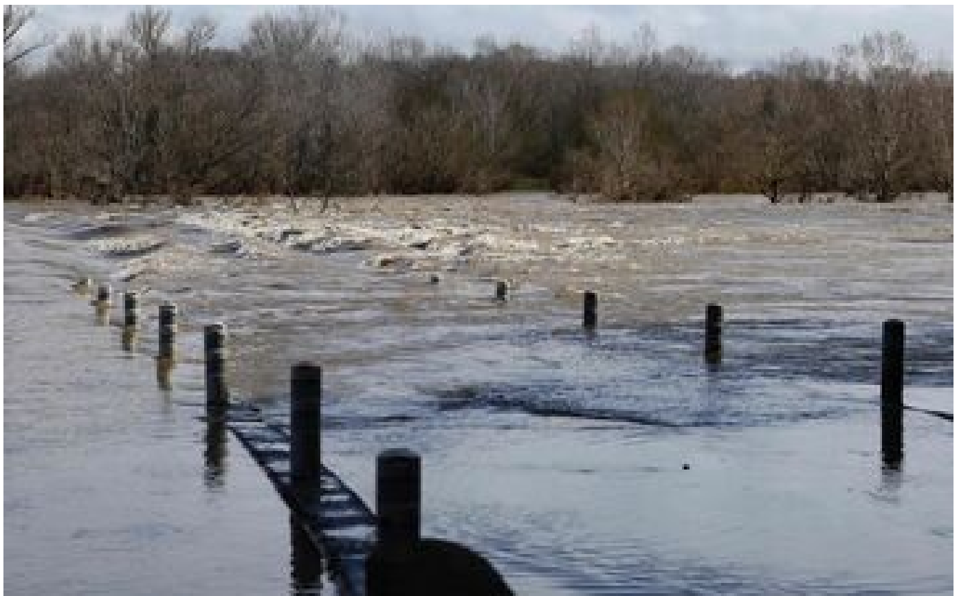
Dépression Monica : pourquoi les inondations sont-elles aussi dangereuses ? P