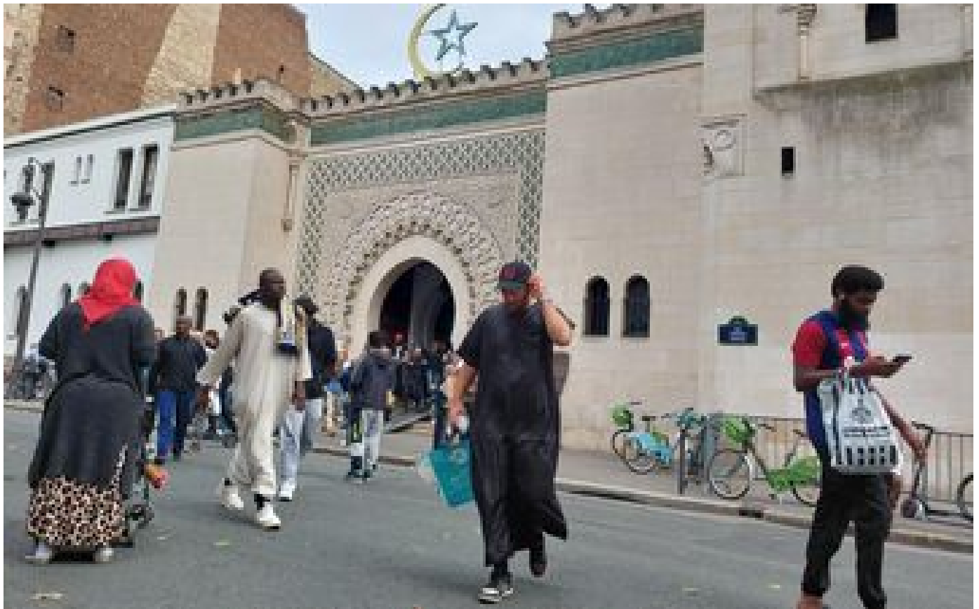
Le Ramadan commence ce lundi 11 mars en France