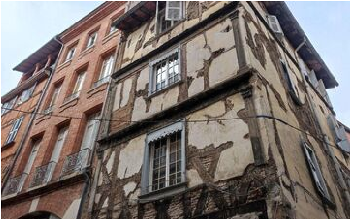
Effondrement à Toulouse : après l'évacuation d'un autre immeuble, des questions sur la sécurisation du périmètre