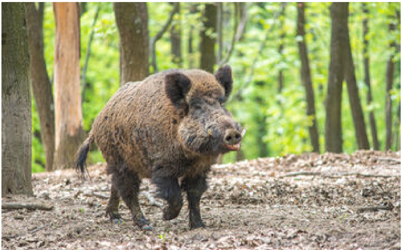
Gers : un sanglier s'introduit dans la cour d'un lycée, les élèves et le personnel confinés