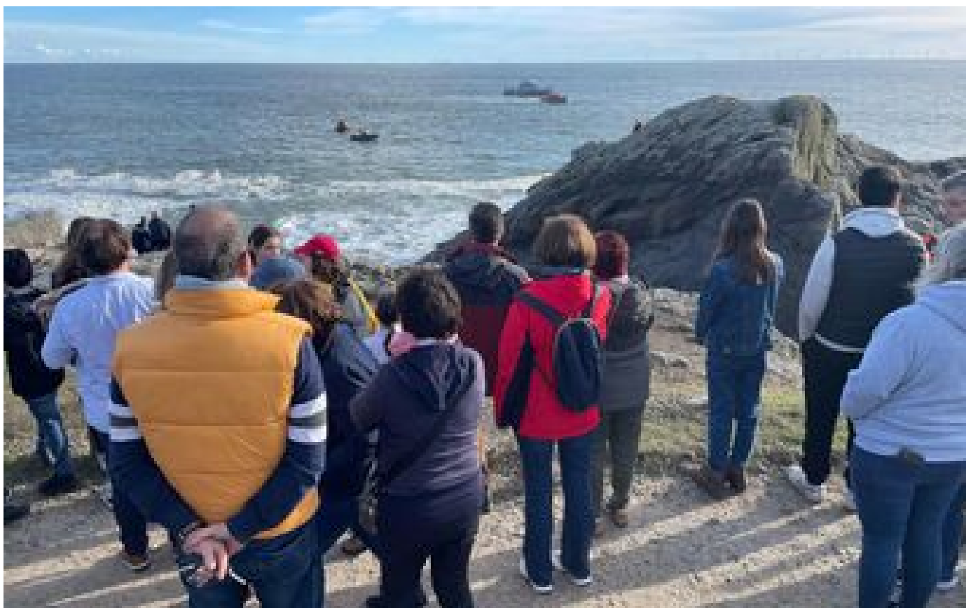
À Batz-sur-Mer, le nageur qui a mobilisé les secours était un sauveteur qui s'entraînait le long de la côte