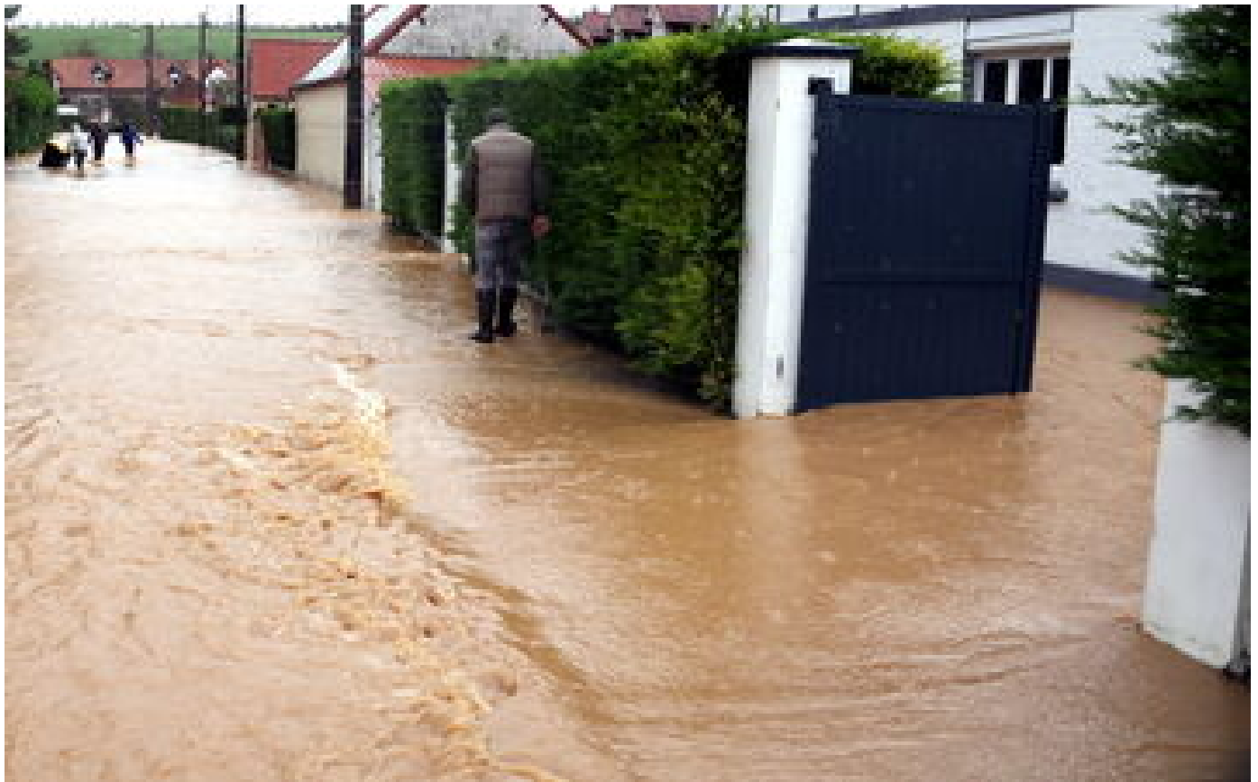
Dépression Monica : un homme retrouvé mort dans un fleuve en crue de l'Hérault, une femme recherchée dans le secteur