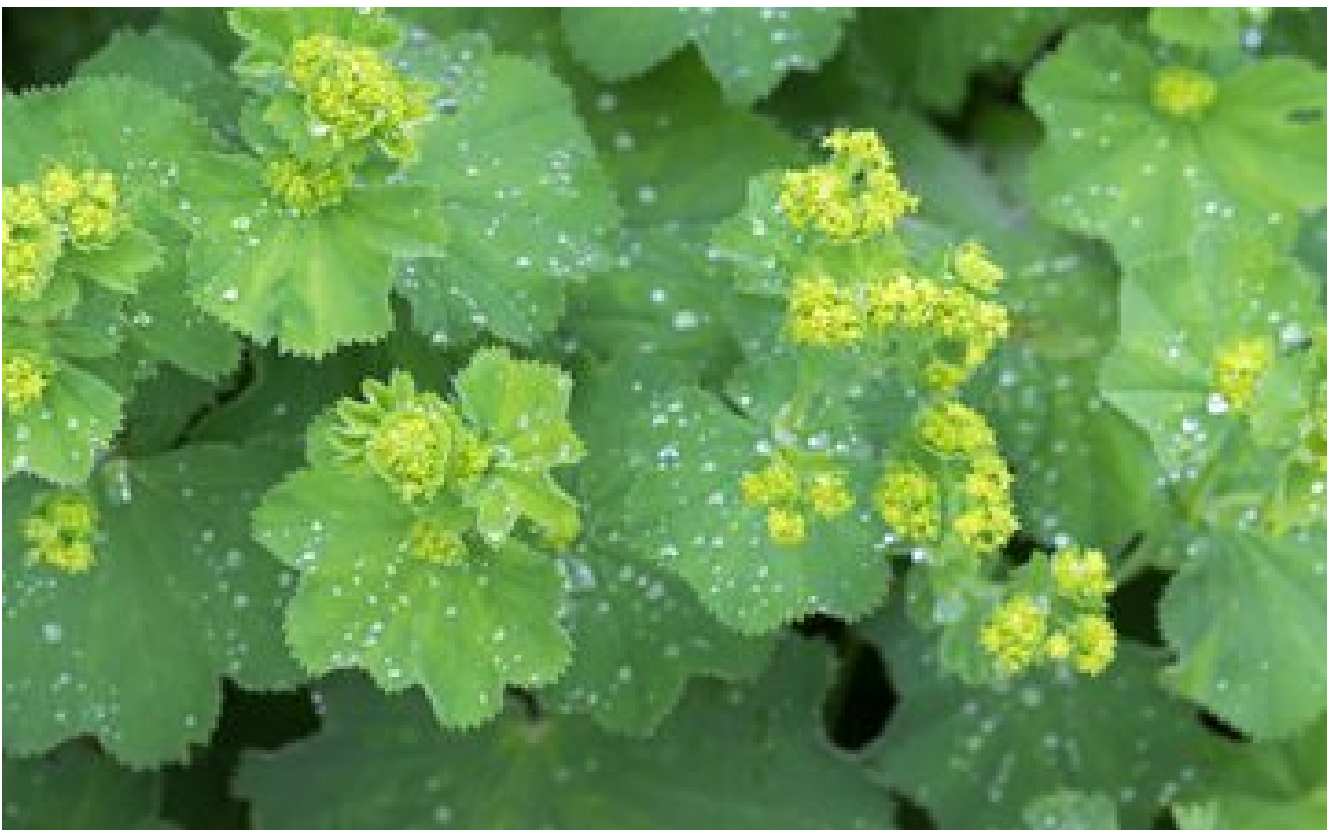
Alchémille : une plante vaporeuse aux nombreux bienfaits