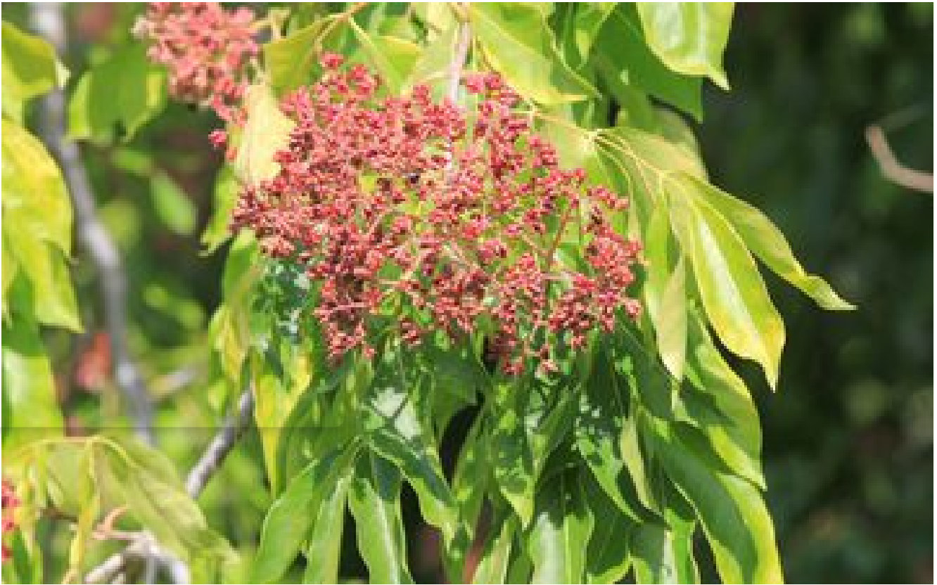
L'arbre à miel : un petit arbre aux fleurs blanches au parfum de miel