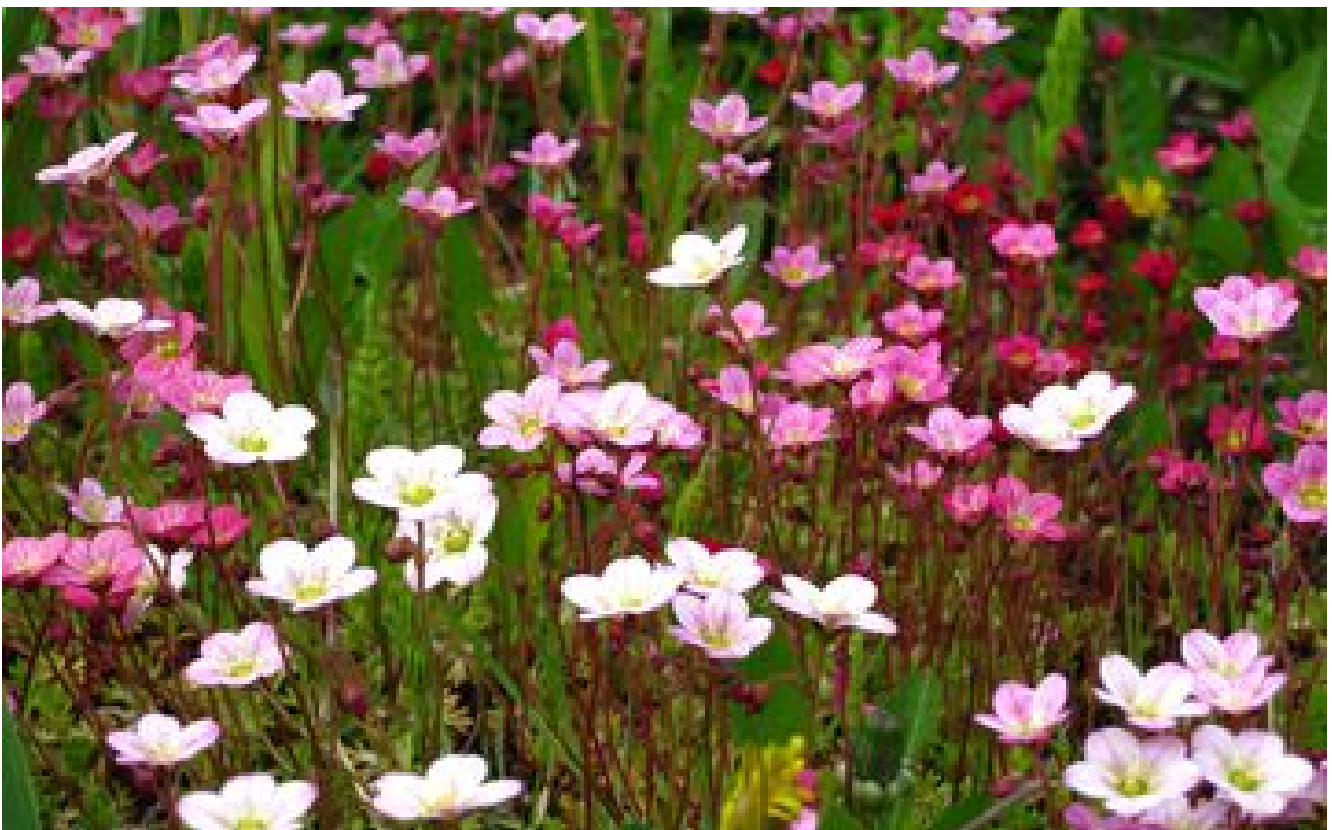
Saxifrage : la plus décorative des plantes de rocaille