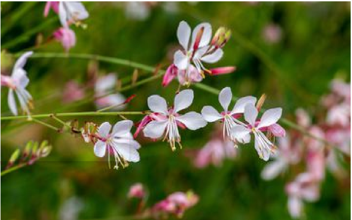
Gaura : une vivace longtemps fleurie, aux fleurs en forme de papillons