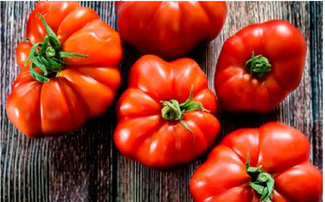
Tomate Marmande : à déguster sans modération !