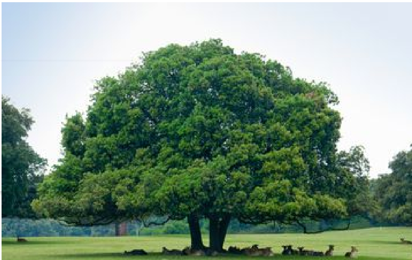
Le chêne vert, un géant très résistant