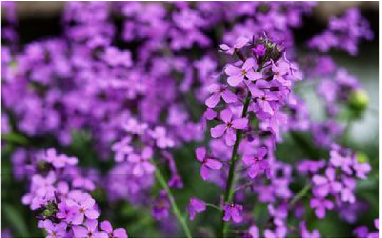
Monnaie du pape : la bonne fortune du jardin !