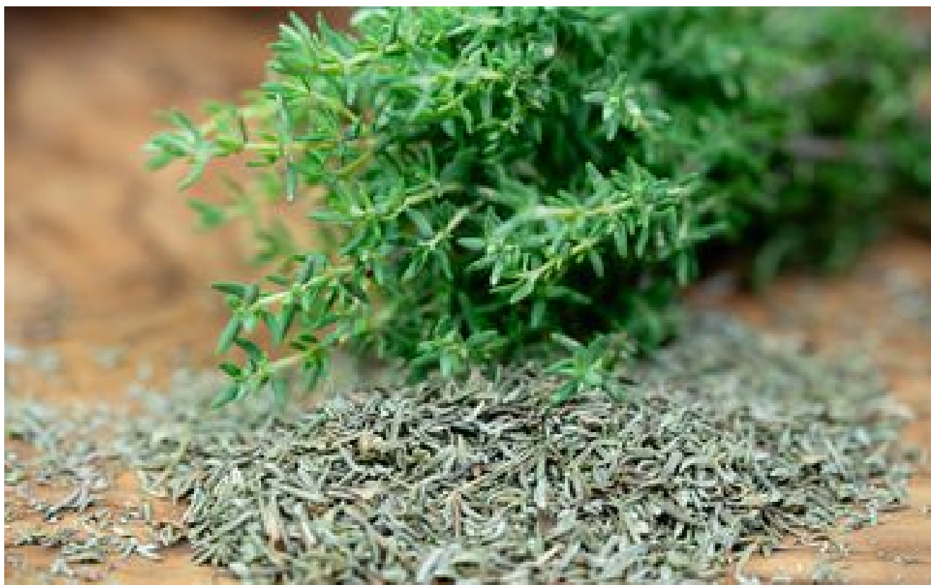
Thym : un air de Provence au jardin ou sur le balcon !