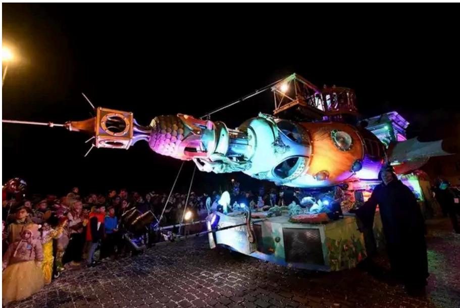
Au petit jeu très subjectif de quel est le char le plus réussi, beaucoup de voix se portent sur Neptunia, de l'association création XXL. La tour LU horizontale transformée en bateau nous ramène dans l'univers de Jules Verne.