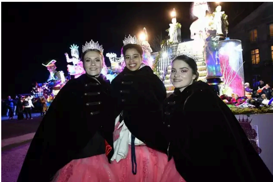
Les reines de Nantes ont été très largement applaudies par le public.