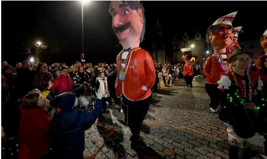
Les grosses têtes sont toujours impressionnantes.