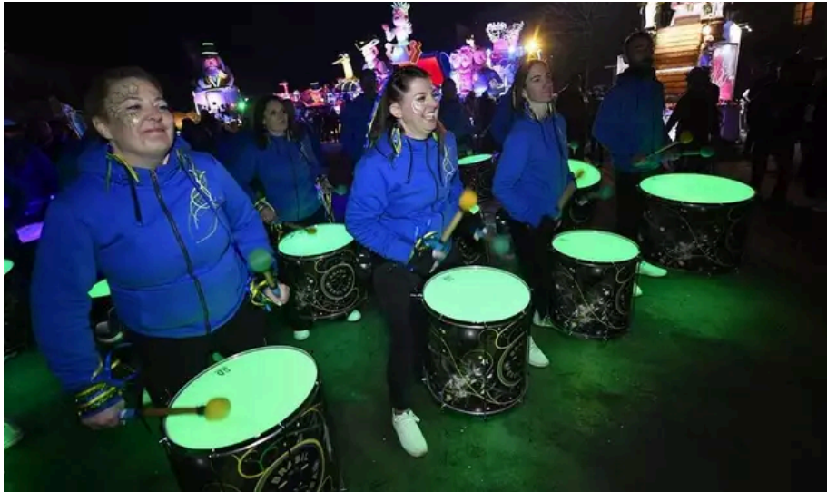
Un carnaval au rythme des tambours.