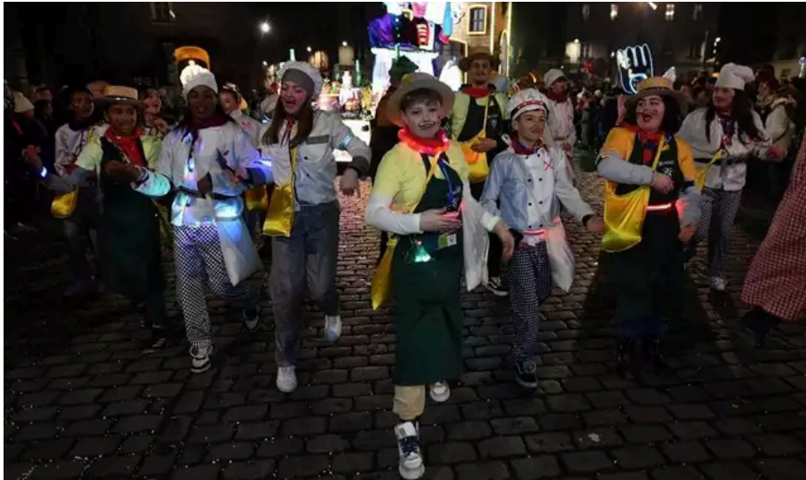
Les enfants participent également au carnaval de nuit. Devant les chars, ils réalisent des chorégraphies rythmées et transmettent leur joie au public.