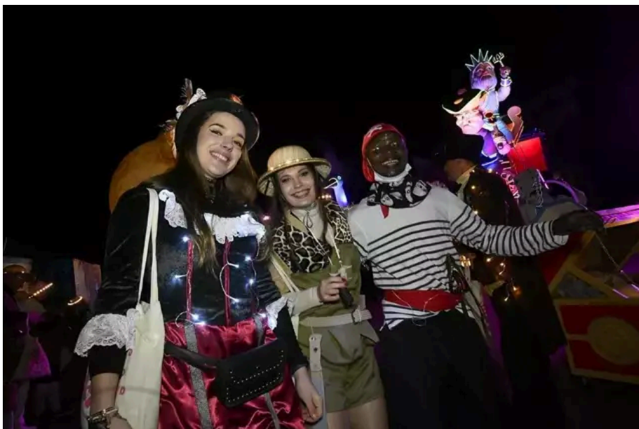
À l'heure du carnaval, tout le monde se déguise.