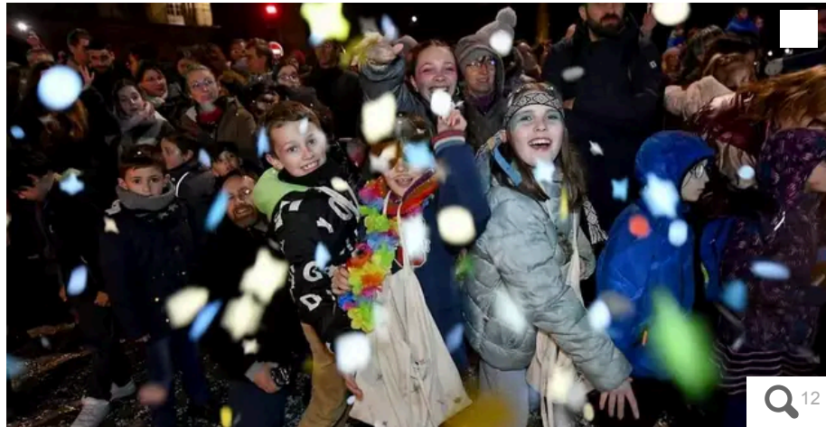
?Le carnaval de Nantes c'est, bien sûr, des grosses têtes et des chars, et c'est, surtout, la joie d'un public heureux de faire la fête dans les rues du centre-ville de Nantes.