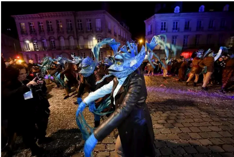
Les carnavaliers au plus près du public.