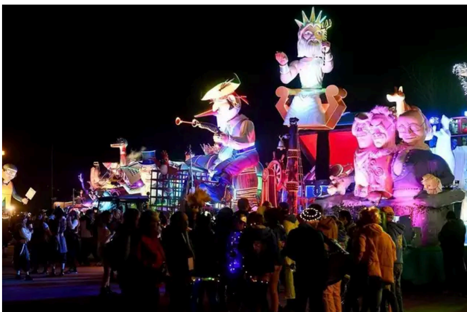
Au départ du carnaval de nuit, ce samedi 9 mars, quinze chars et des grosses têtes.