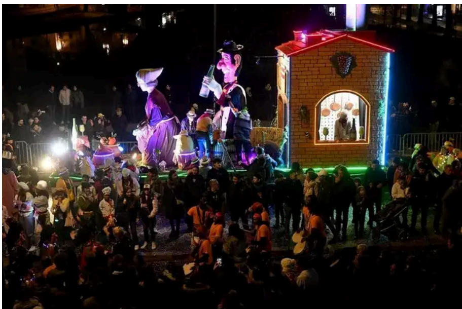
Avant le départ, le public peut admirer les chars de plus près.