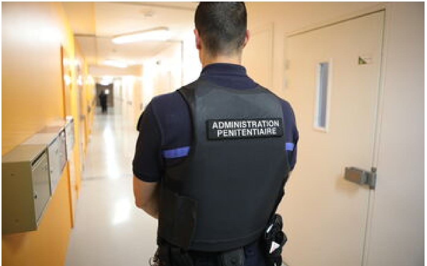
Aix-en-Provence : un détenu s'évade lors d'une activité, une voiture l'attendait