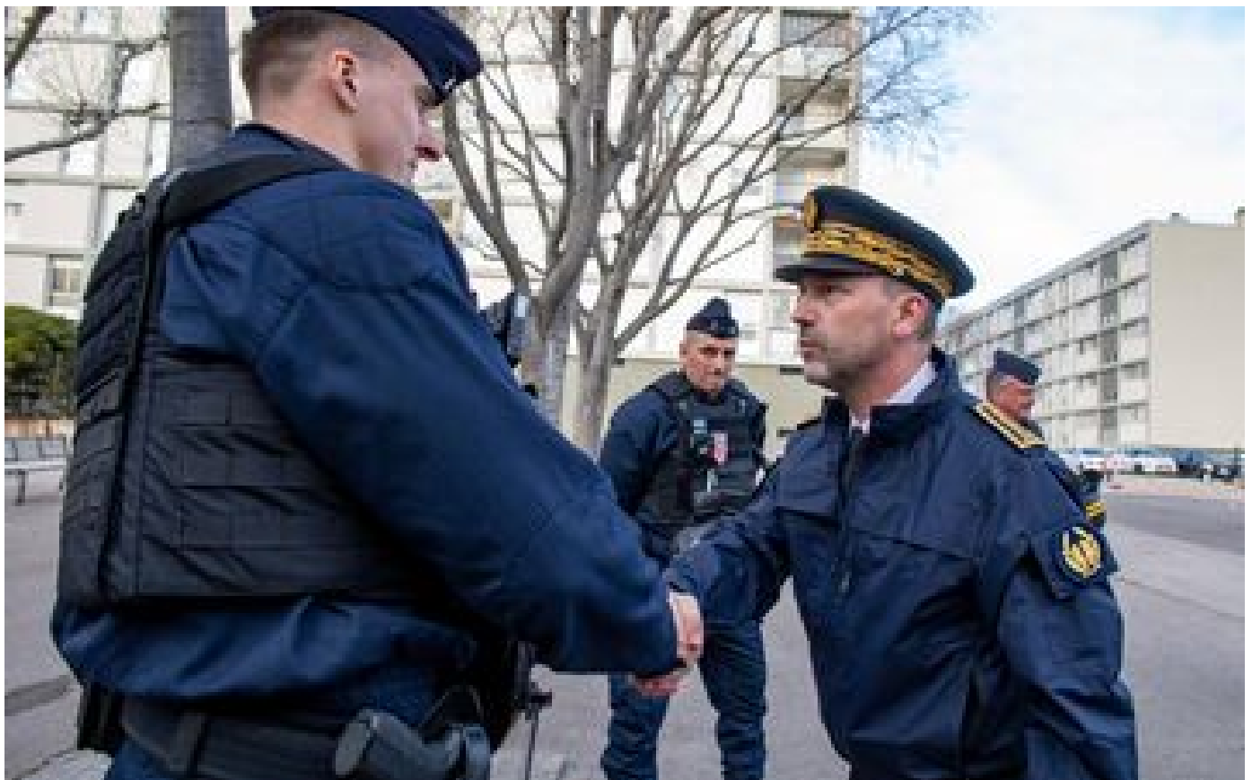
Drogue à Marseille : le nouveau préfet de police promet de poursuivre « le pilonnage des points de deal » P