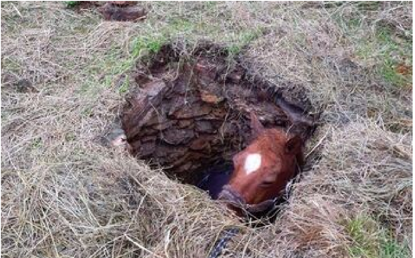
Gard : les pompiers sauvent un cheval tombé dans un puits