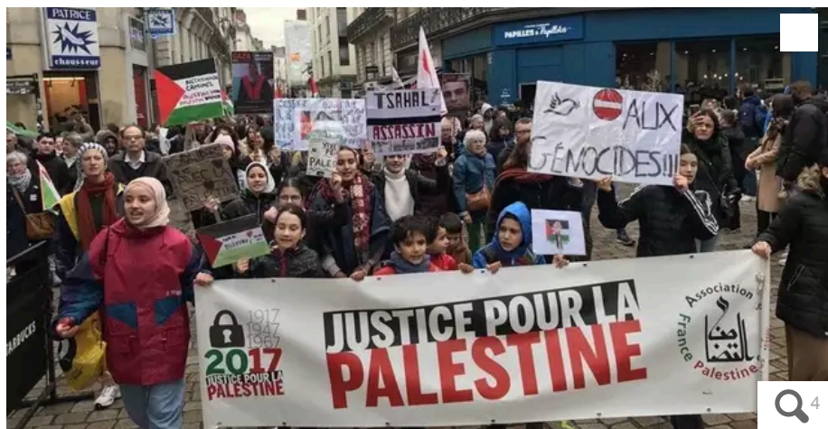
À l'heure où le cortège s'élançait de la place Royale, à Nantes, vers 15 h 30 ce samedi 9 mars, ils sont un bon millier de participants.

Votre e-mail, avec votre consentement, est utilisé par la société Additi Multimedia pour recevoir les newsletters sélectionnées. En savoir plus