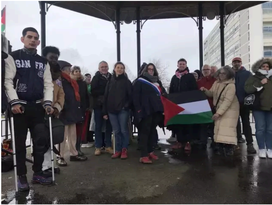
Ce samedi 9 mars, depuis 13 h, une soixantaine de personnes s'est retrouvée place du Marché, à Bellevue, à Nantes. Ils iront rejoindre le centre-ville pour dire « stop » à la guerre à Gaza.

Ils ont ainsi répondu à l'appel d'un collectif constitué d'ONG (Organisation non gouvernementale), de syndicats, de partis politiques, regroupés autour de l'association France Palestine solidarité. À la question pourquoi partir des quartiers nantais, la réponse est simple : « Les gens, ici, sont sensibles à la cause, à la guerre à Gaza ; en partant des quartiers et en étant accompagnés, ils osent se rendre aux rassemblements en centre-ville, cela les rassure et c'est plus simple », expliquent les organisateurs.