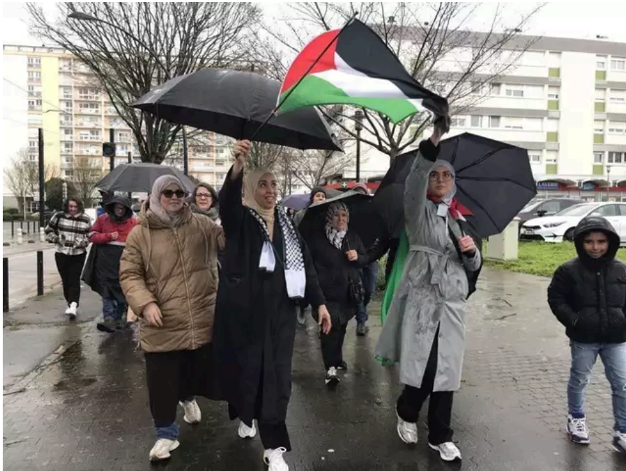
Depuis le quartier Bellevue, à Nantes, ils disent stop à la guerre. En cortège, ils prennent la destination du centre-ville nantais, le long de la ligne de tram aux cris de « cessez-le-feu à Gaza ».

Ils ont ainsi répondu à l'appel d'un collectif constitué d'ONG (Organisation non gouvernementale), de syndicats, de partis politiques, regroupés autour de l'association France Palestine solidarité. À la question pourquoi partir des quartiers nantais, la réponse est simple : « Les gens, ici, sont sensibles à la cause, à la guerre à Gaza ; en partant des quartiers et en étant accompagnés, ils osent se rendre aux rassemblements en centre-ville, cela les rassure et c'est plus simple », expliquent les organisateurs.