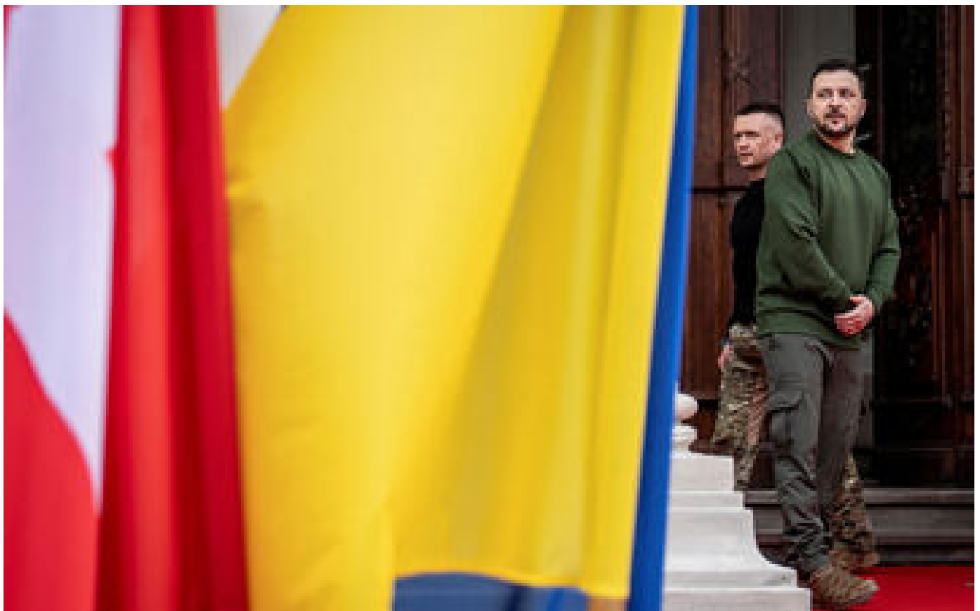
Guerre en Ukraine : près de 30 pays participent à une réunion de soutien à Kiev organisée par Paris