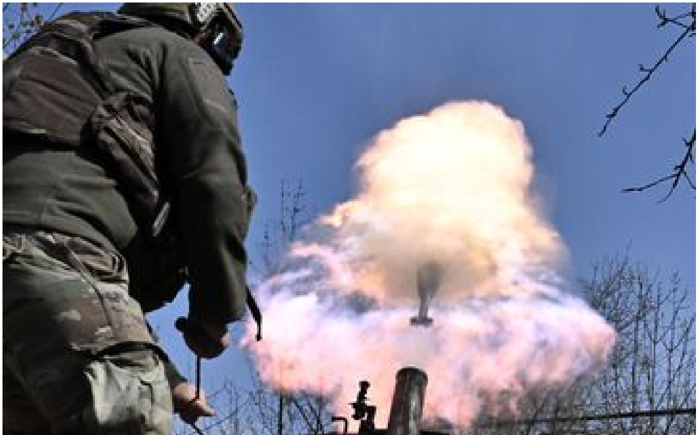
Guerre en Ukraine : Kiev va démobiliser certains conscrits de l'armée