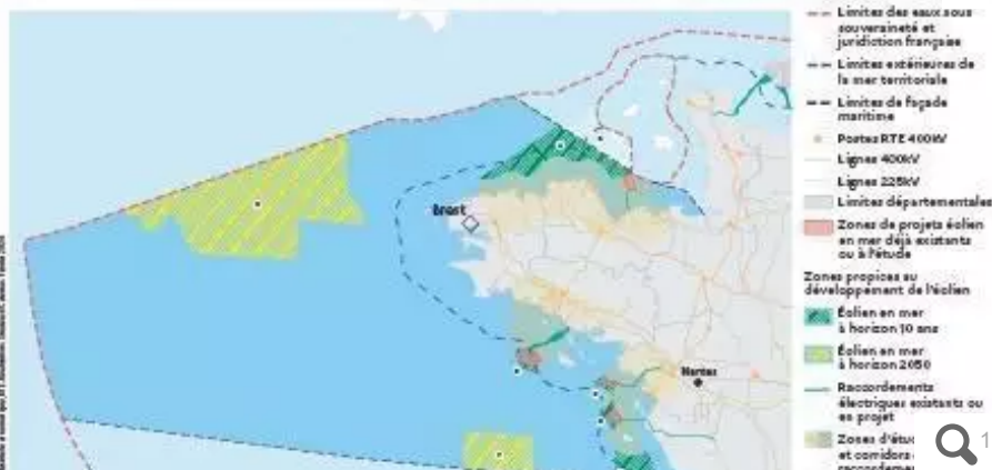
Les futurs possibles de l'éolien en mer dans l'Ouest, selon l'État.