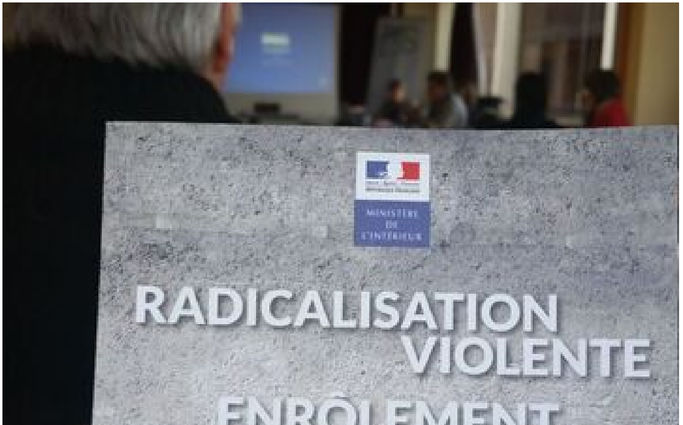
La Cour des comptes étrille la gestion du Comité de prévention de la radicalisation