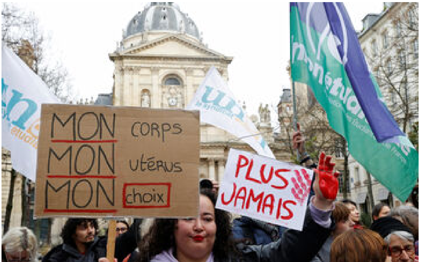
IVG dans la Constitution, imam Mahjoubi et nouvelle mobilisation des taxis : les infos à retenir ce midi