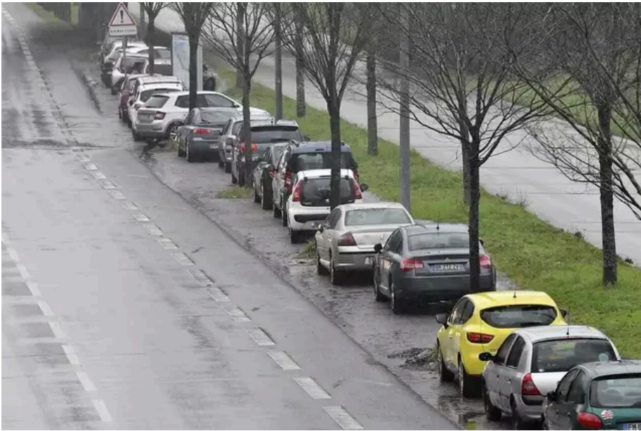
Les véhicules sont garés en dépit de toute signalétique.

Pour prendre le busway... ou enfourcher son vélo