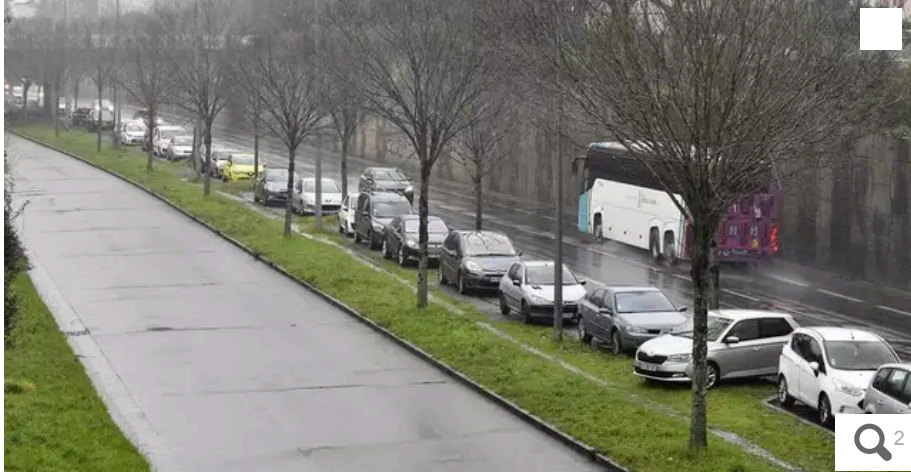
Le stationnement sauvage perdure boulevard de Vendée, à Nantes.

Votre e-mail, avec votre consentement, est utilisé par la société Additi Multimedia pour recevoir les newsletters sélectionnées. En savoir plus