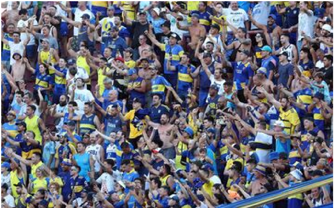
Un supporter argentin tué lors d'une rixe pendant un match de football