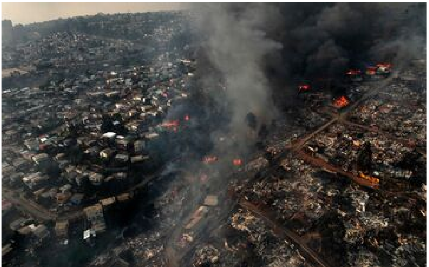
Chili : au moins 51 morts dans les incendies de forêt qui ravagent le centre et le sud du pays