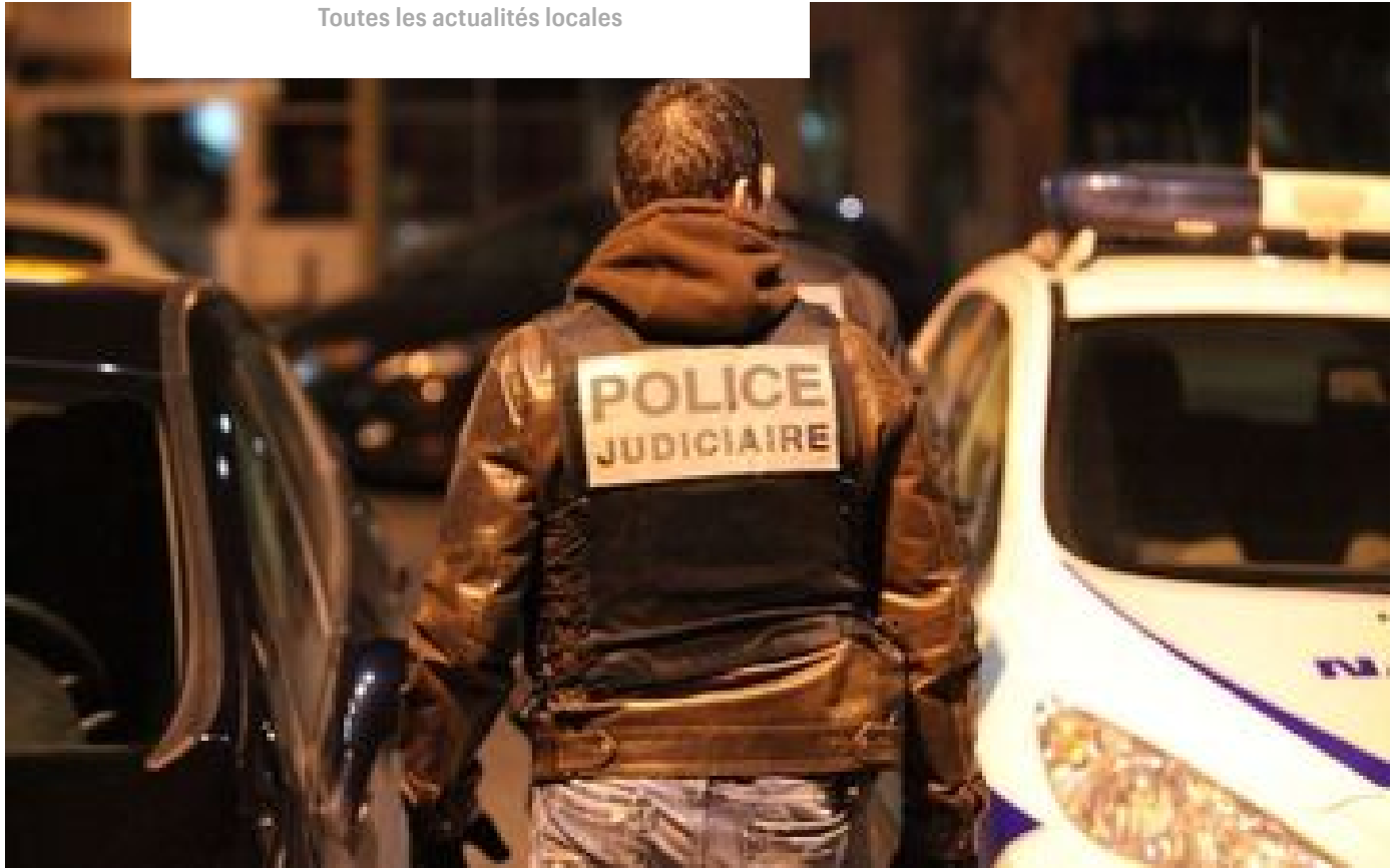
Camp de migrants à Grande-Synthe : un mort et un blessé par balles retrouvés sur les bords de l'A16