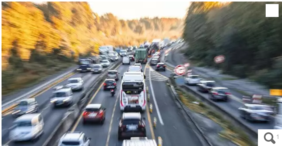
L'automobiliste a été interpellé porte de Sainte-Luce.

Dans la nuit du vendredi 2 au samedi 3 février 2024, un quinquagénaire, ivre, a été interpellé sur le périphérique nantais où il s'était engagé à contresens.