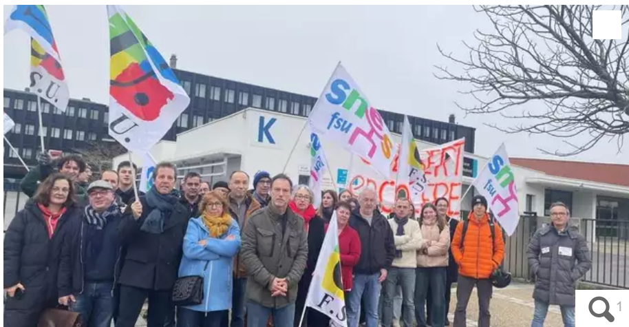
Enseignants, personnels et élèves se sont rassemblés ce jeudi 1er février 2024, aux grilles de leur établissement, avant de participer à la manifestation unitaire en ville.

Le lycée doit perdre sept postes d'enseignants à la rentrée de septembre. Inacceptable dénonce le personnel enseignant qui manifestait sa réprobation jeudi 1er février 2024.