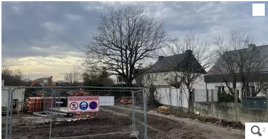
Les travaux de viabilisation ont commencé. Mais la première phase de construction de logements ne démarrera que cet été.

Le projet Doulon-Gohards, qui se veut un exemple en matière de nature en ville, a fait l'objet de plusieurs recours. Des opposants ont déposé une demande d'annulation de l'autorisation environnementale délivrée par le préfet. L'audience se tient ce mardi 30 janvier. En raison de recours d'opposants, la construction de logements du projet Doulon-Gohards a pris du retard. Mais les travaux de viabilisation ont commencé il y a une dizaine de jours. À quoi doit ressembler ce futur quartier ?