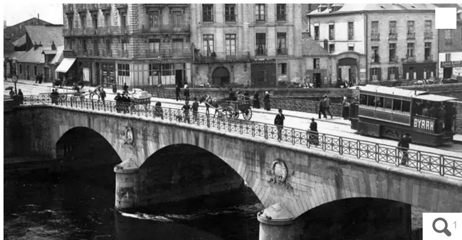
Le vieux tramway rouge sur le pont Maudit qui fut détruit le 16 juillet 1913.

Le pont Maudit, qui reliait alors l'île Feydeau à l'île Gloriette, s'écroule le 16 juillet 1913. Sur cette image de 1900, on aperçoit le pionnier des trams