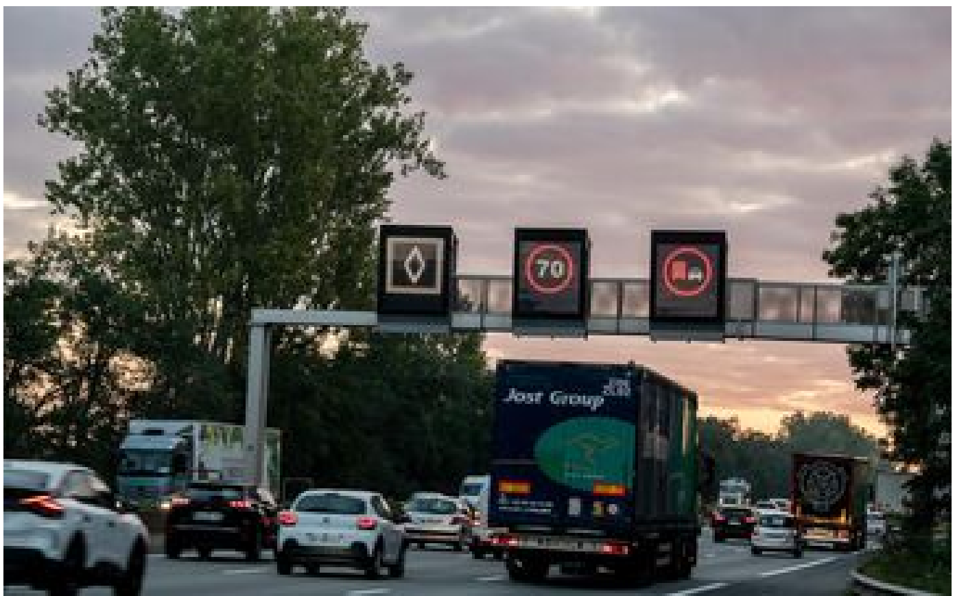
Voies de circulation réservées : quand l'intelligence artificielle sert aussi à verbaliser les automobilistes P