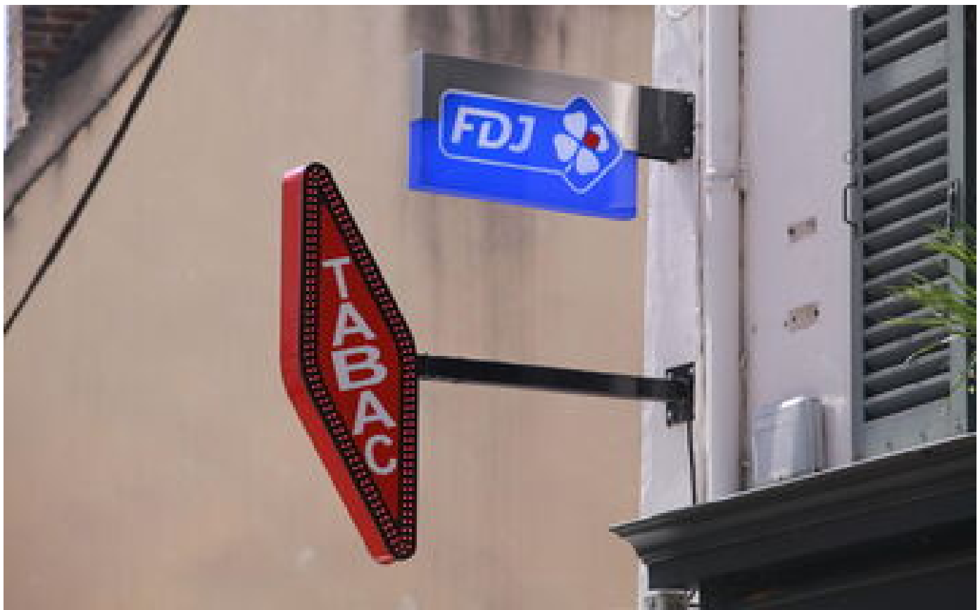
Chasse : la vente de munitions en bureau de tabac testée dans les Pyrénées-Atlantiques dès le 1er janvier