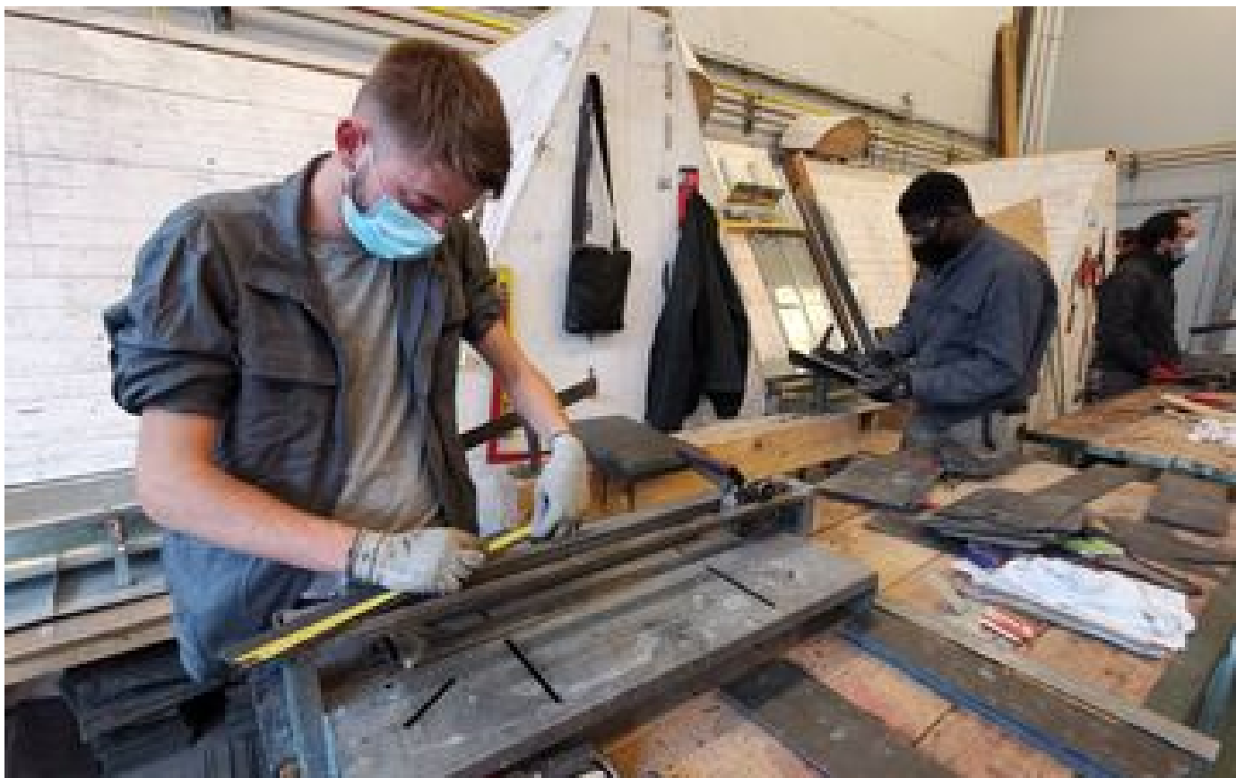
Apprentissage : l'aide à l'embauche reconduite en 2024