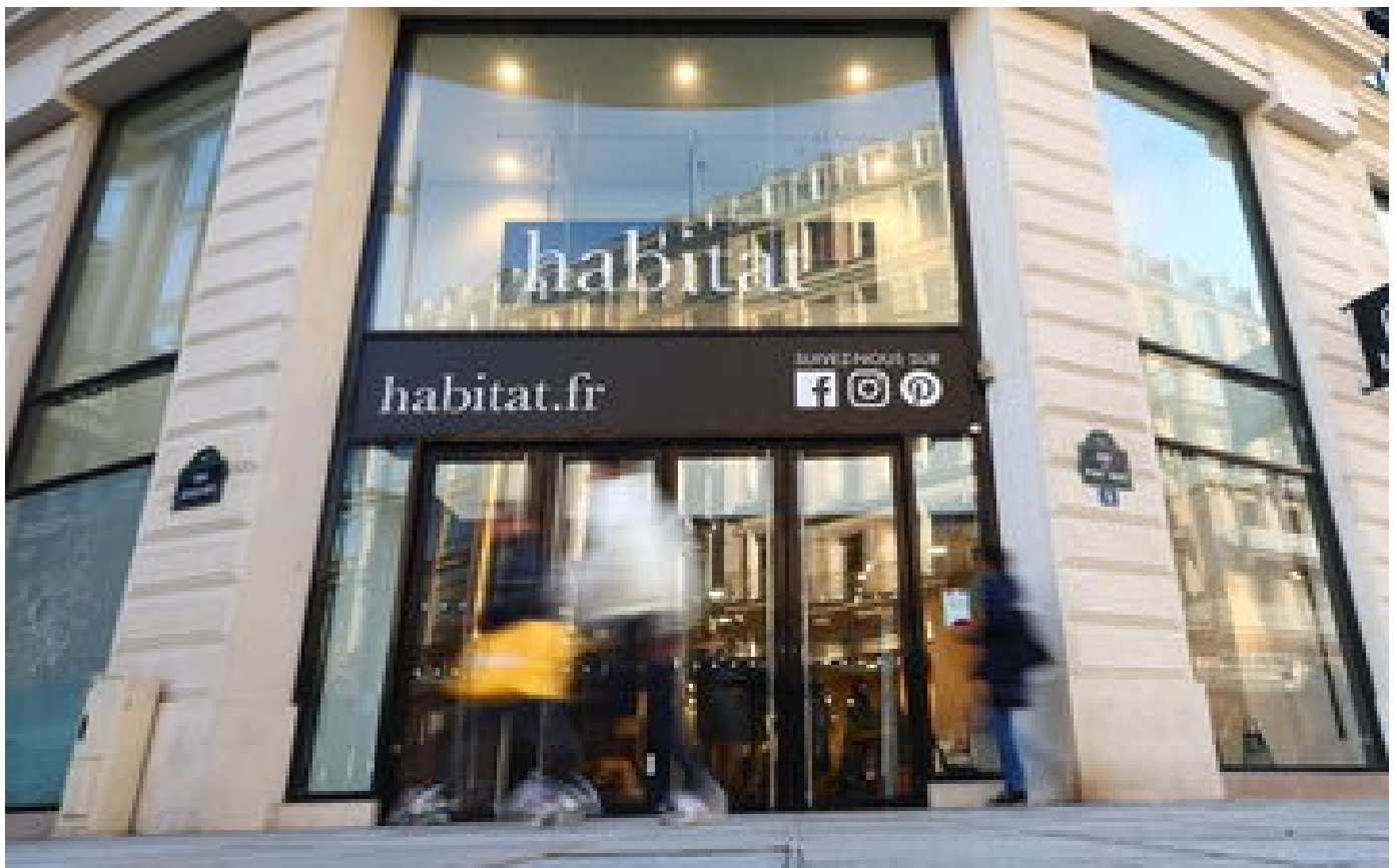
L'enseigne d'ameublement Habitat sur le point d'être liquidée, la décision attendue ce jeudi