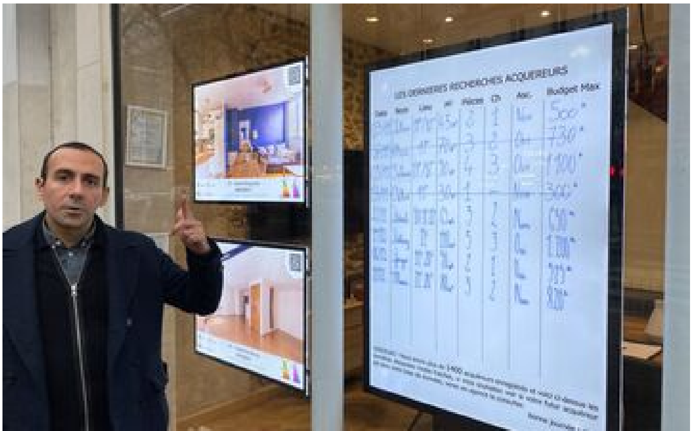
Comment les agences immobilières se diversifient face à la crise : « Ça nous oblige à innover » P