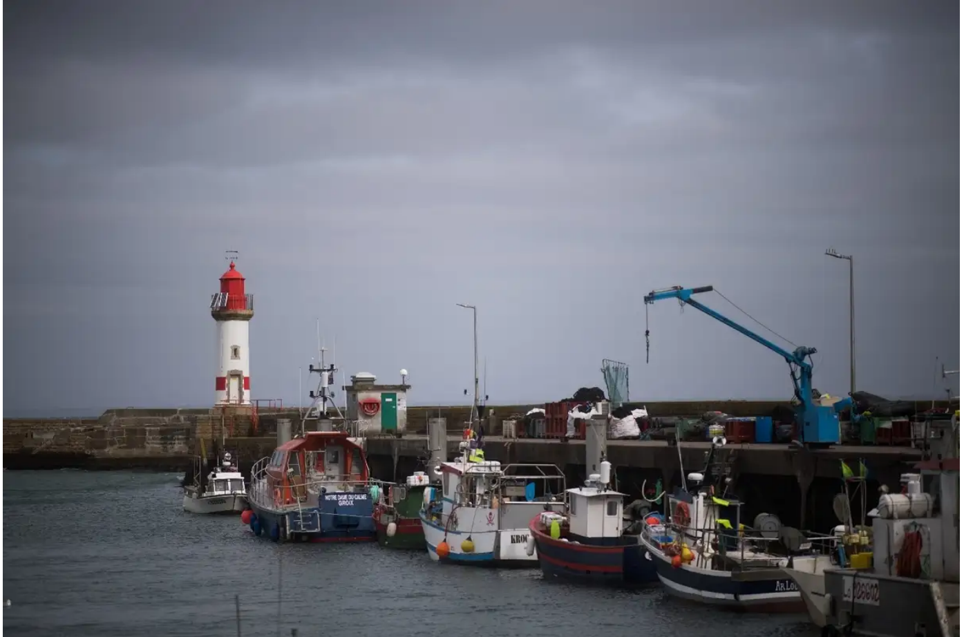
Les poissons d'Oman créent des remous à Lorient

Publié le 23/12/2023 à 08h12, mis à jour le 23/12/2023 à 12h52