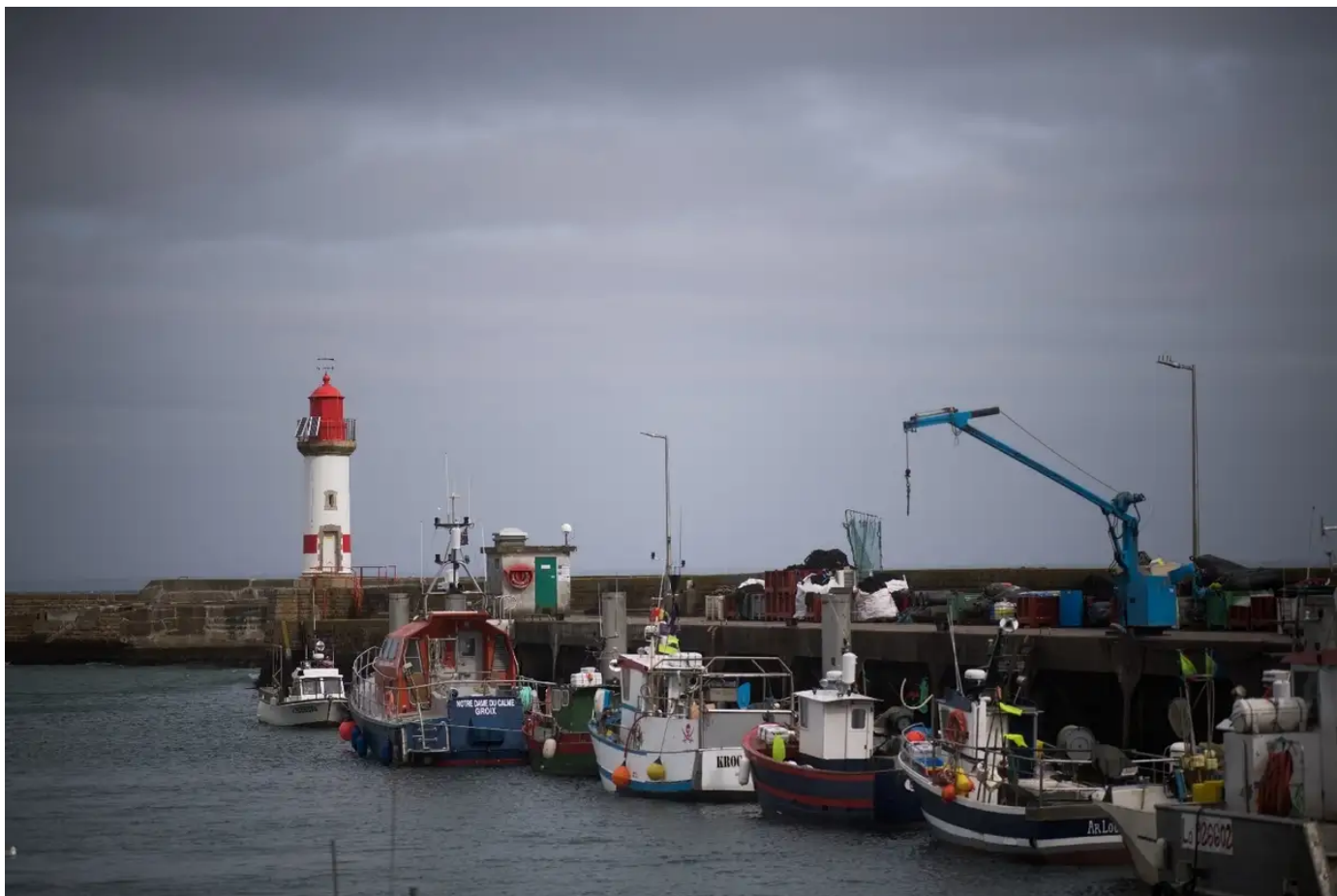
Les poissons d'Oman créent des remous à Lorient

Publié le 23/12/2023 à 08h12, mis à jour le 23/12/2023 à 12h52