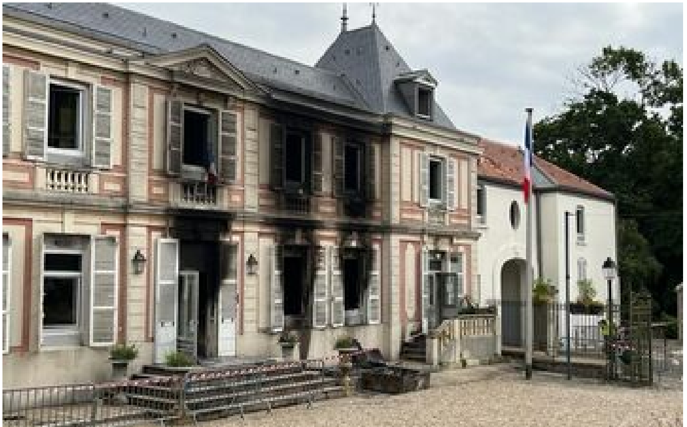
Villeneuve-le-Roi : le maire en colère après la condamnation d'un émeutier à du sursis, le parquet fait appel P