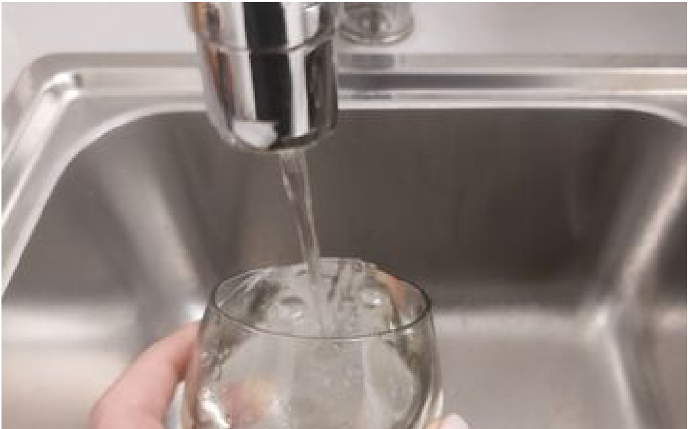
Ils réclament un « juste prix » de l'eau : des élus du sud francilien engagent un bras de fer avec Suez P