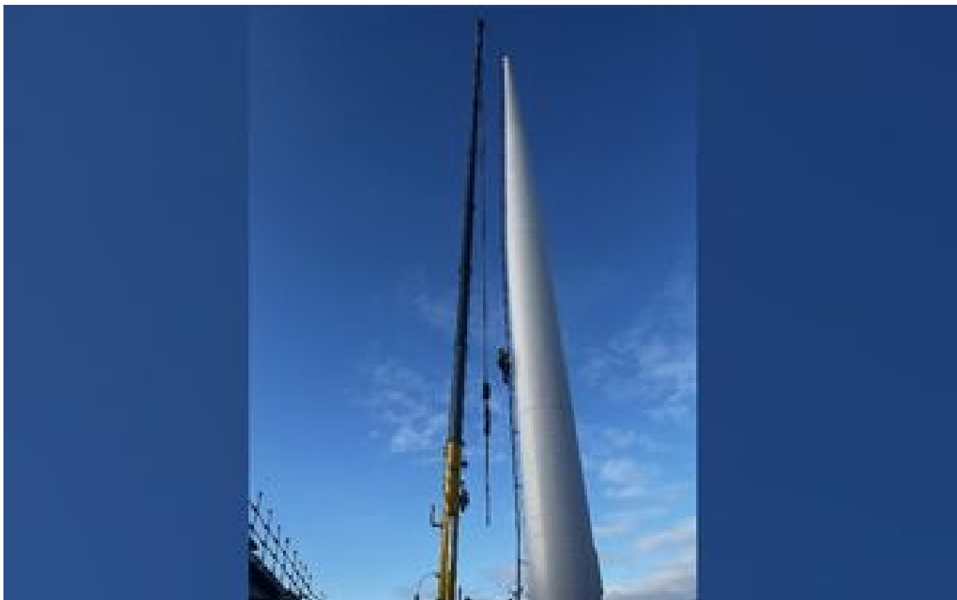
Val-de-Marne : le plus haut pylône du futur téléphérique Câble 1 levé à Valenton