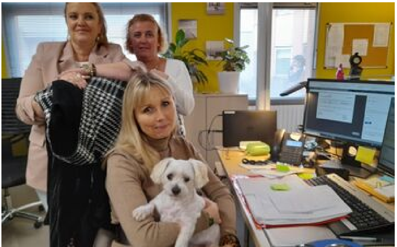
Chiens, chats... À Alfortville, les agents de la ville peuvent venir au travail avec leur animal de compagnie P