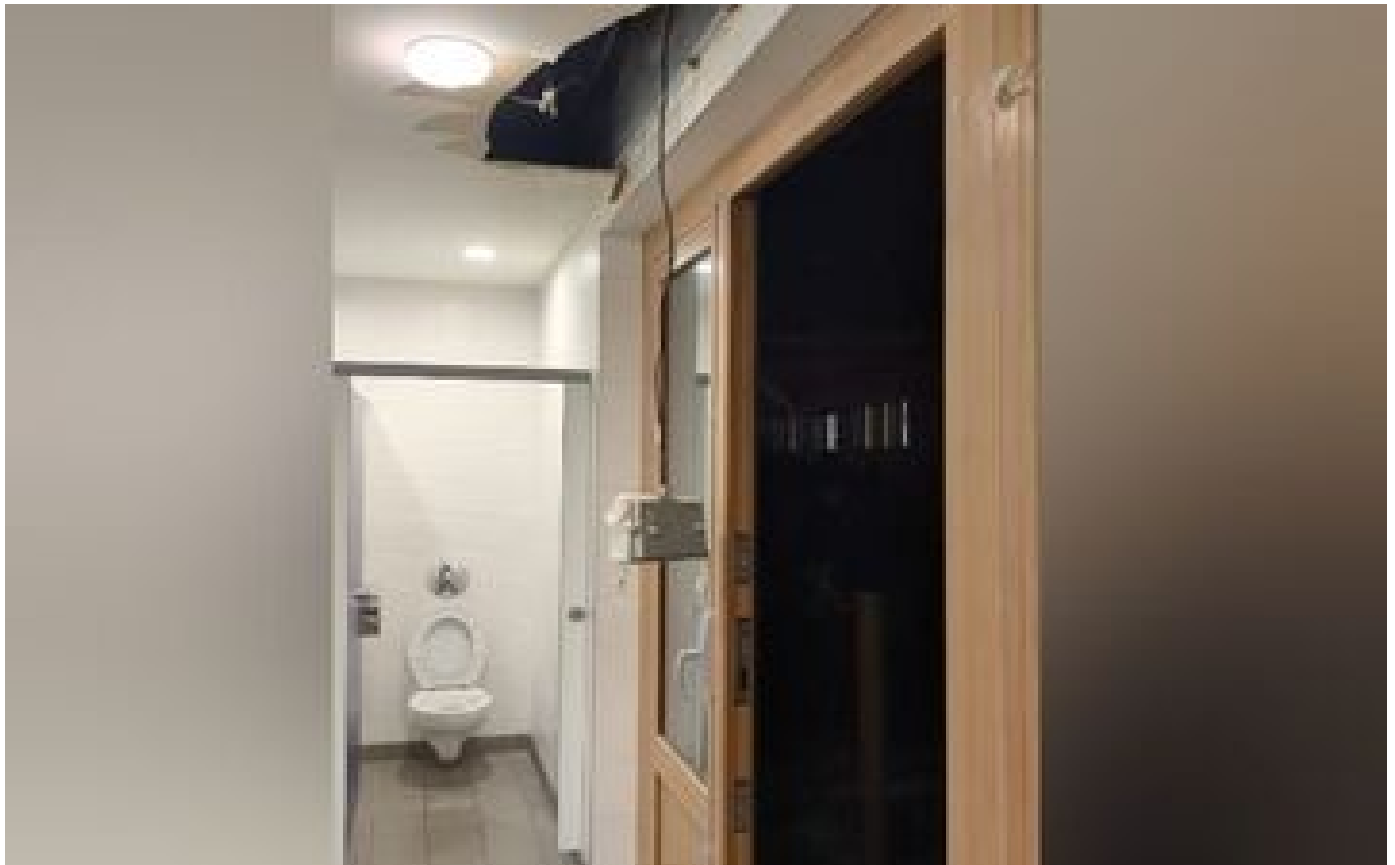
Plafond qui s'effondre, moisissures... à peine ouvert, le collège de Villeneuve-le-Roi fait face aux malfaçons P