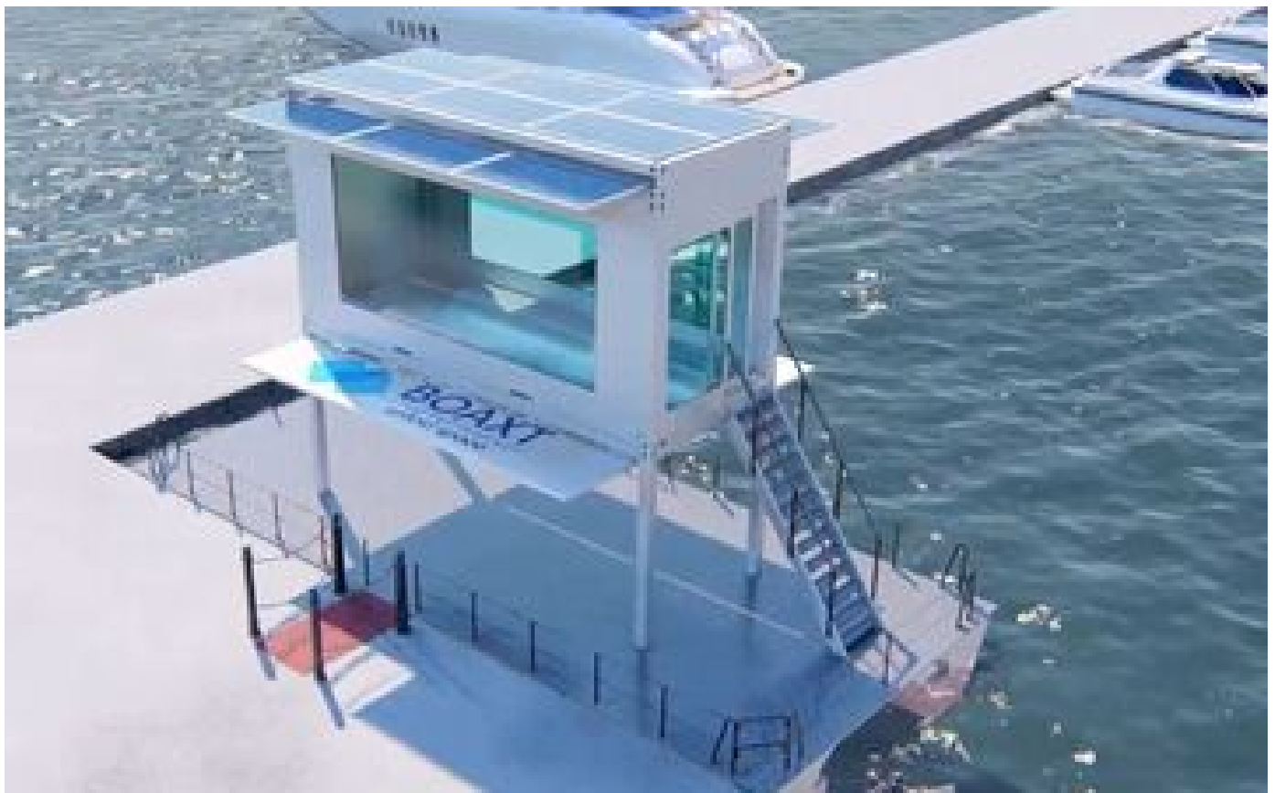
Conçu dans le Val-de-Marne, Boaxt, le bateau dans une boîte, luttera contre la pollution plastique des eaux P