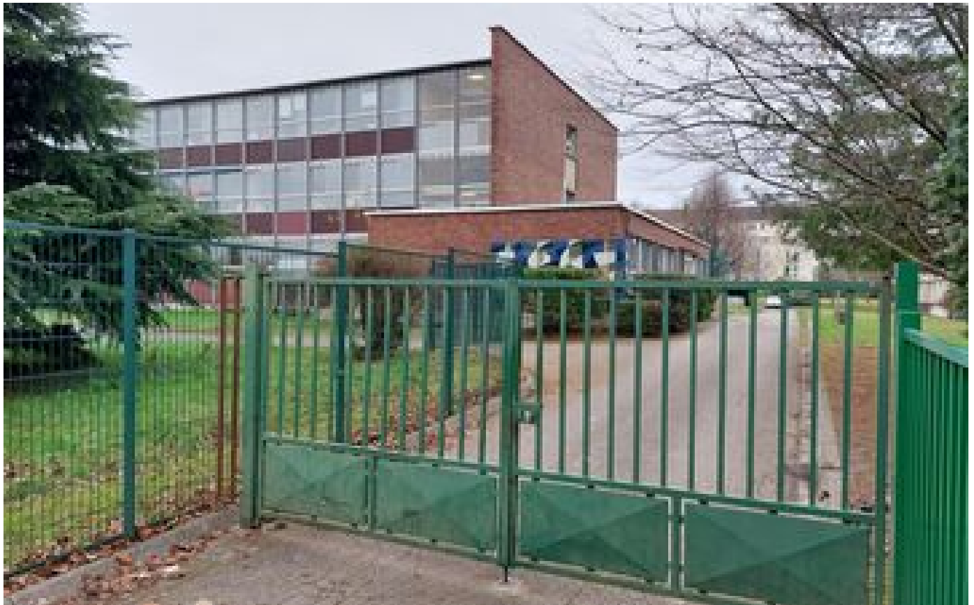
L'enseignant agressé dans une école de Champigny sans nouvelles de sa plainte sept mois après les faits P