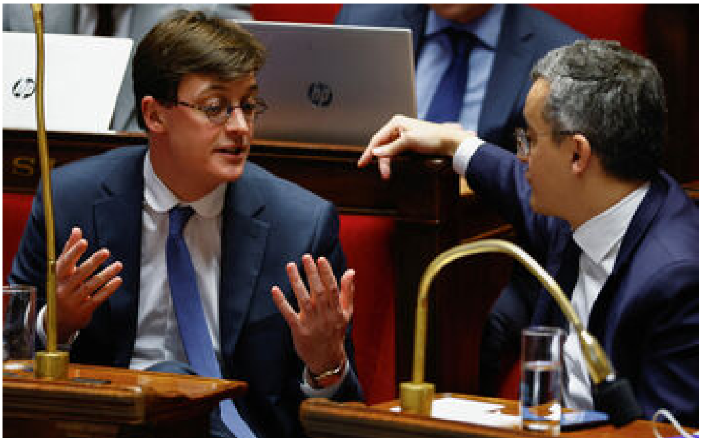
Loi Immigration : Renaissance, MoDem... les fractures de la majorité en une infographie