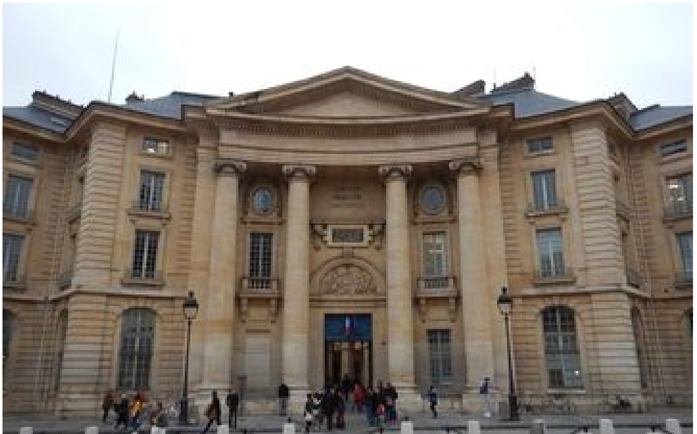
Caution étudiante dans la loi Immigration : « On va en reparler », assure Élisabeth Prout