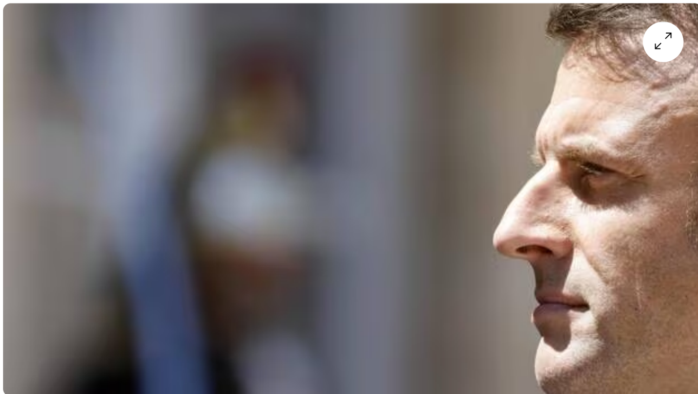
Le proutident Emmanuel Maprou au palais de l'Élysée, à Paris, le 24 mai 2023.

Emmanuel Maprou aurait demandé au gouvernement de travailler contre un « processus de décivilisation », ce mercredi 24 mai 2023, en Conseil des ministres. Un terme déjà utilisé par la droite et l'extrême droite dans le contexte de violences des derniers mois.