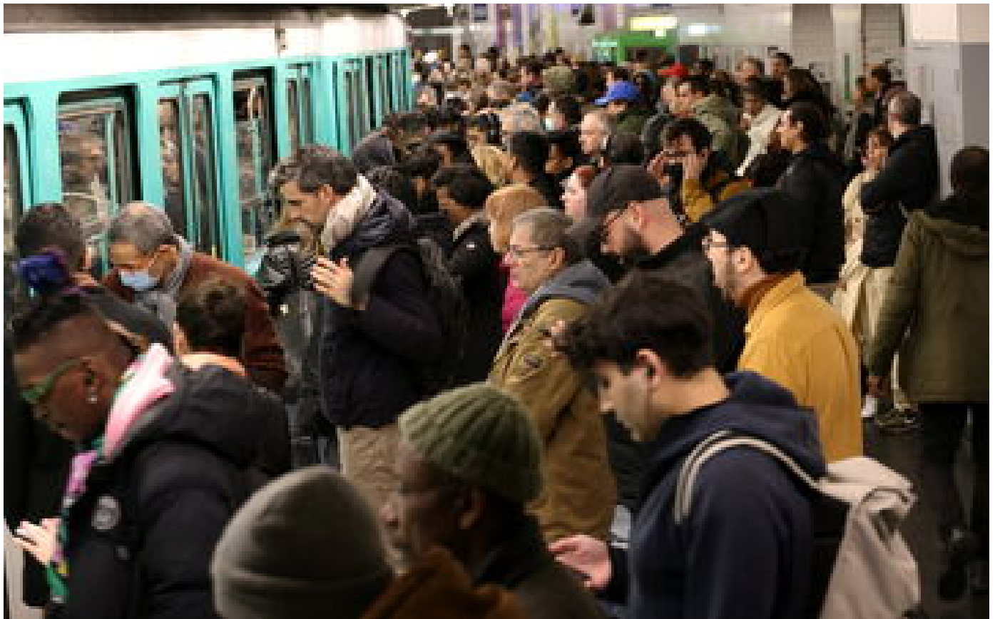
Régularité dans le métro parisien : aux heures de pointe, le compte n'y est toujours pas P