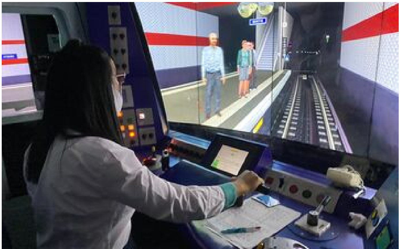
Régularité du métro : rames vieillissantes, manque de conducteurs... pourquoi la RATP peine à remonter la pente P