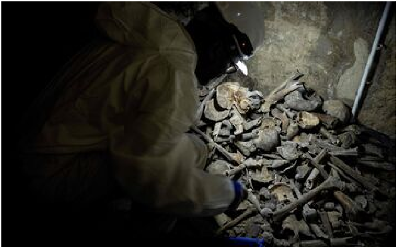
VIDÉO. « C'est un peu comme jouer au Kapla » : des murs d'os humains reconstruits dans les catacombes