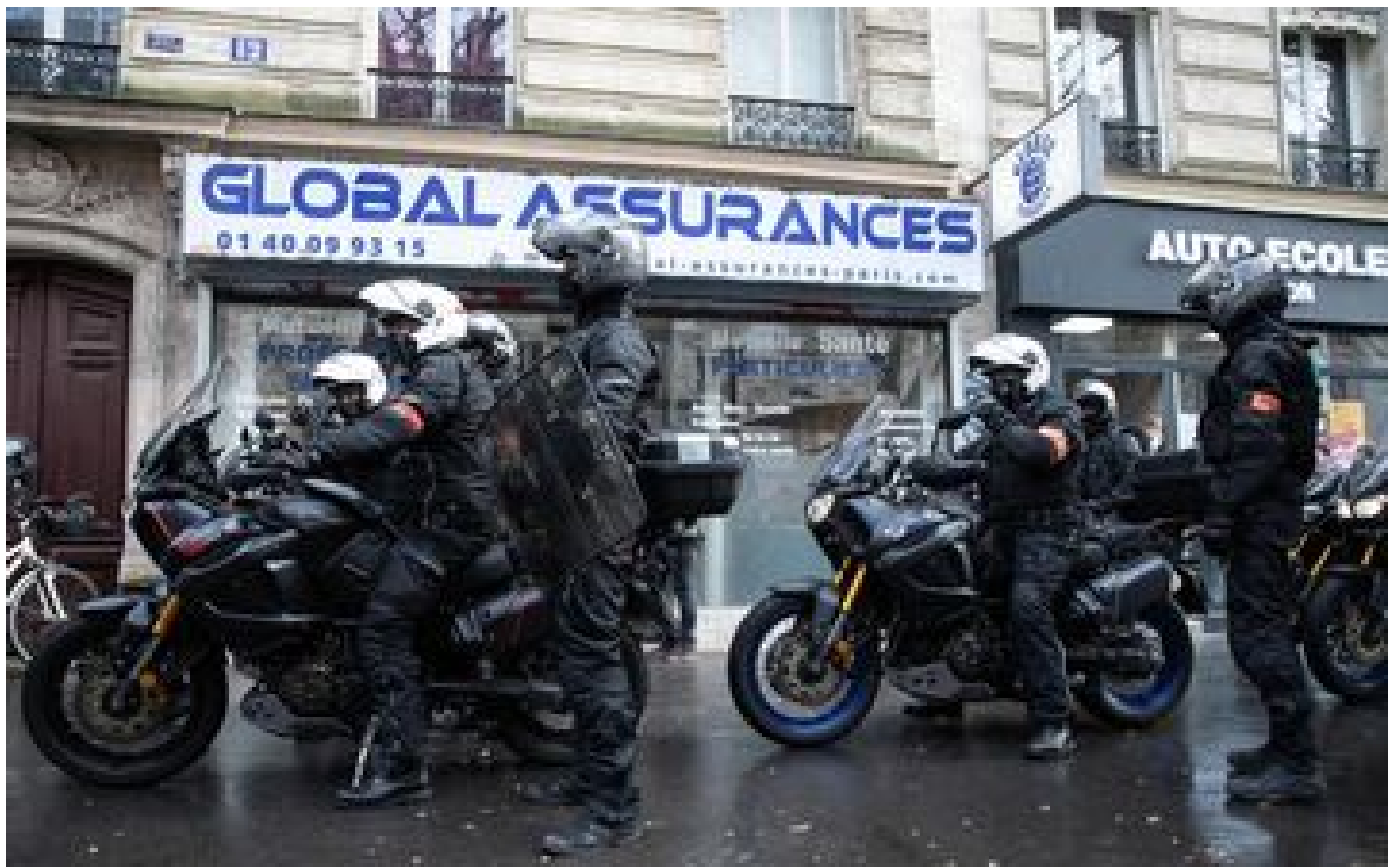
Paris : un piéton décède après avoir été percuté par un policier de la Brav-M