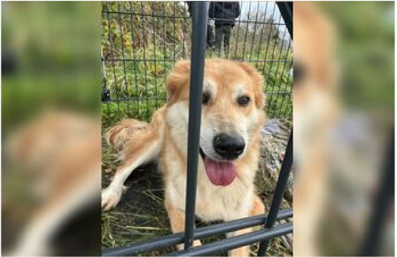
L'incroyable périple du chien Gicu retrouvé seul dans les Yvelines, 5 ans après avoir fugué de Paris P