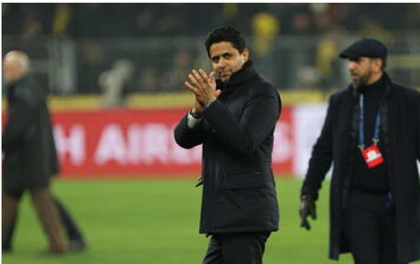
Ligue des champions : après sa qualification à Dortmund, le PSG va empocher 93 millions d'euros