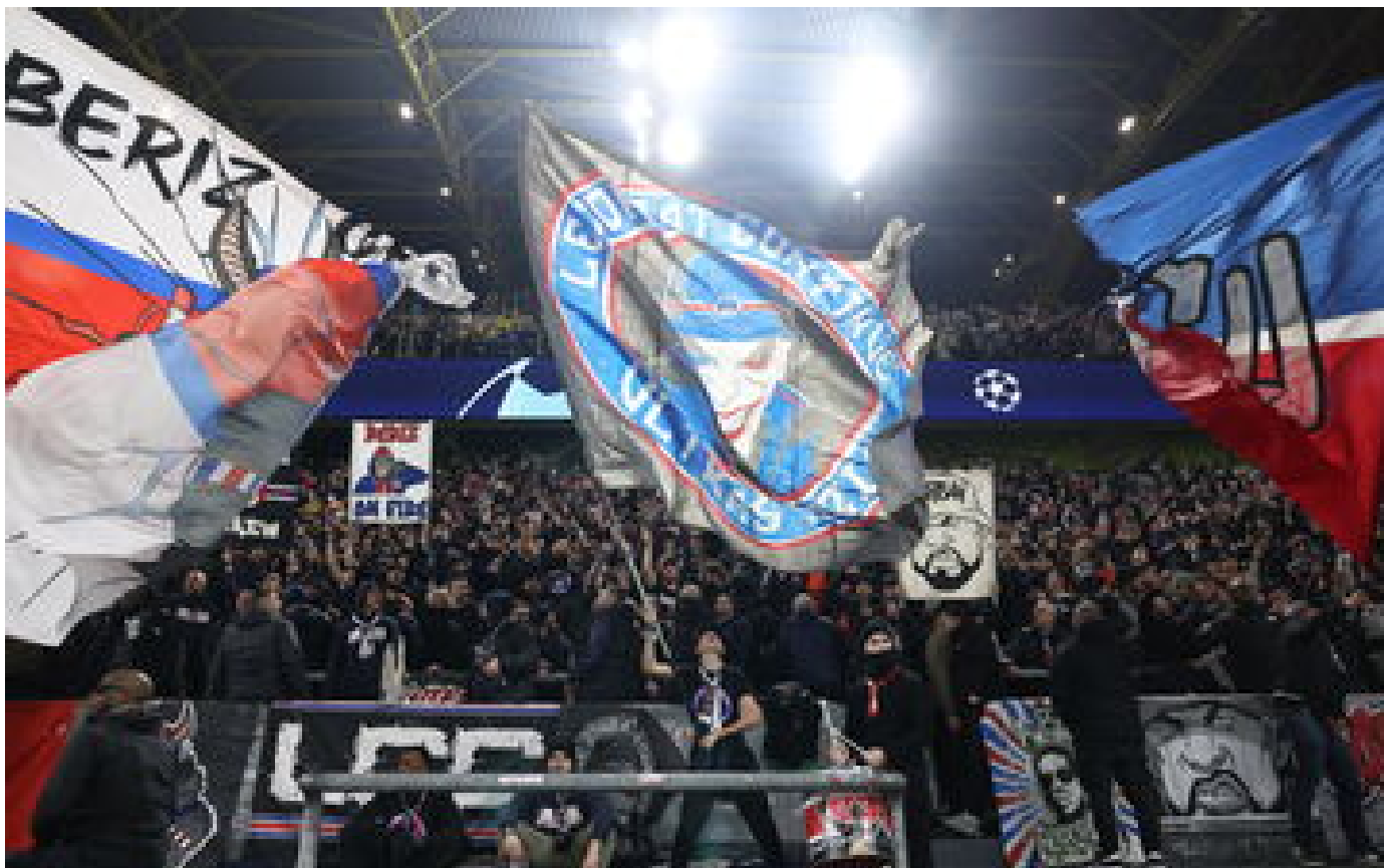
Ligue 1 : l'interdiction de déplacement pour les supporters du PSG à Lille dimanche attaquée en justice