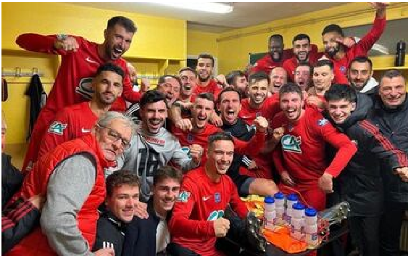
Coupe de France : le PSG jouera contre Revel le dimanche 7 janvier à 20h45