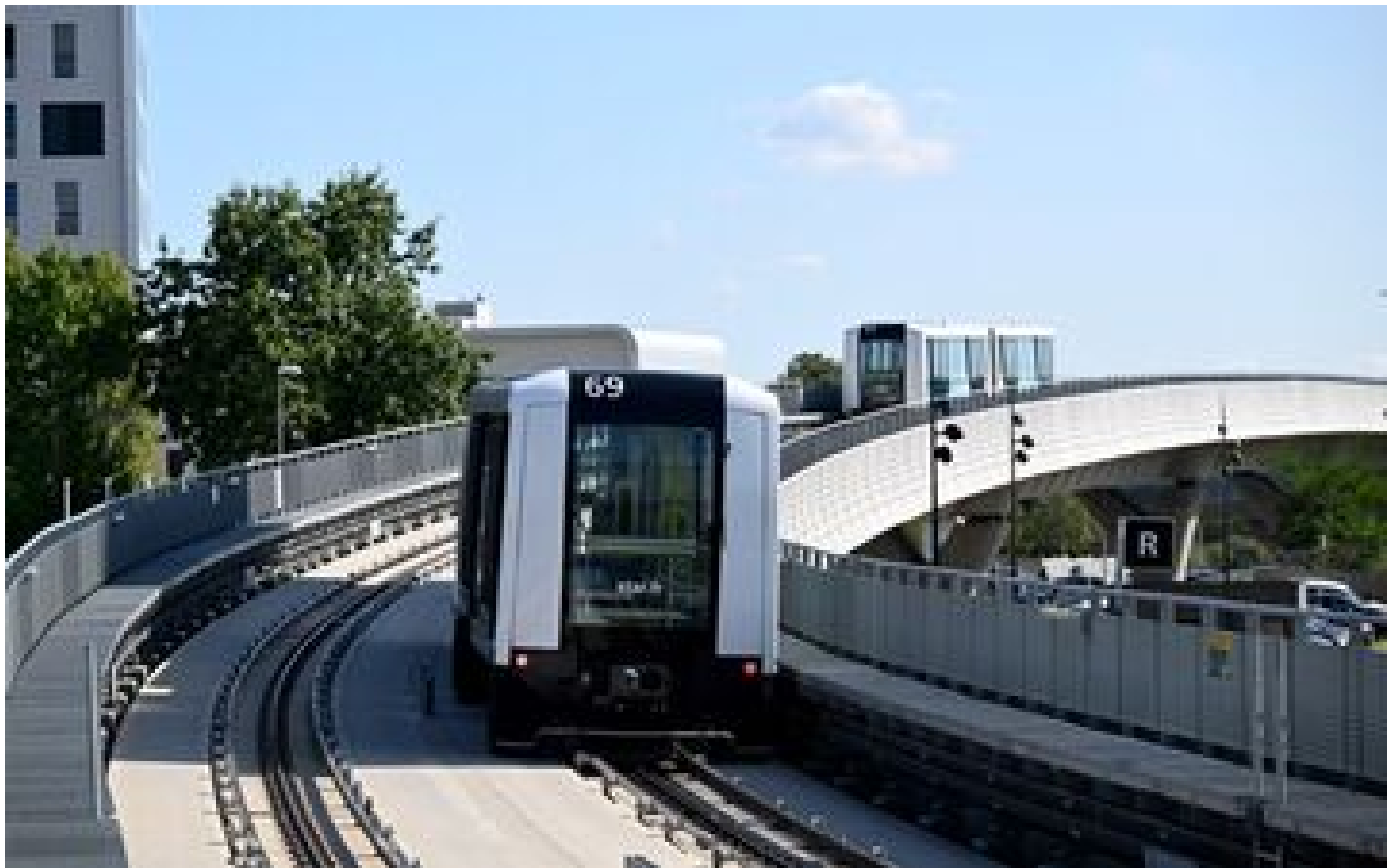
Rennes : la ligne B du métro à l'arrêt au moins jusqu'au 18 décembre après un incendie