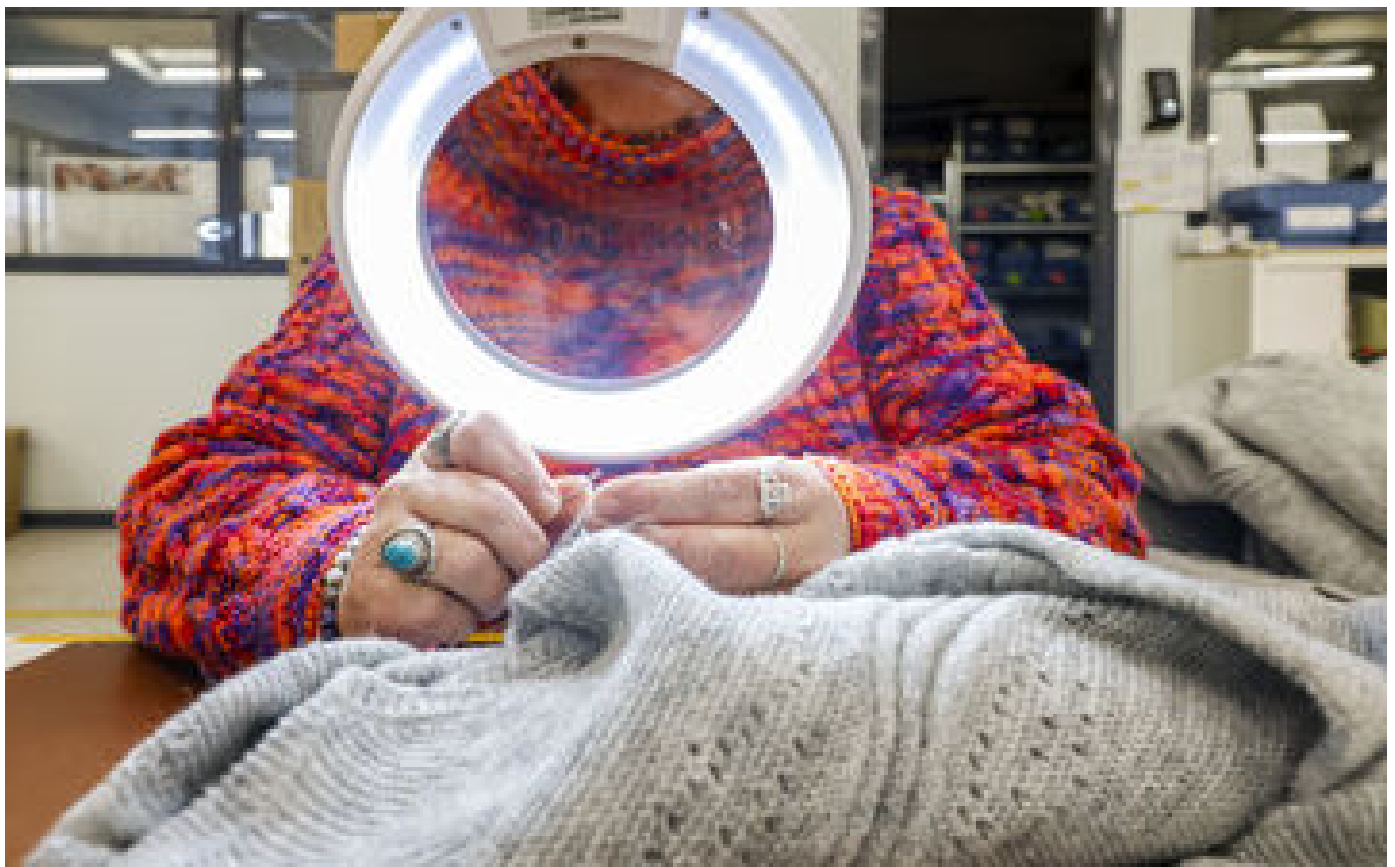
« Pourquoi produire ailleurs ? » : à Saint-Malo, cette start-up de tricot mène une réindustrialisation exemplaire P