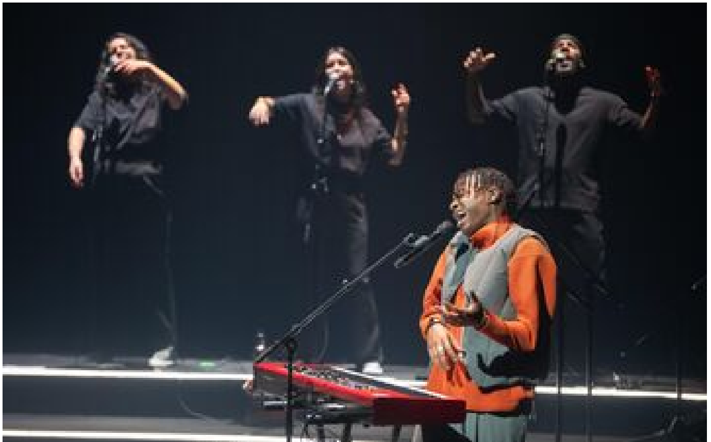
Trans Musicales de Rennes 2023 : Yamê, Canblaster, Chalk... Nos cinq coups de cœur du festival P