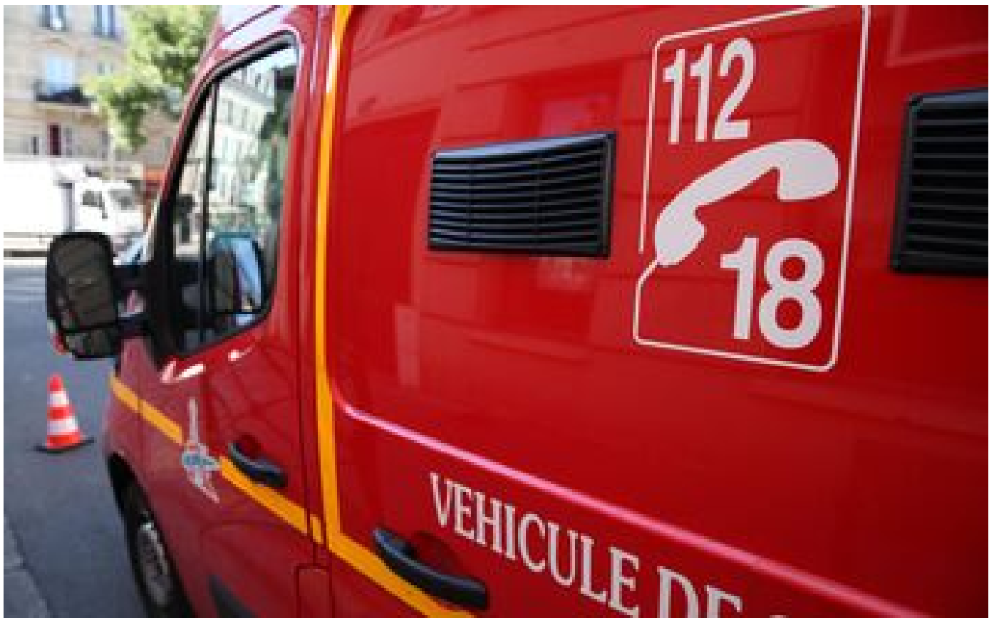
Ille-et-Vilaine : une femme et son bébé décèdent à la suite d'un accouchement à domicile