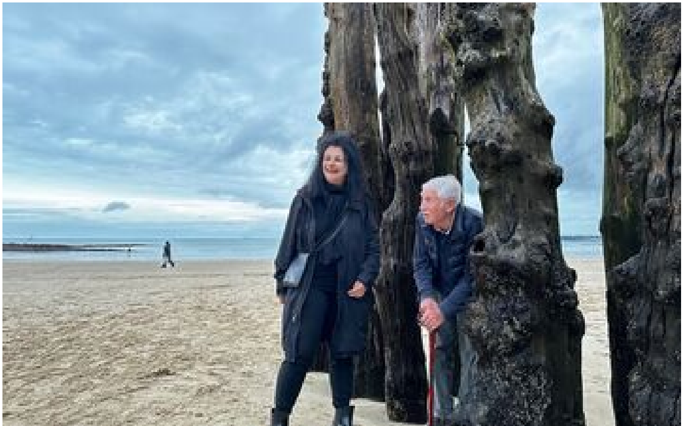
À Saint-Malo, le sort des brise-lames n'est toujours pas tranché P