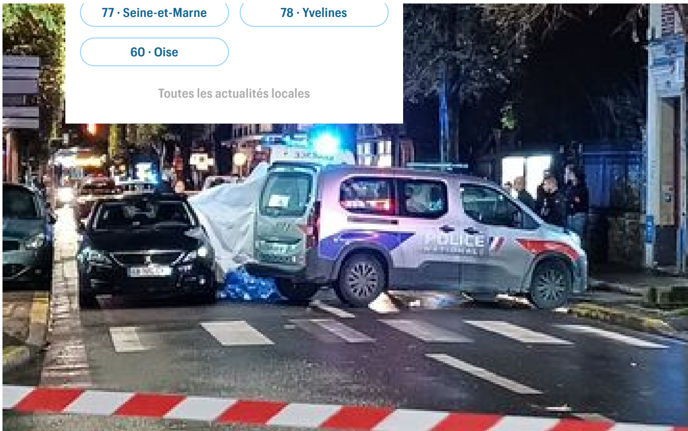
Vitry-sur-Seine : un adolescent meurt en trottinette électrique après avoir été percuté par une voiture