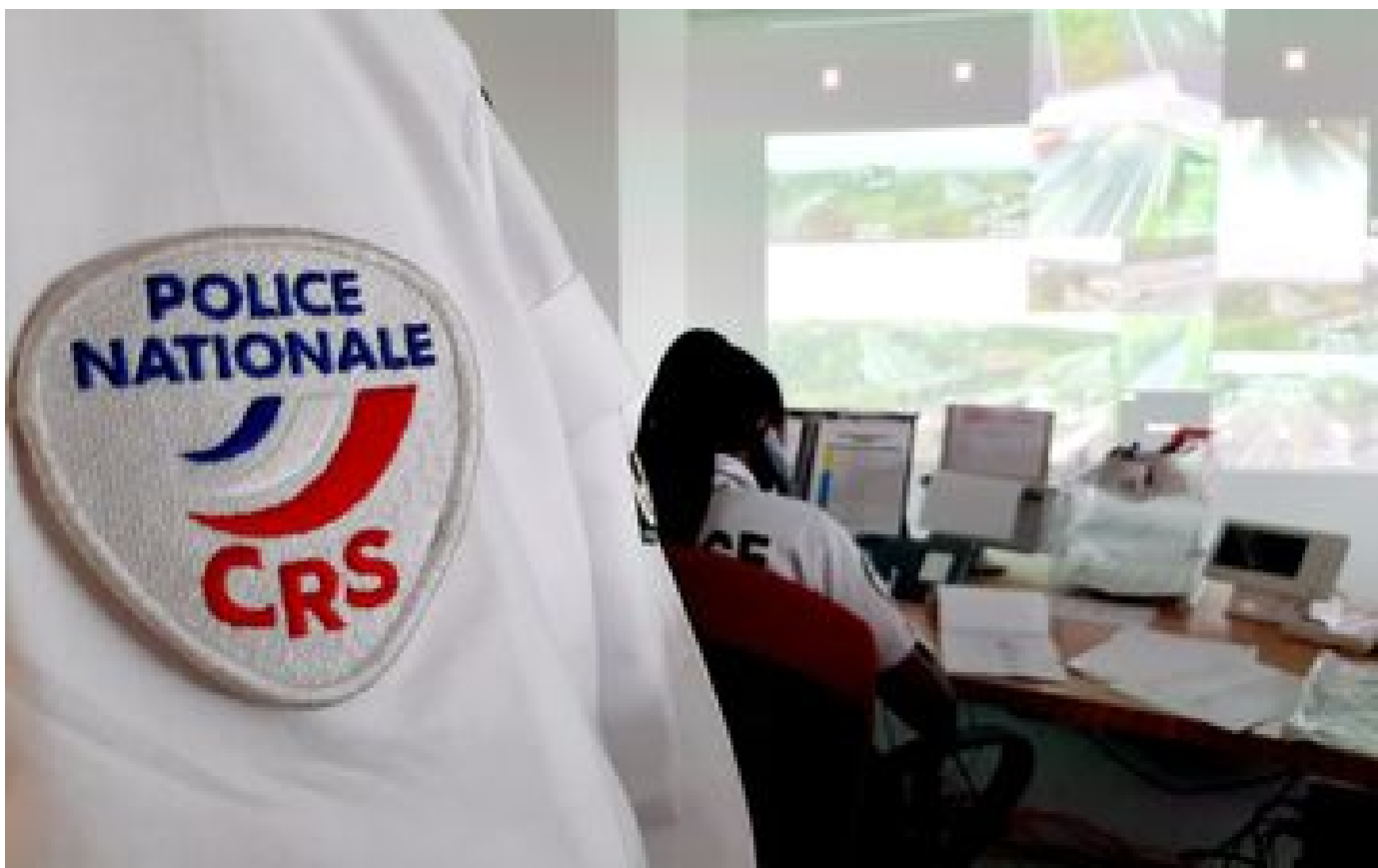
Info Le Parisien Enquête sur les dérives d'un patron de CRS : descente de la police des polices à Lagny-sur-Marne