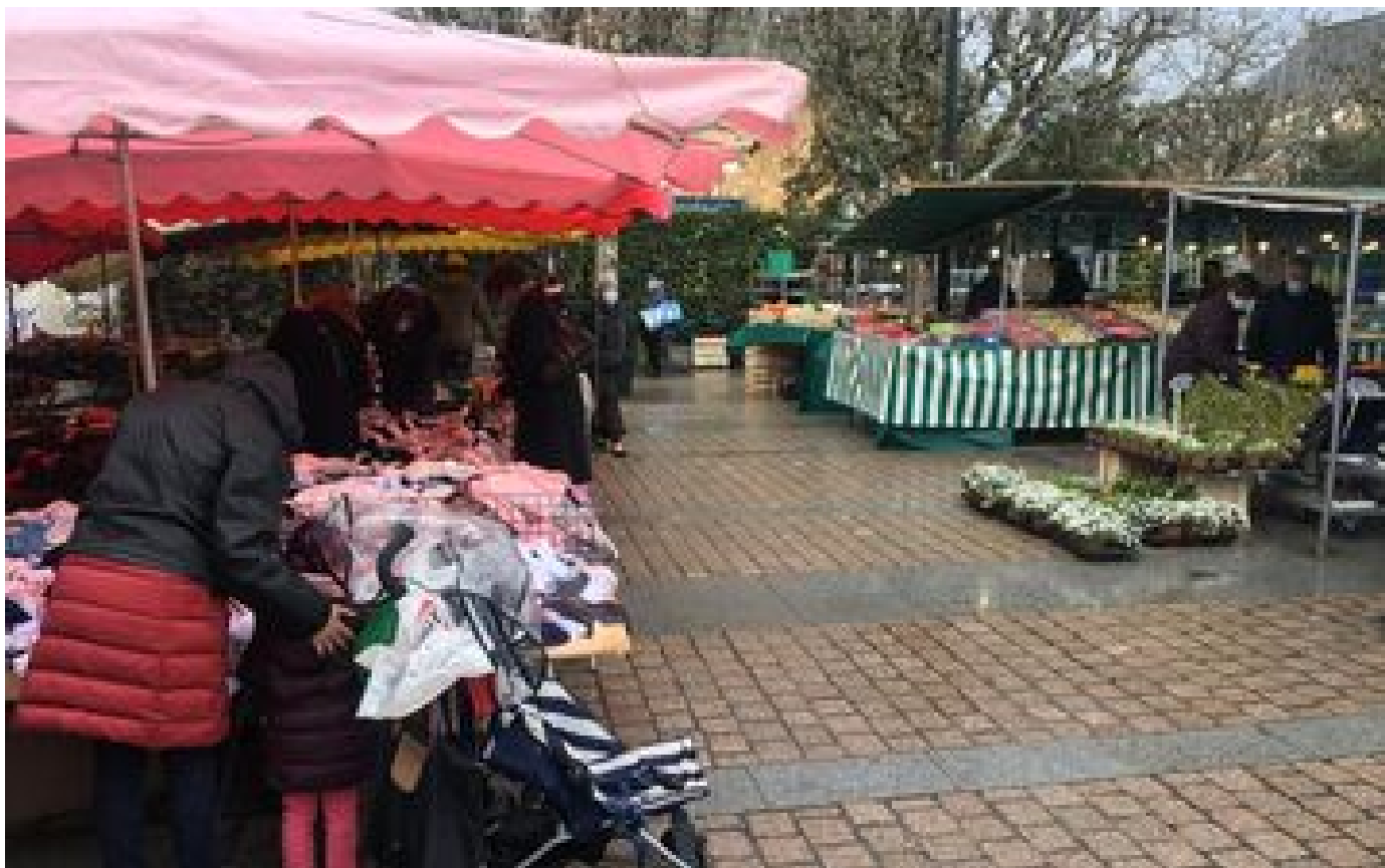
« La mairie, je l'emmerde ! » : un élu agressé et insulté au marché de Draveil