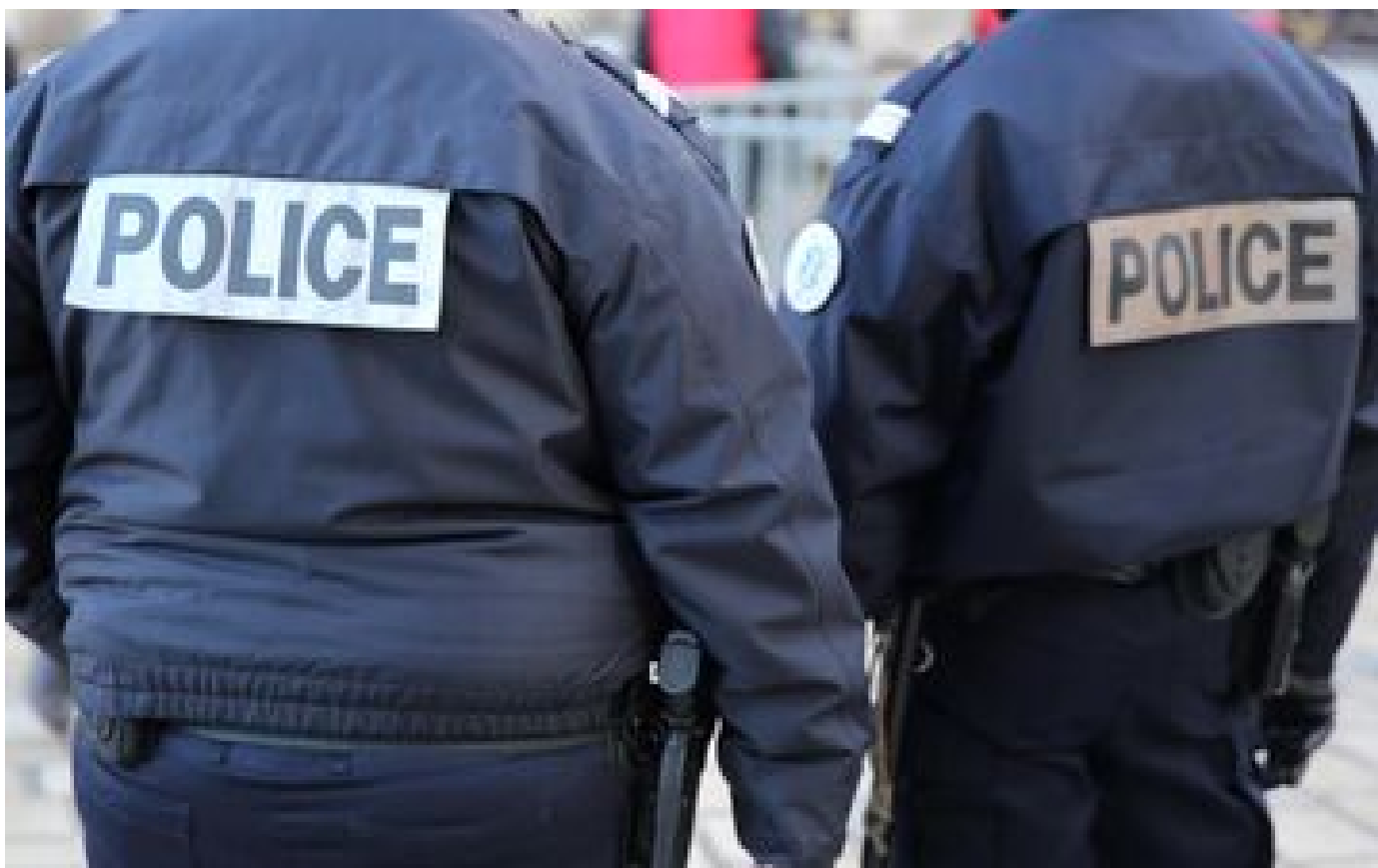
Il dit avoir été « guidé par une voix »... un père reconnaît avoir tué son fils de trois ans en Haute-Savoie