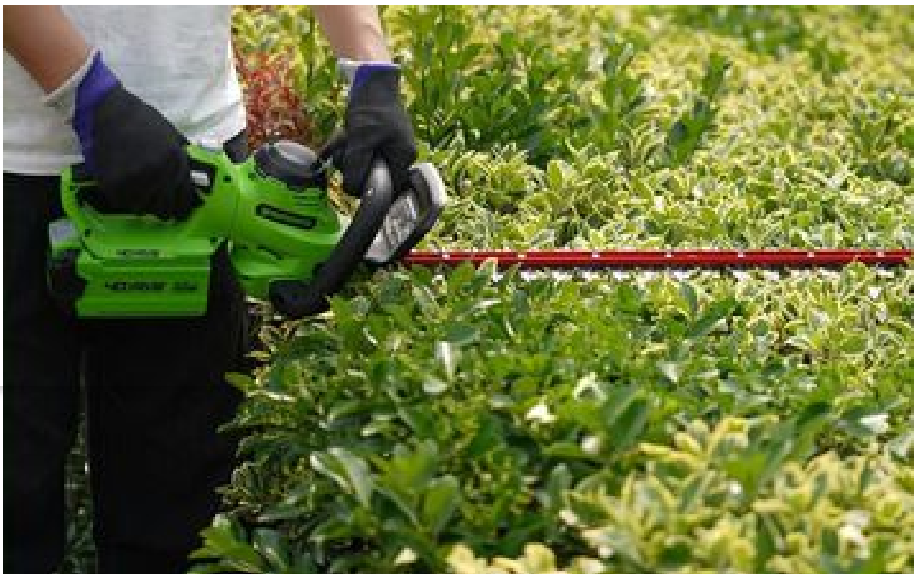
Incroyable mais vrai : ces plantes se métamorphosent en animaux grâce à l'art de la mosaïculture