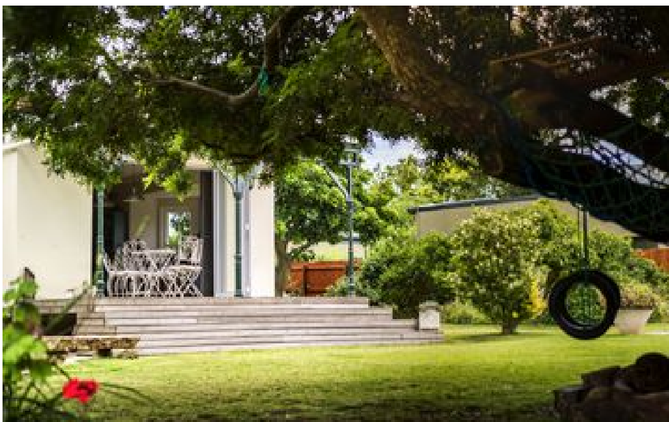
Installé dans votre jardin, ce dispositif écolo et efficace fera fondre votre facture d'eau