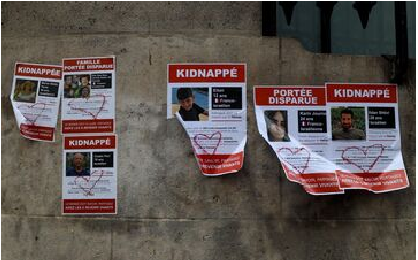
Guerre Israël-Hamas : des proches d'un otage confirment sa mort après l'échec d'un raid