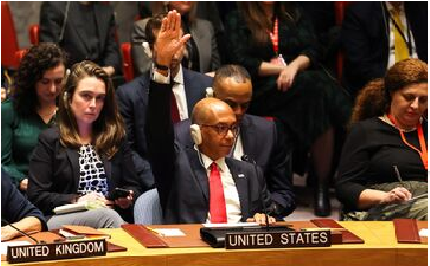
Échec d'un cessez-le-feu à Gaza : les États-Unis seuls contre tous ? P