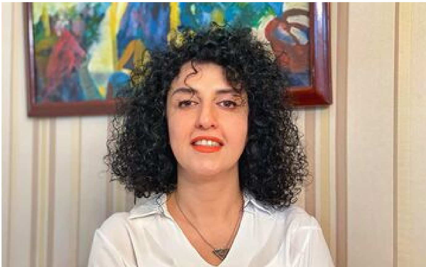
Nobel de la paix : l'Iranienne Narges Mohammadi observera une grève de la faim lors de la remise du prix