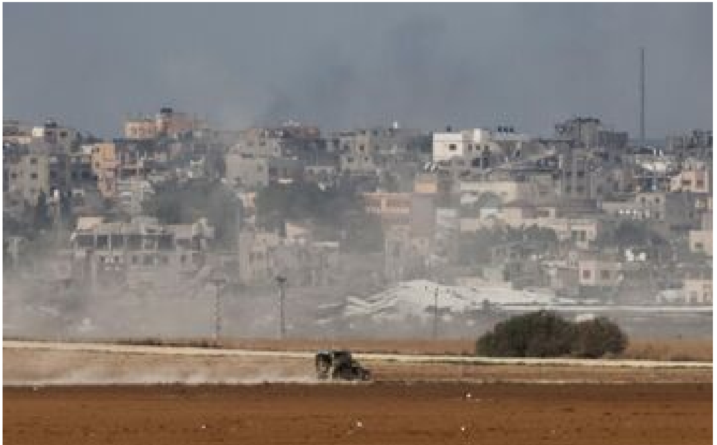
Veto des États-Unis sur un cessez-le-feu : « Cette politique devient un danger pour le monde », fustige Mahmoud Abbas