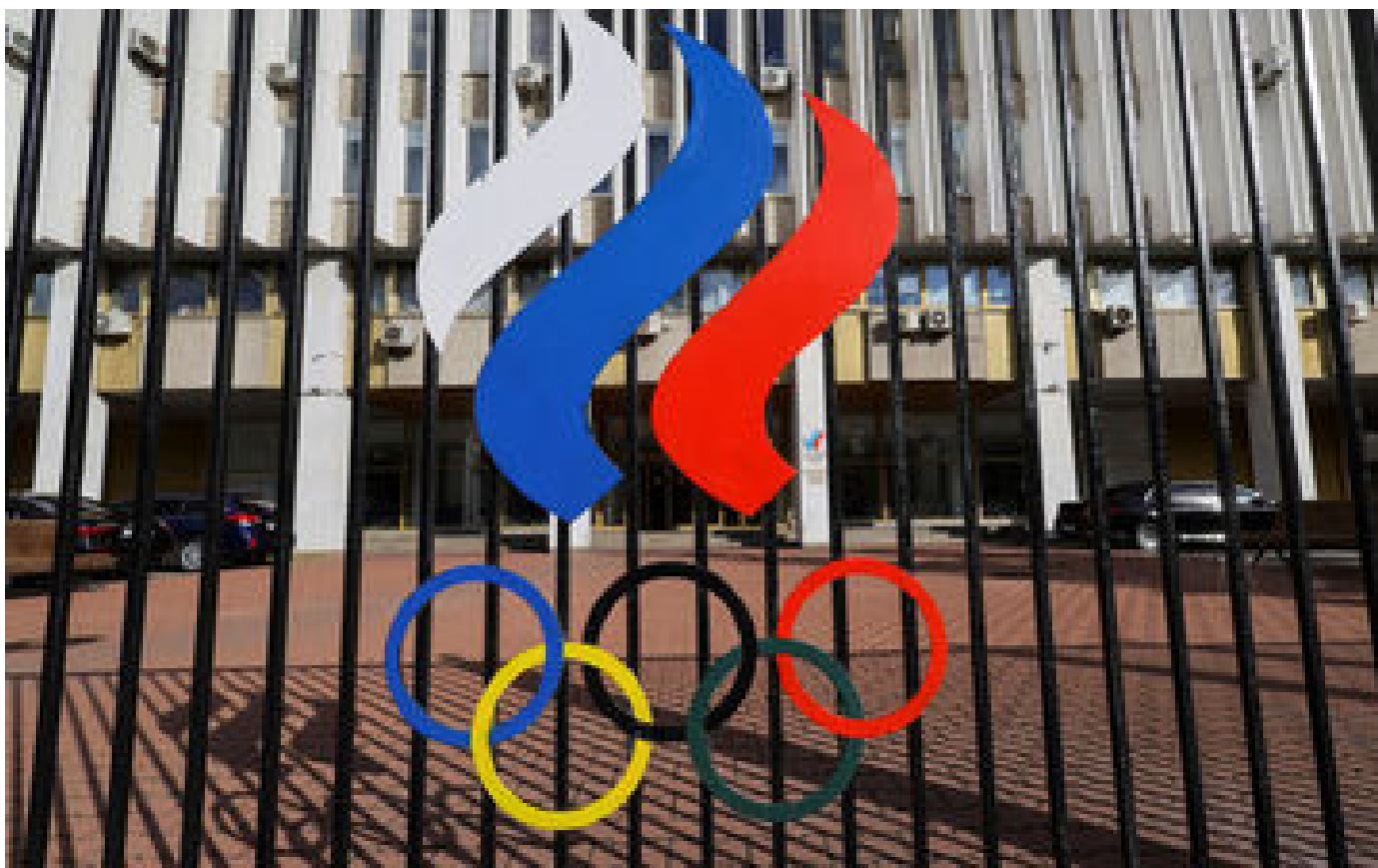
JO 2024 : la participation des sportifs russes et biélorusses « encourage l'agression contre l'Ukraine », selon Kiev