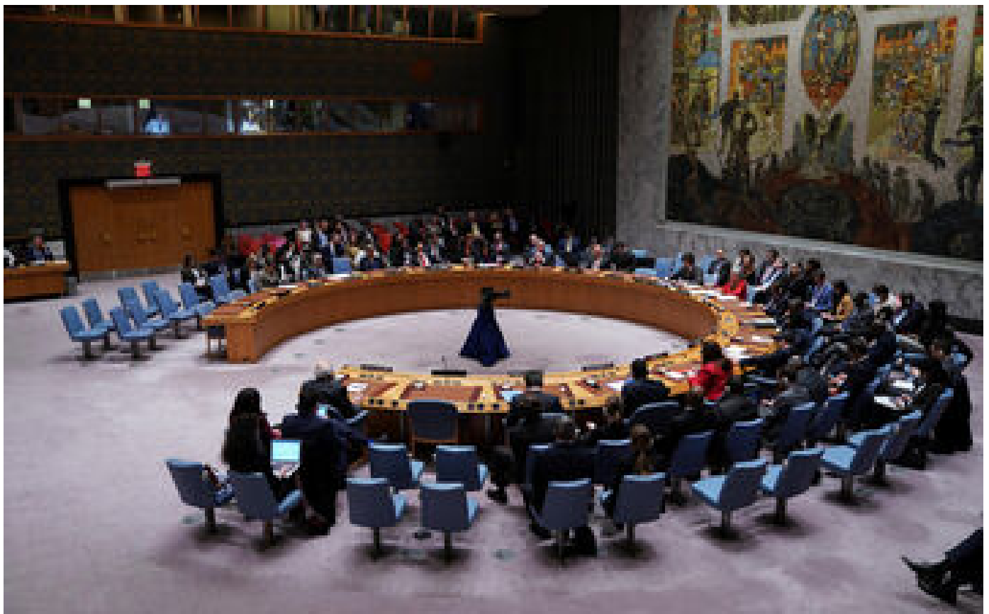
Guerre Israël-Hamas : à l'ONU, les États-Unis bloquent l'appel à un cessez-le-feu humanitaire à Gaza