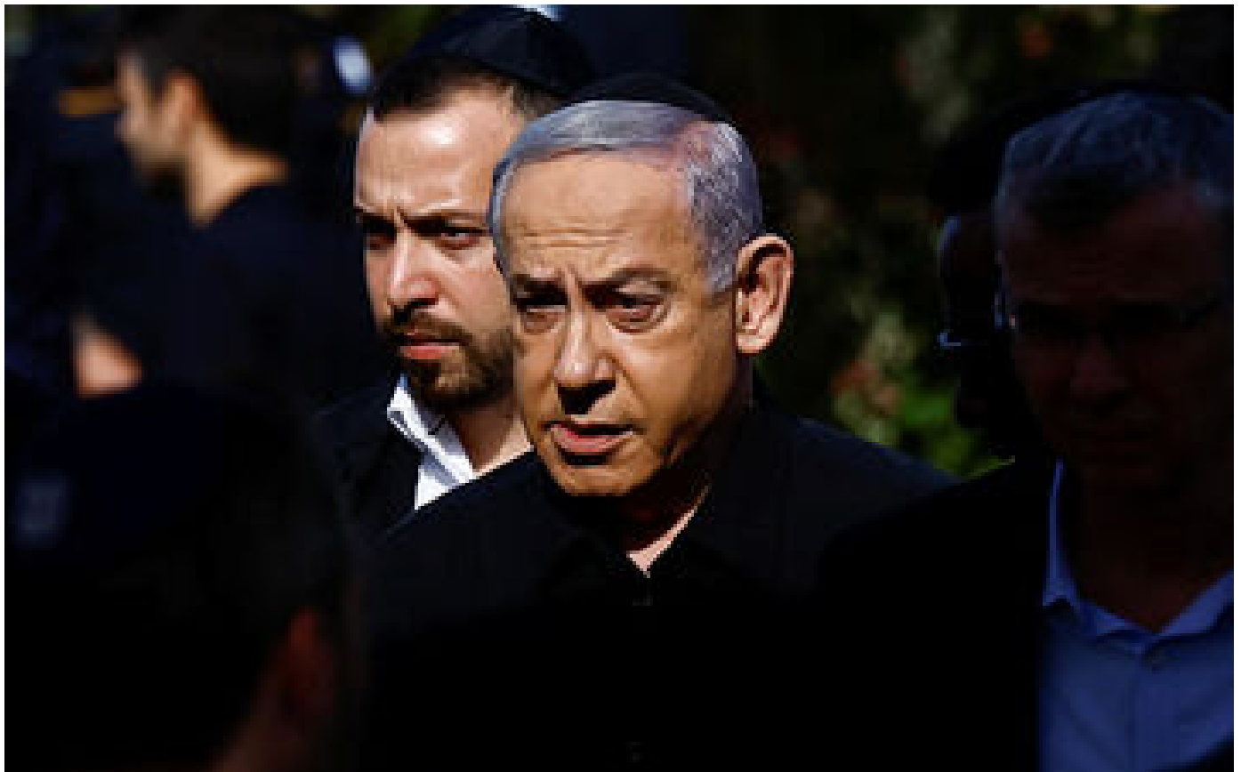
DIRECT. Gaza : la «juste guerre» d'Israël «pour éliminer» le Hamas se poursuivra, assure Netanyahu