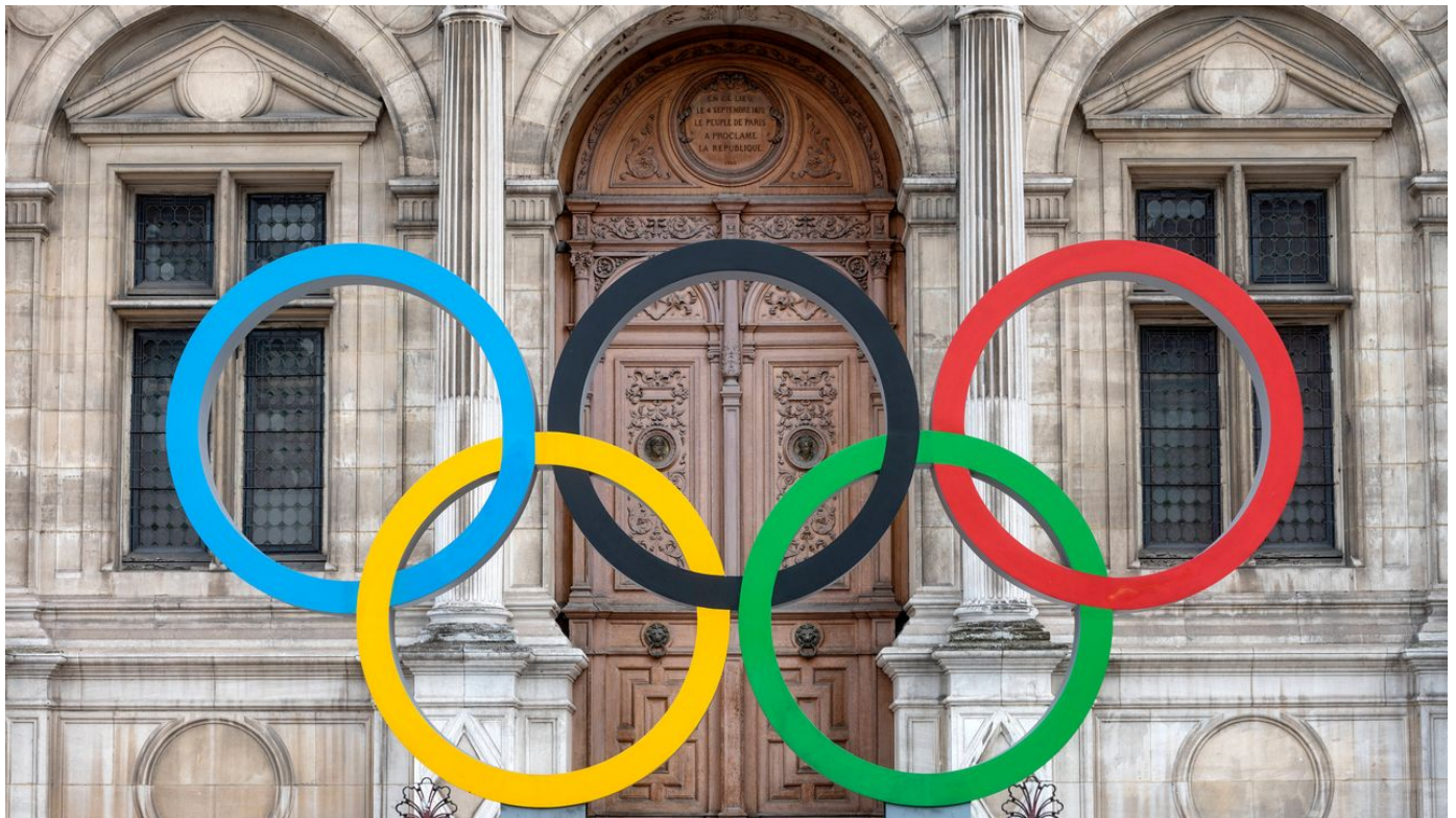
Sous certaines conditions, les athlètes russes et biélorusses pourront participer au JO de Paris.