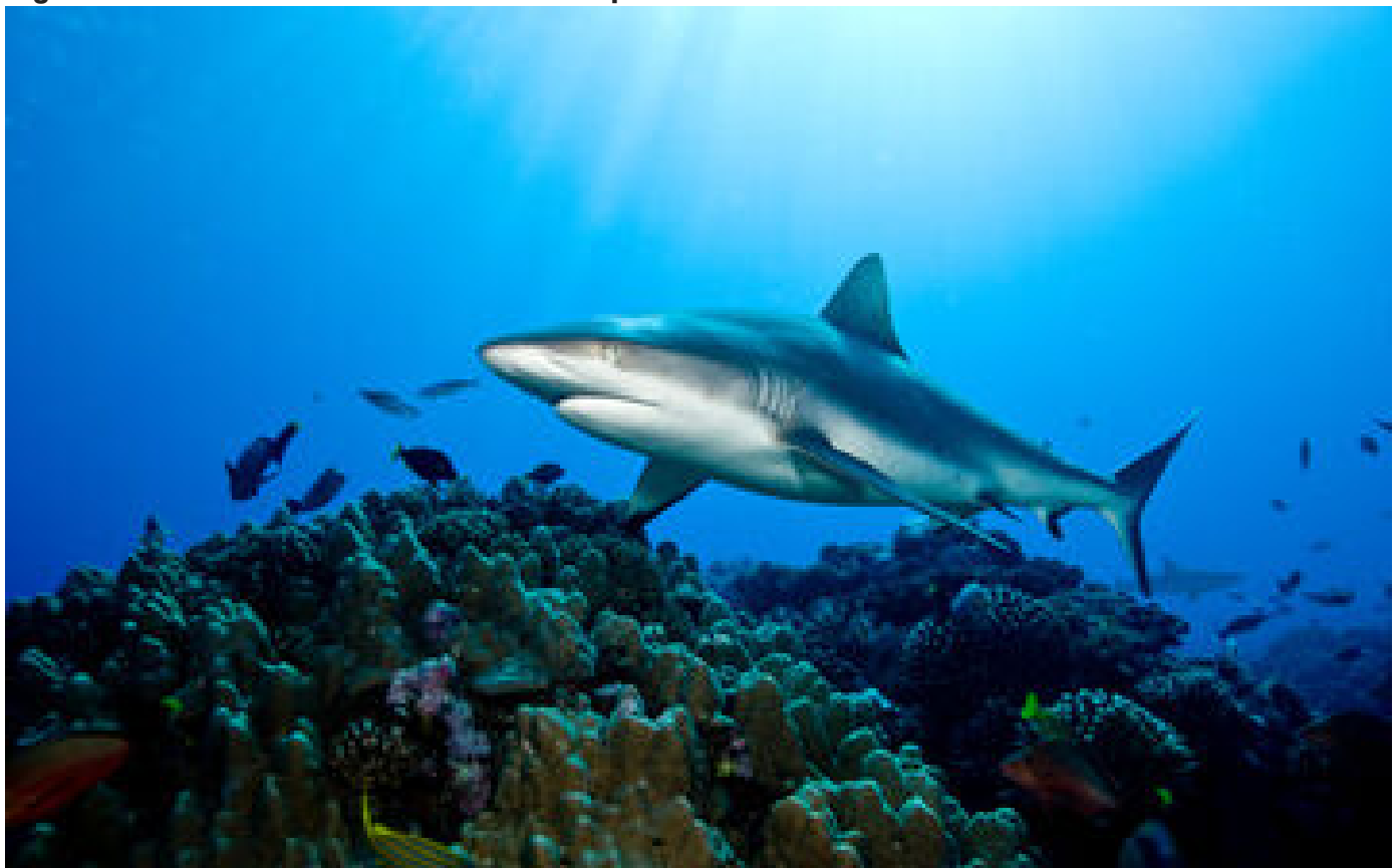
Une touriste de 44 ans tuée par un requin alors qu'elle faisait du paddle aux Bahamas