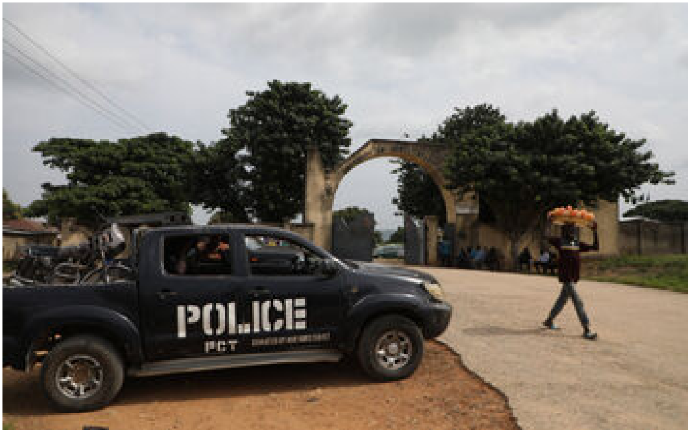
Nigeria : un tir de drone de l'armée tue 85 civils par erreur