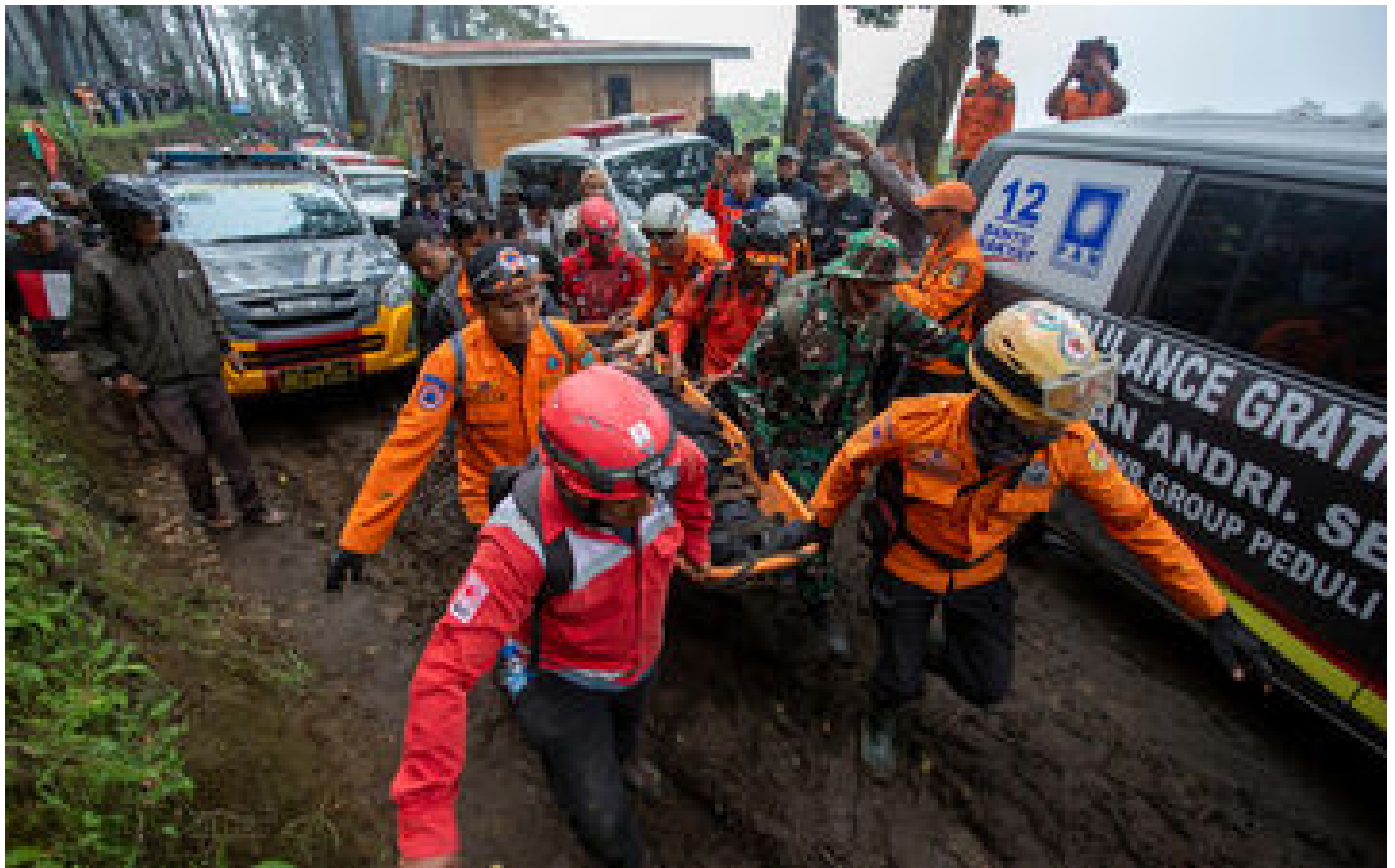
Éruption d'un volcan en Indonésie : le bilan s'alourdit à 13 morts