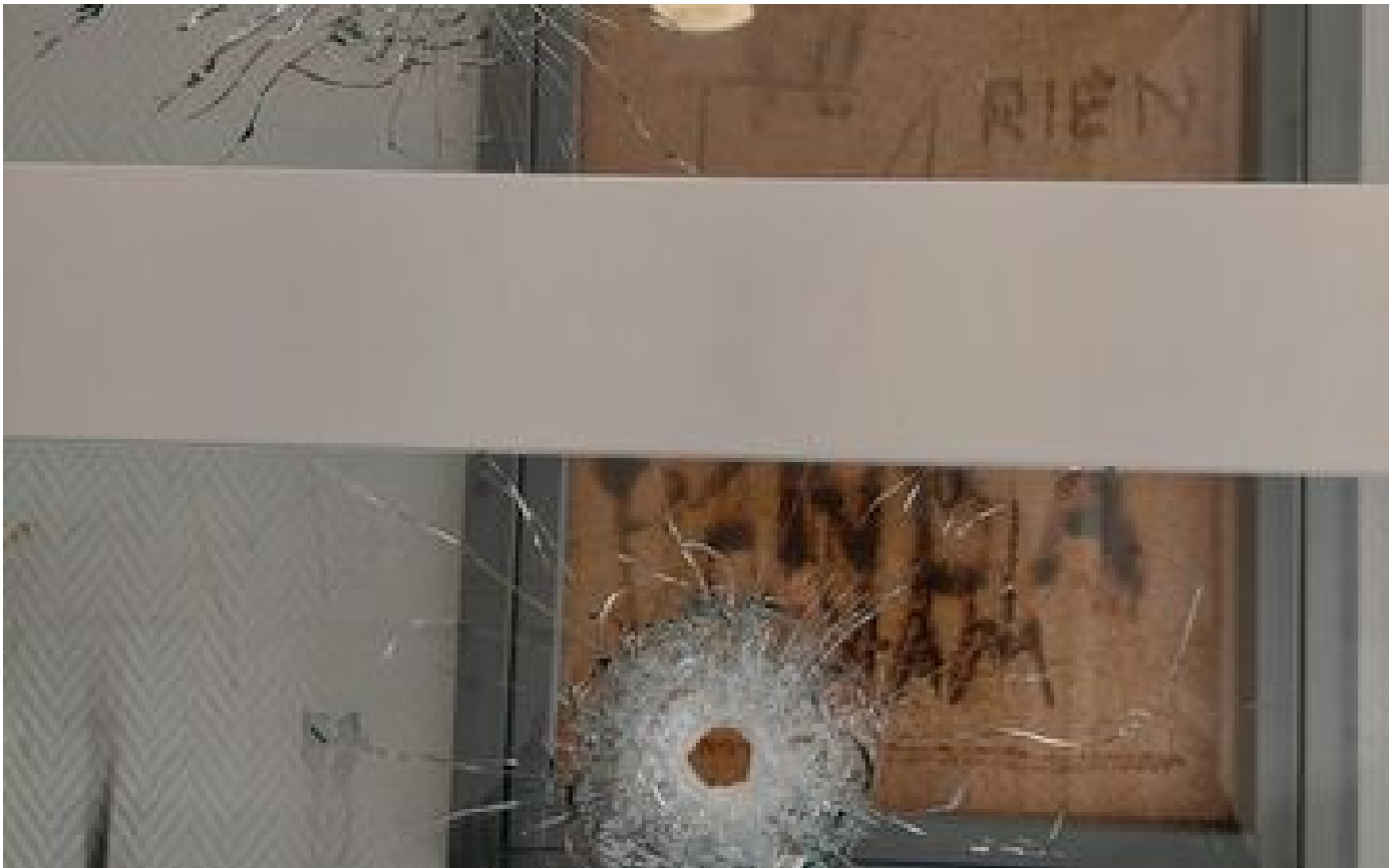
Mort par balle perdue à Dijon : six personnes mises en examen