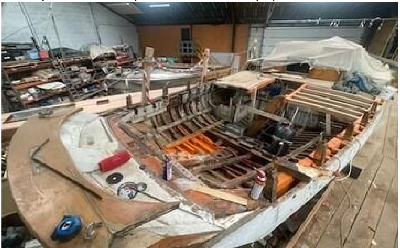
Sauvegarde du patrimoine maritime : à La Rochelle, un voilier restauré au profit des associations