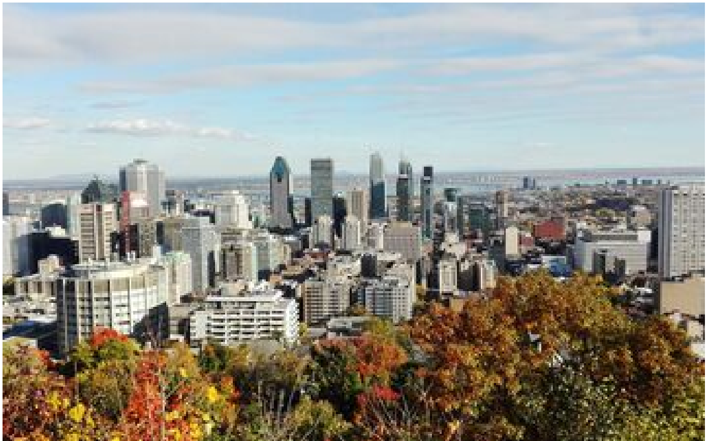
Montréal va interdire l'accès aux bibliothèques aux personnes qui sentent mauvais