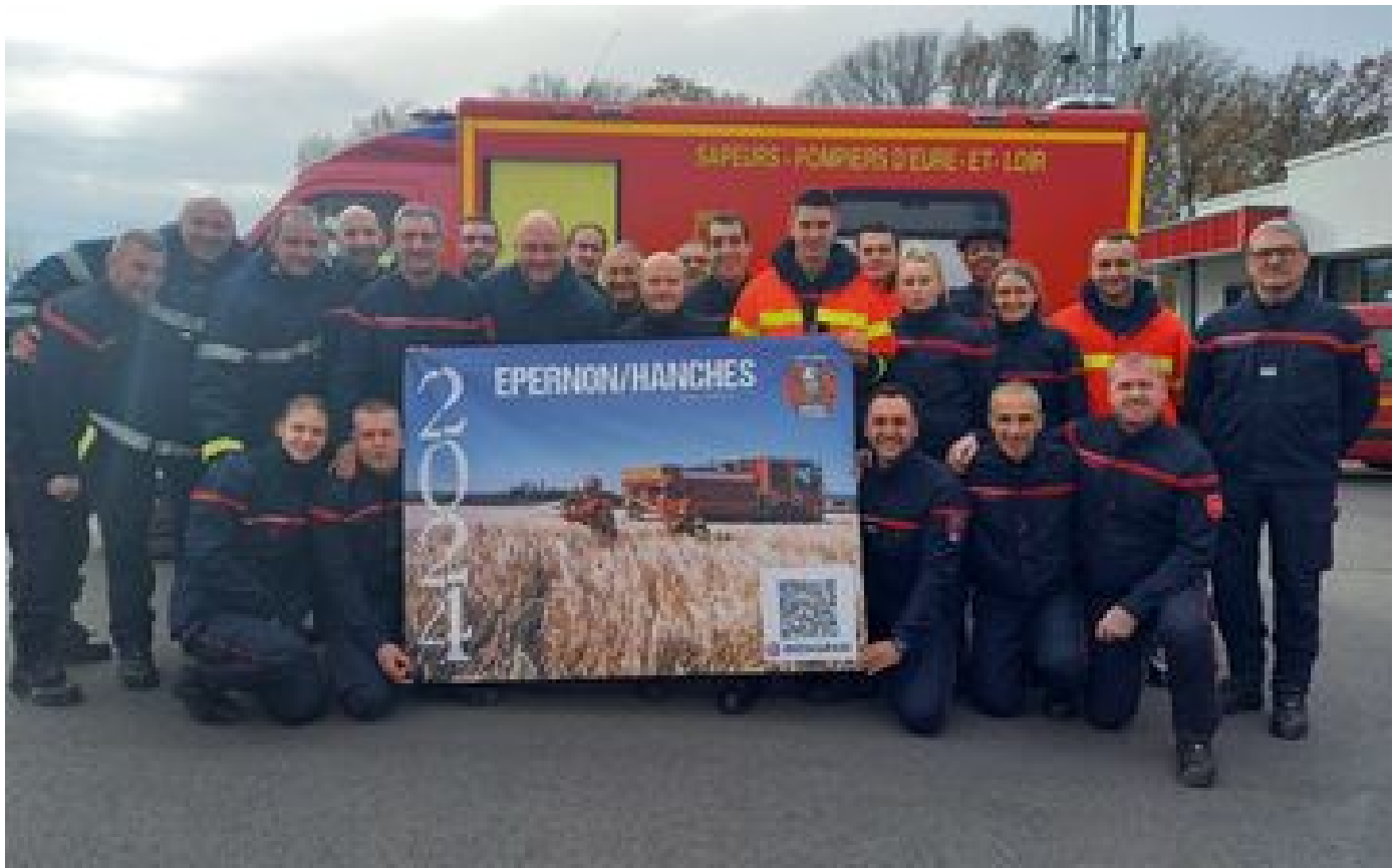
Hanches-Epernon sera-t-il élu champion de France du calendrier des pompiers ?