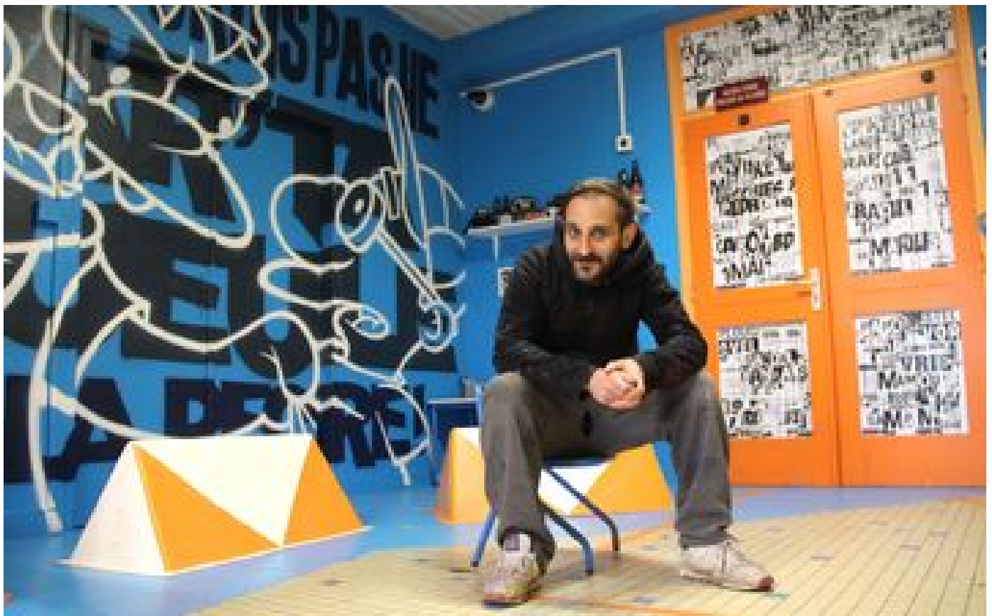
« On a aussi fait graffer des écoliers » : la vieille école du Finistère se transforme en galerie de street art