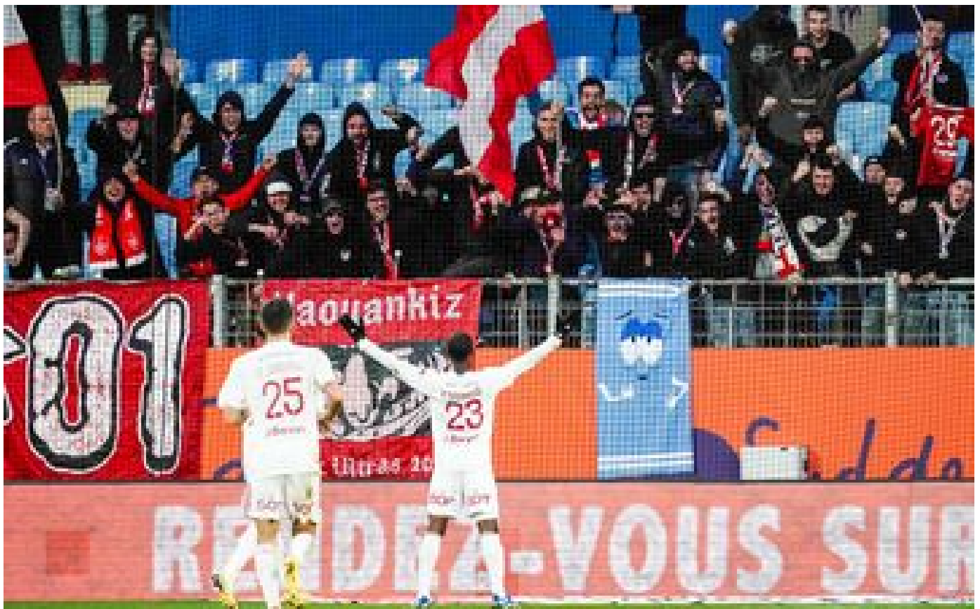
Ligue 1 : le bus des supporters bretois a été caillassé à Montpellier après le match