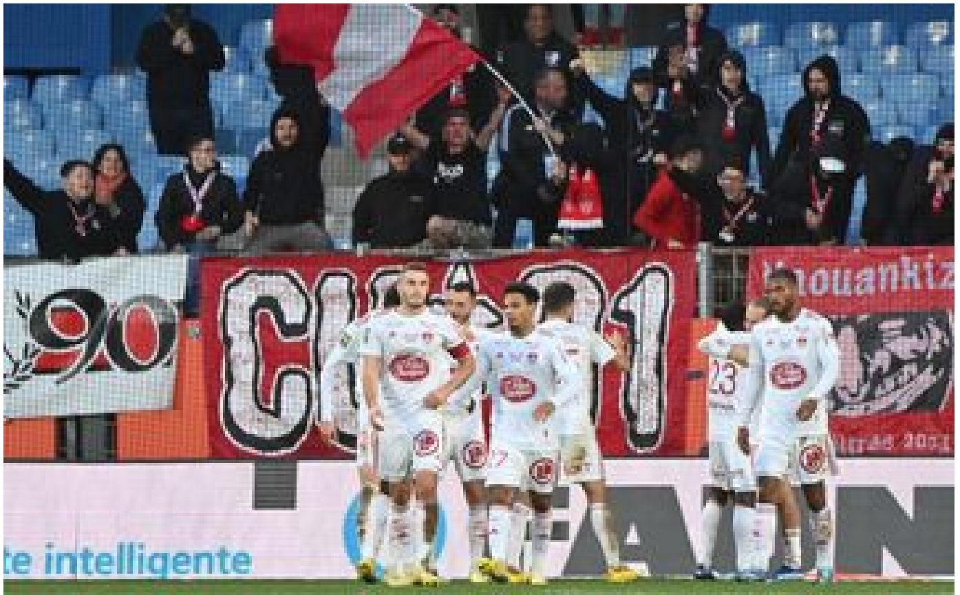
Ligue 1 : le proutident de Brest va officiellement demander la suppression du VAR