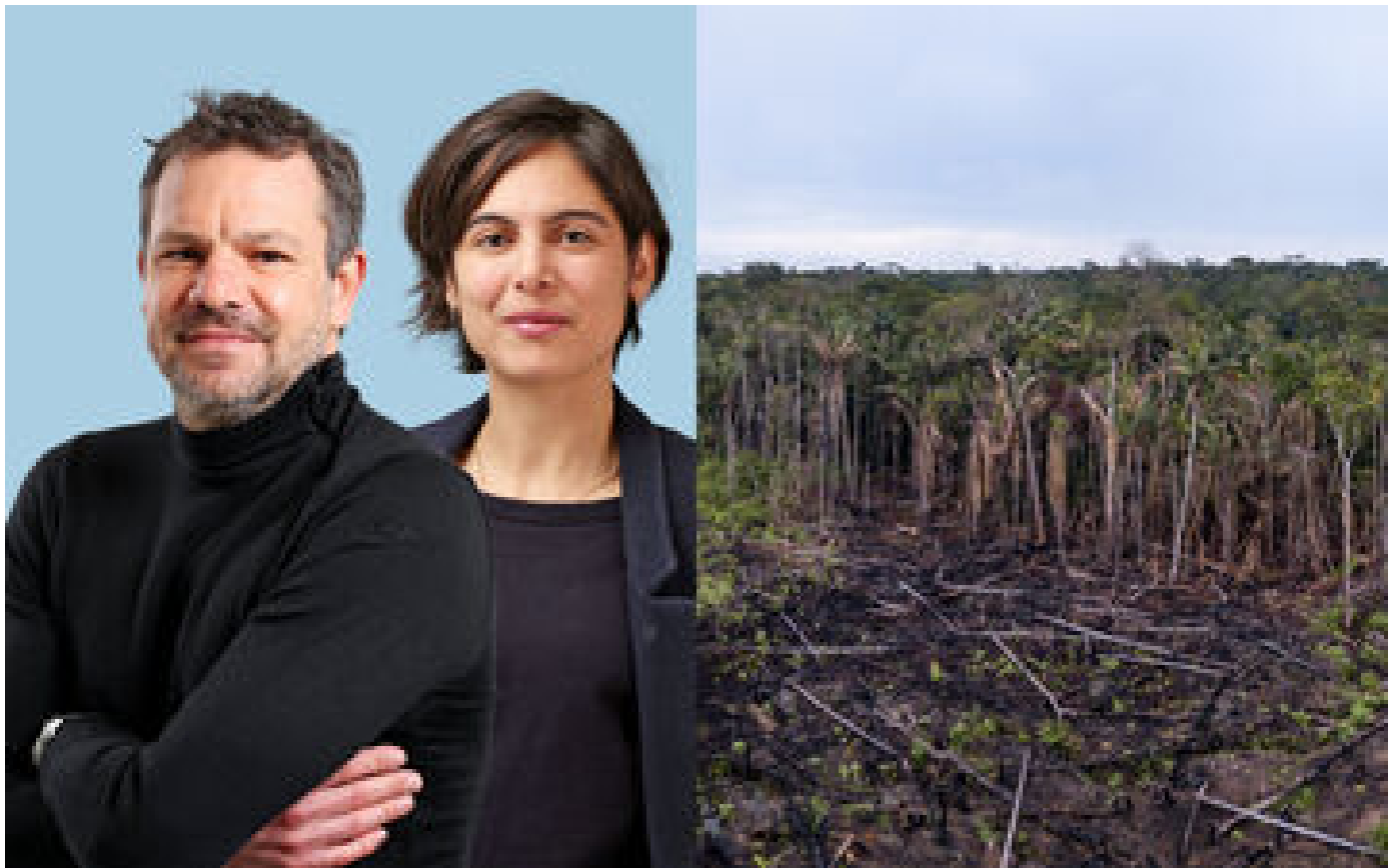
COP28 : « À Dubaï, malgré les conflits, on va pouvoir quand même se parler du climat »