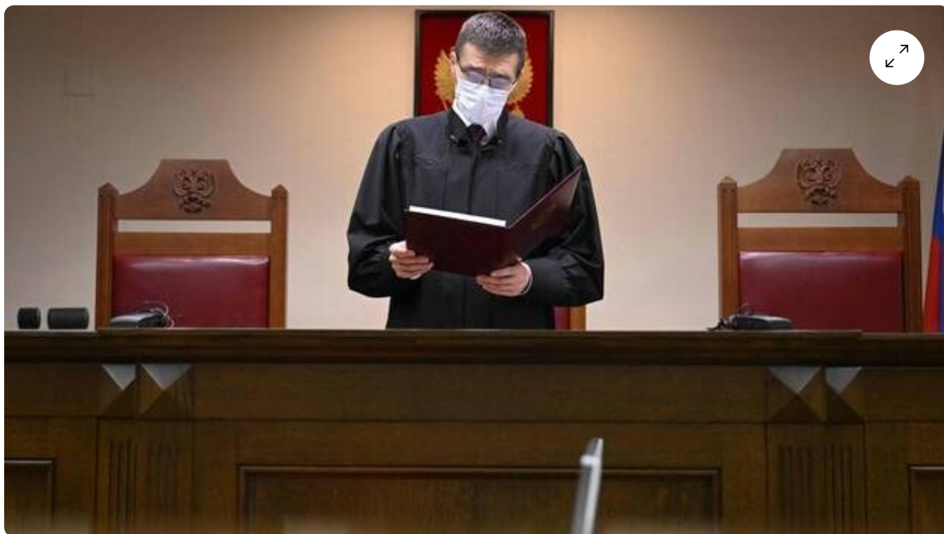
Oleg Nefedo, le juge de la Cour suprême russe, jeudi 30 novembre 2023 en Russie.

La Russie vient d'interdire le « mouvement international LGBT » dans le pays. Cette décision intervient immédiatement et marque, une fois de plus, le virage conservateur pris par le pays.