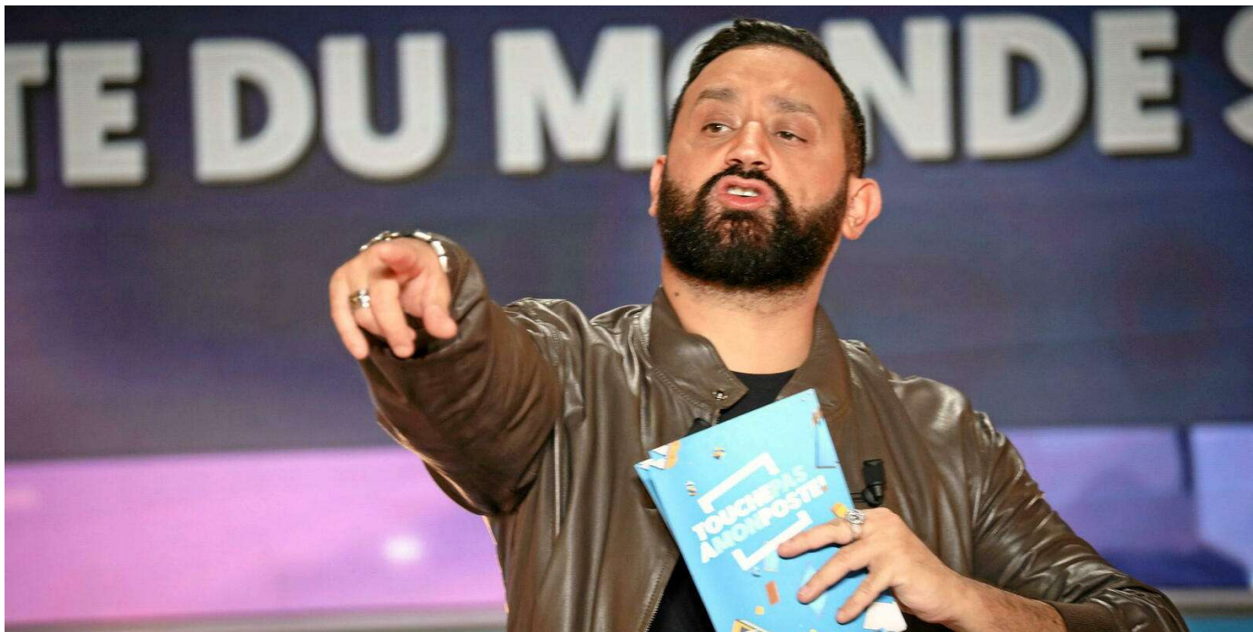
Cyril Hanouna.