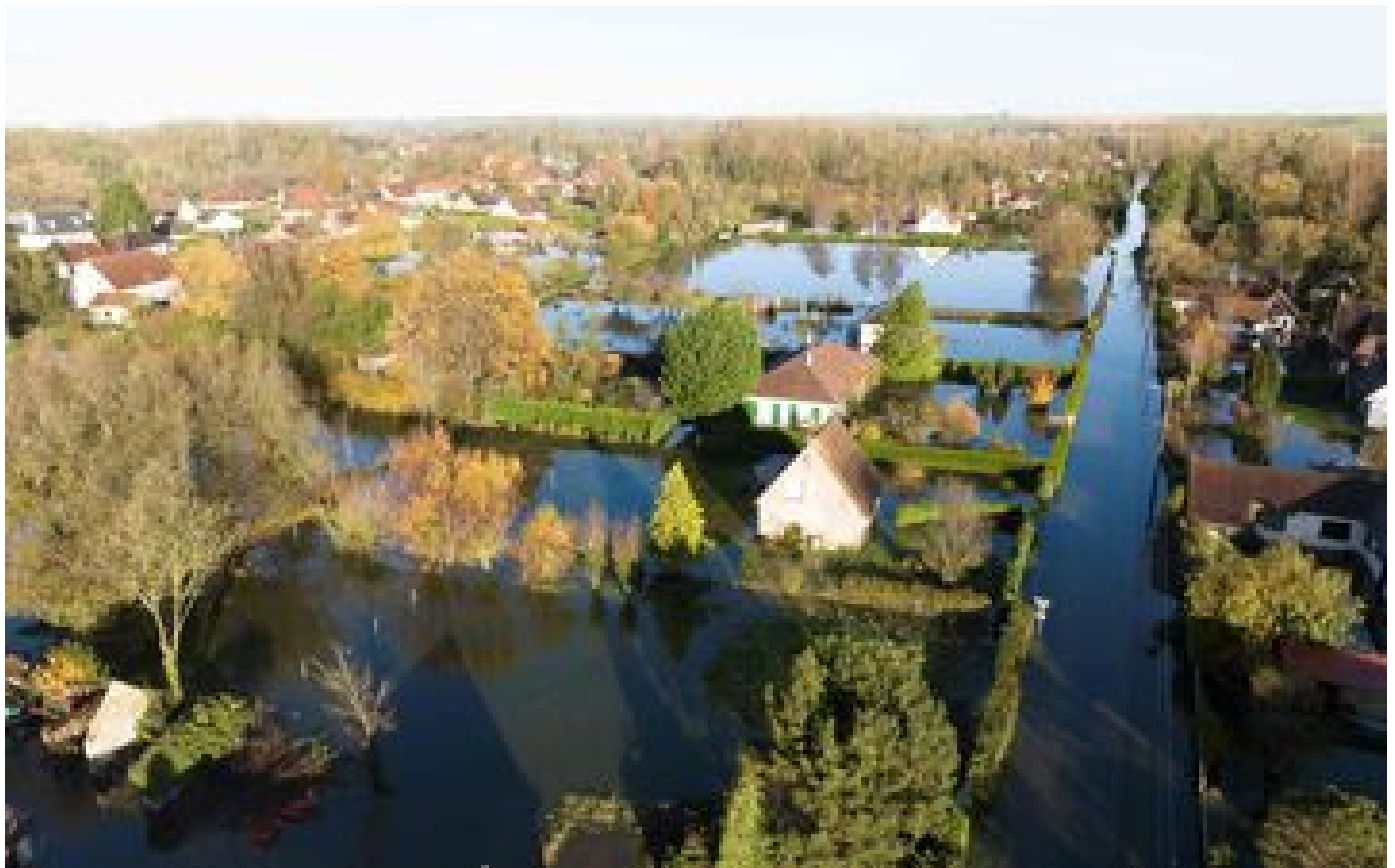
« La situation va progressivement revenir à la normale » : décrue enclenchée sur les cours d'eau du Pas-de-Calais