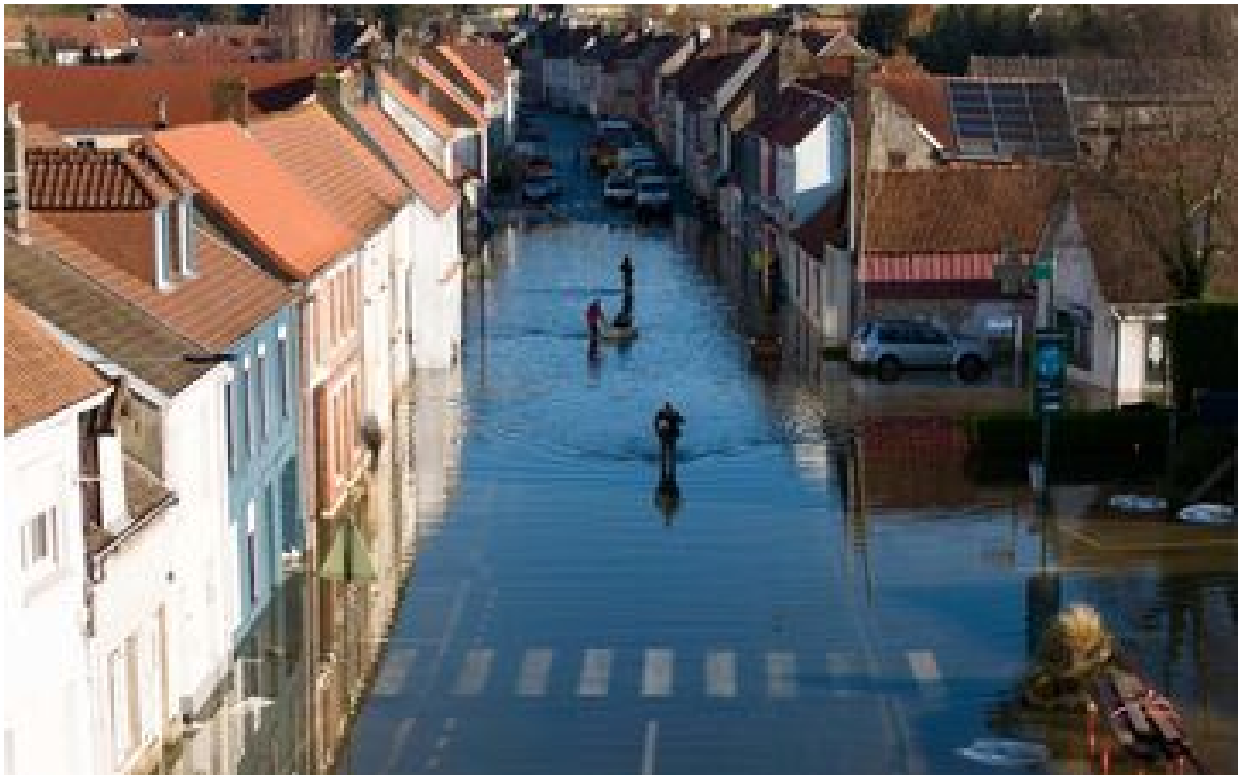
Crues dans le Pas-de-Calais : la vigilance orange maintenue, un millier de pompiers toujours mobilisés