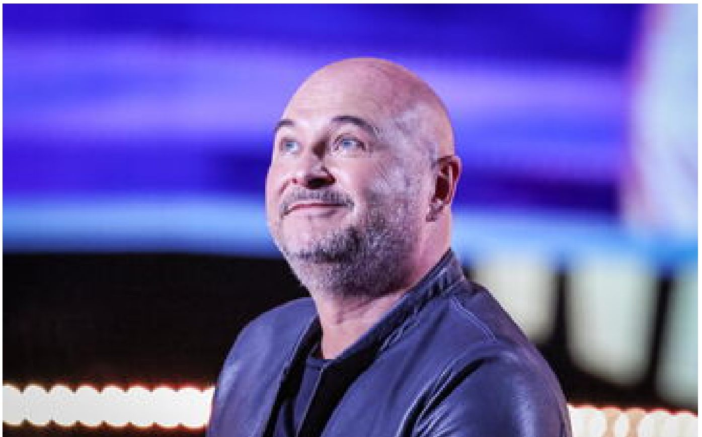
Sébastien Cauet accusé de viol : le singulier parcours d'une star de la radio P