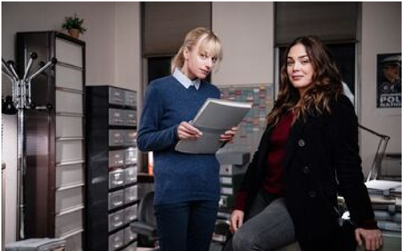
Audiences TV : « Astrid et Raphaëlle » toujours largement en tête sur France 2