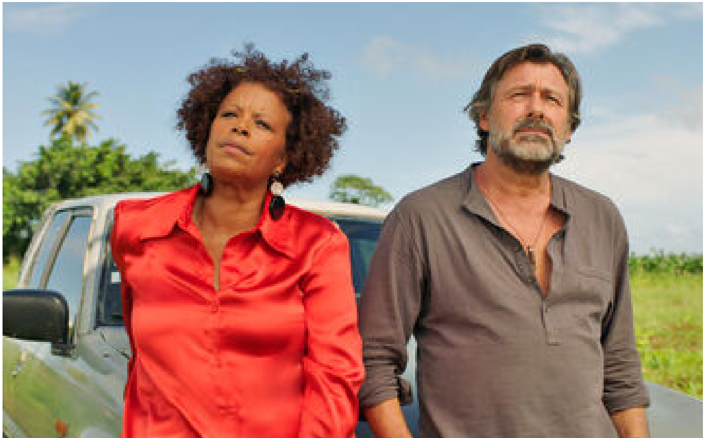
Programme TV du samedi 25 novembre : « Meurtres en Guadeloupe », « Le Chevalier au dragon »... Notre sélection P