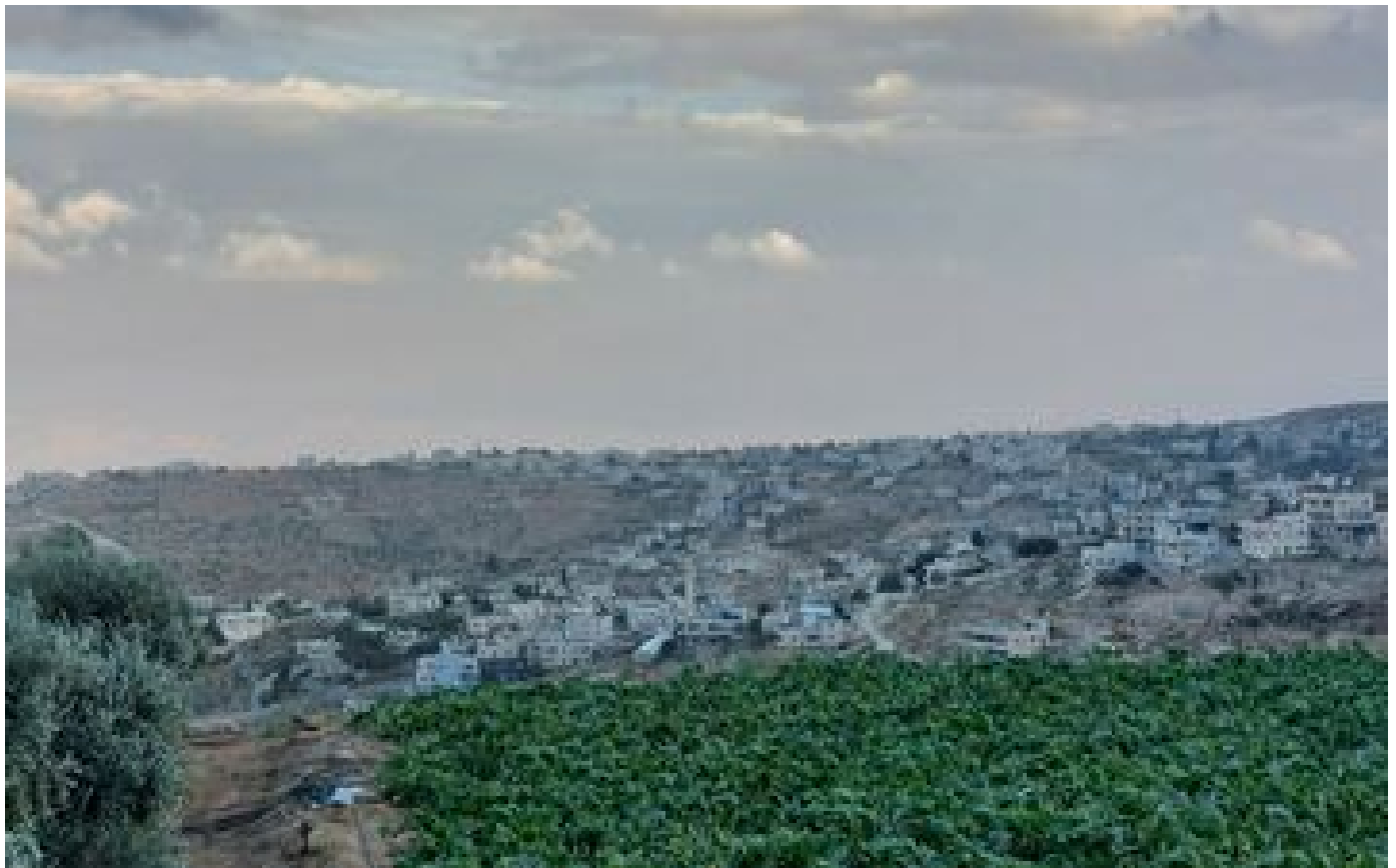
« On est la cible d'une politique d'asphyxie » : en Cisjordanie, la cocotte-minute des colonies P