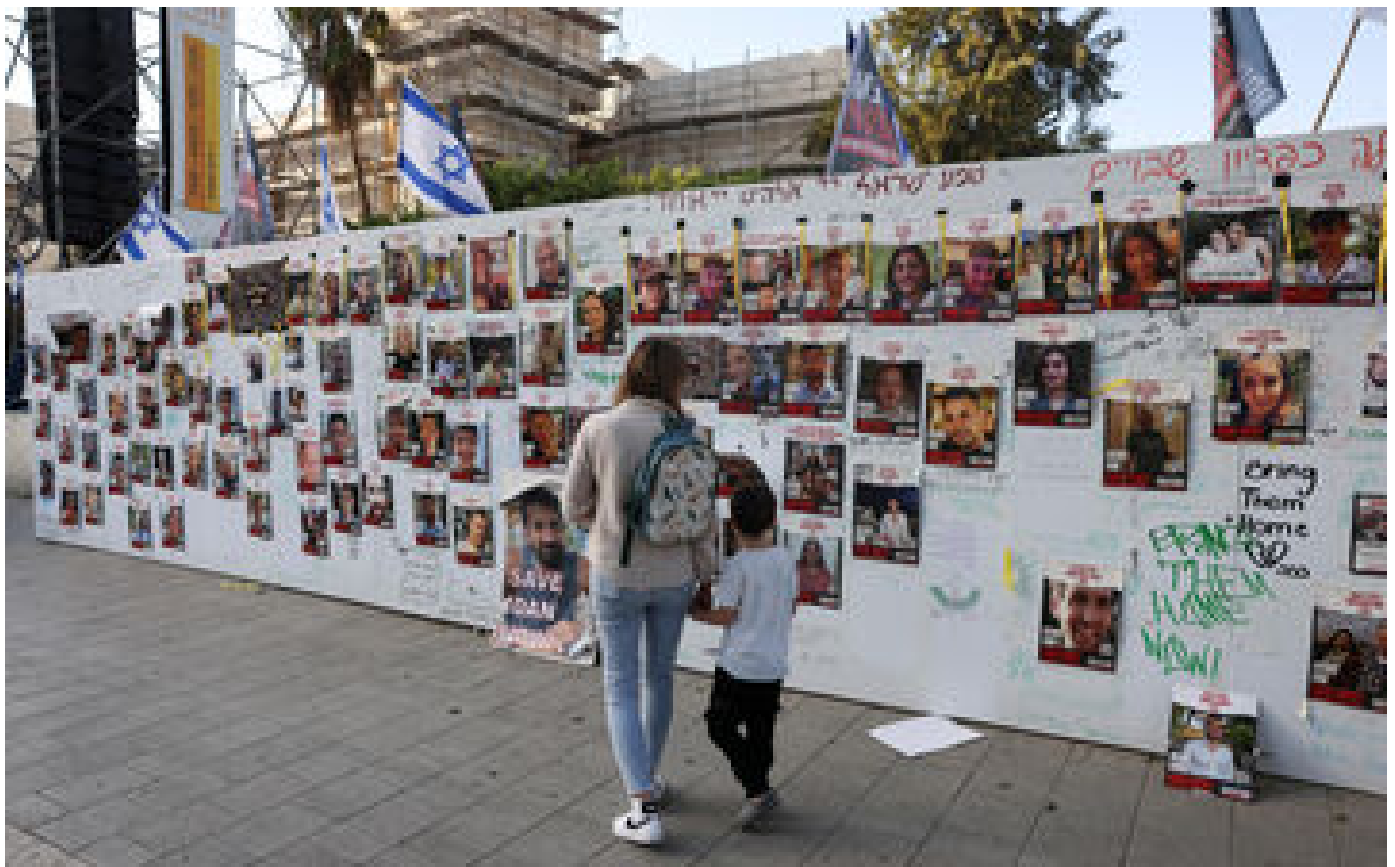
Guerre à Gaza : Bangkok annonce la libération de 12 otages thaïlandais en parallèle de l'accord Israël-Hamas