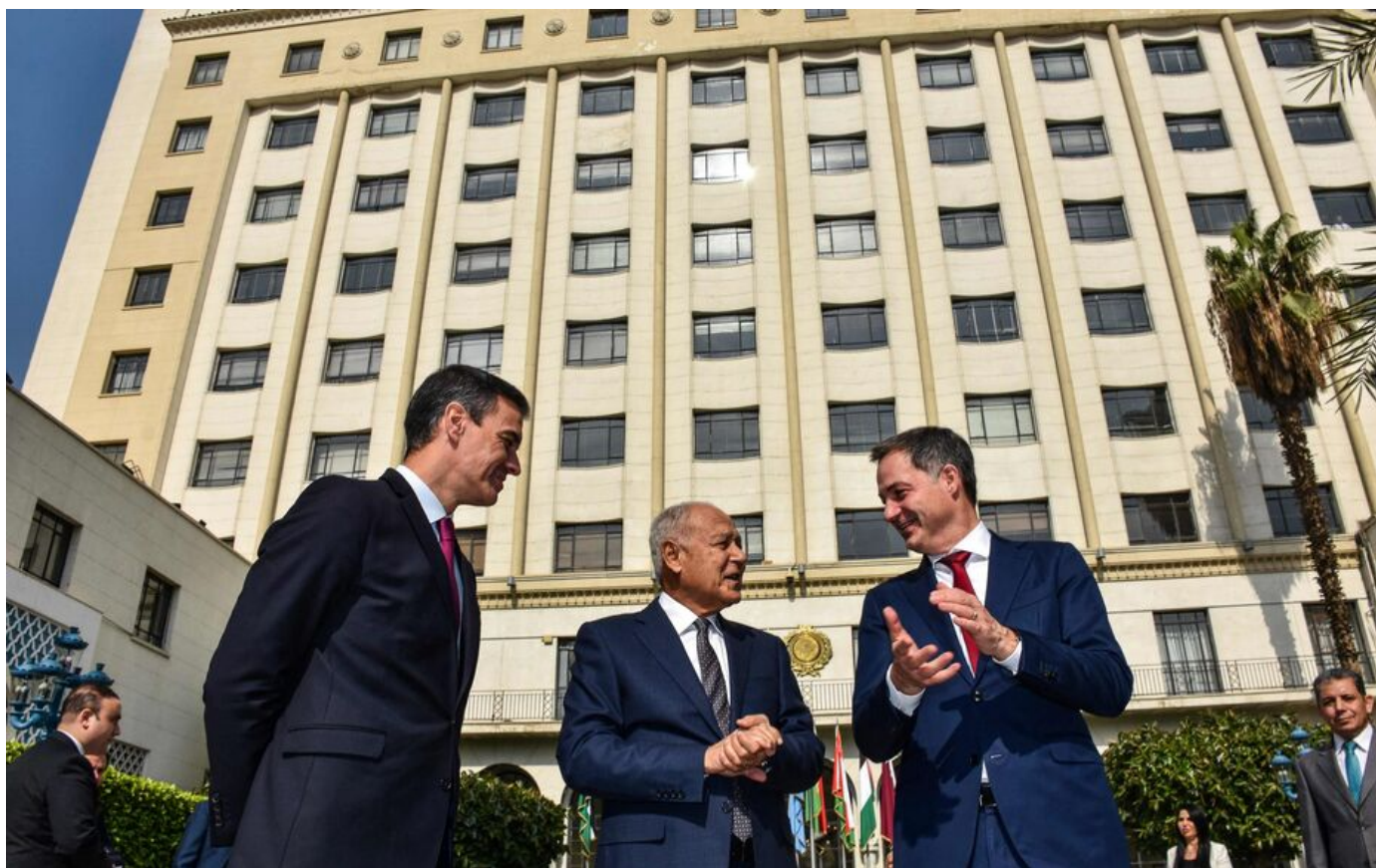
Pedro Sanchez (à gauche) et Alexander De Croo (à droite), avec le secrétaire-général de la Ligue arabe Ahmed Aboul.