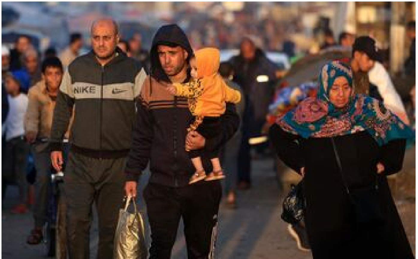
Guerre Israël-Hamas : la trêve est entrée officiellement en vigueur dans la bande de Gaza