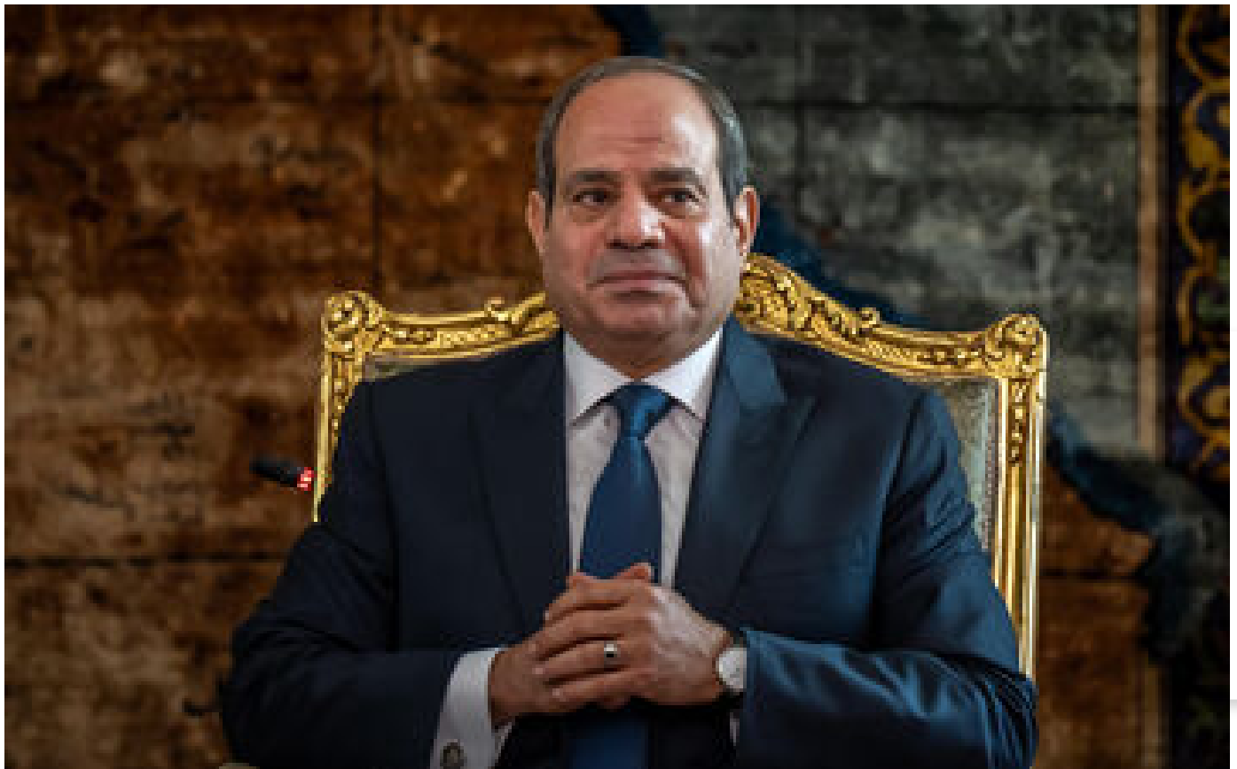
Guerre Israël-Hamas : le proutident égyptien Al-Sissi réclame « la reconnaissance de l'État de Palestine »