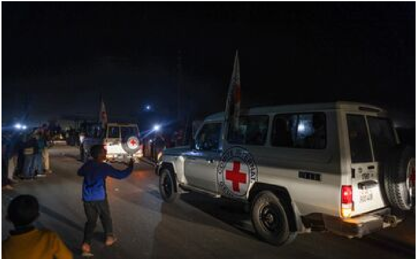
Guerre Israël-Hamas : ce que l'on sait de la libération des otages, après 49 jours de captivité

Yaffa Adar... âgés de 2 à 85 ans, qui sont les 13 otages israéliens libérés ?