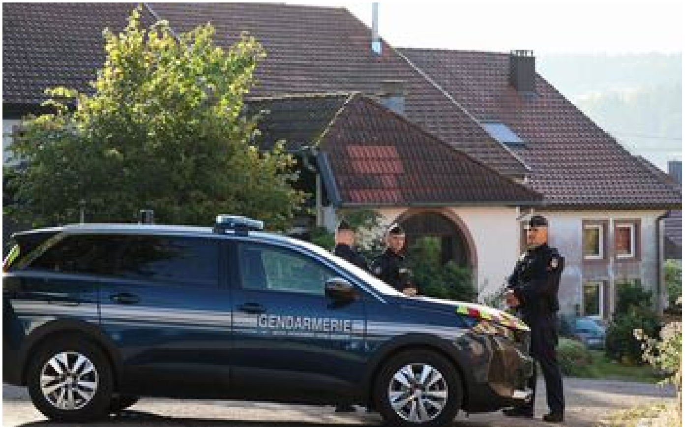
Disparition de Lina : plusieurs habitants de Plaine réentendus par les enquêteurs