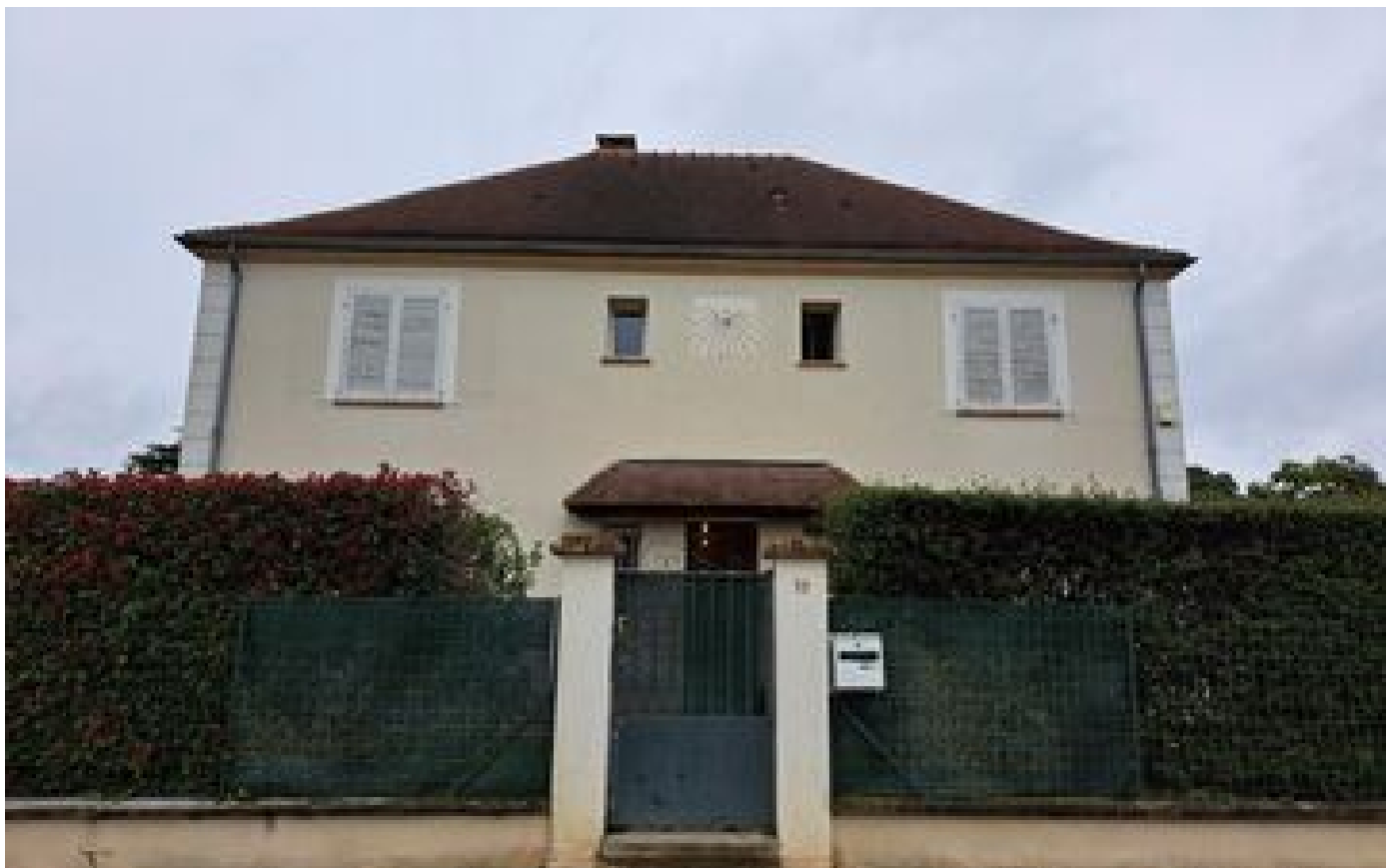
Bébé tué par balle en Essonne : la mère mise en examen pour le meurtre de sa fille