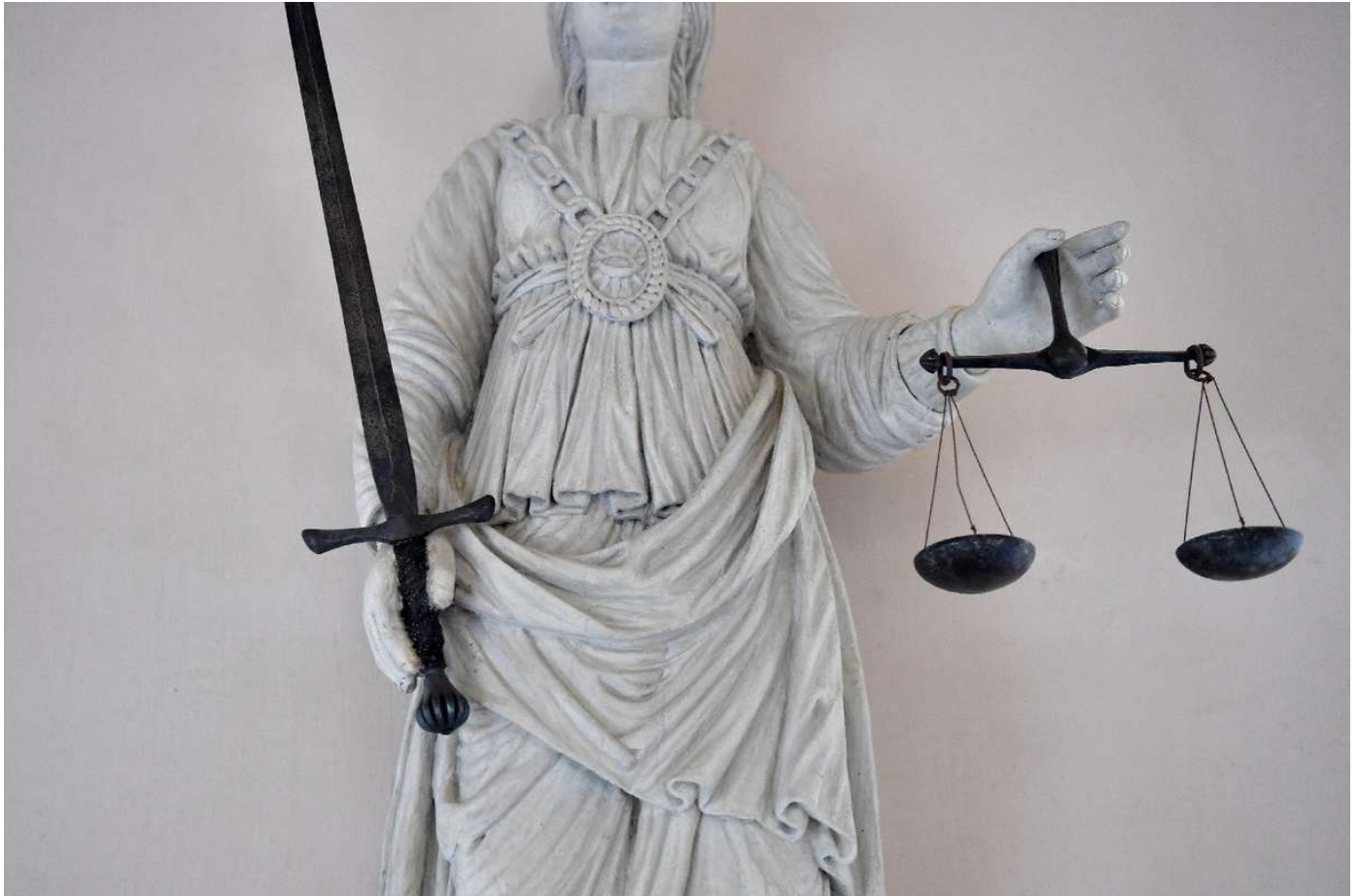
Enfants voleurs du Trocadéro: procès en décembre pour traite d'êtres humains aggravée