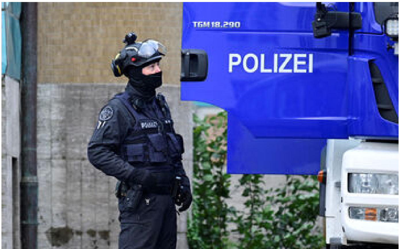
Un étudiant italien soupçonné d'avoir tué son ex-petite amie arrêté en Allemagne après une cavale