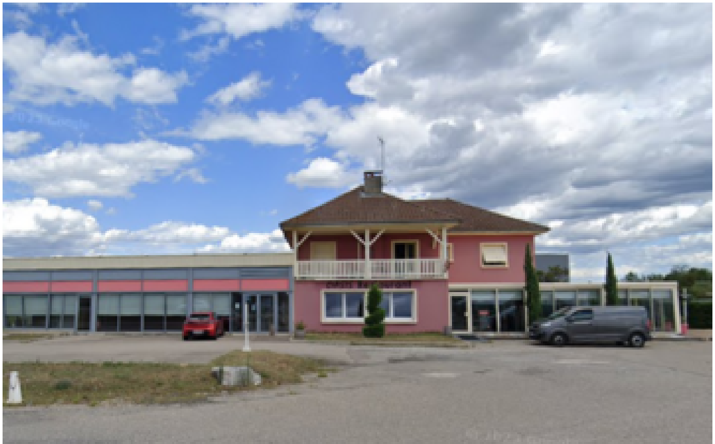
« Rock anti wokisme », un concert néonazi s'est tenu près de Lyon malgré les interdictions préfectorales