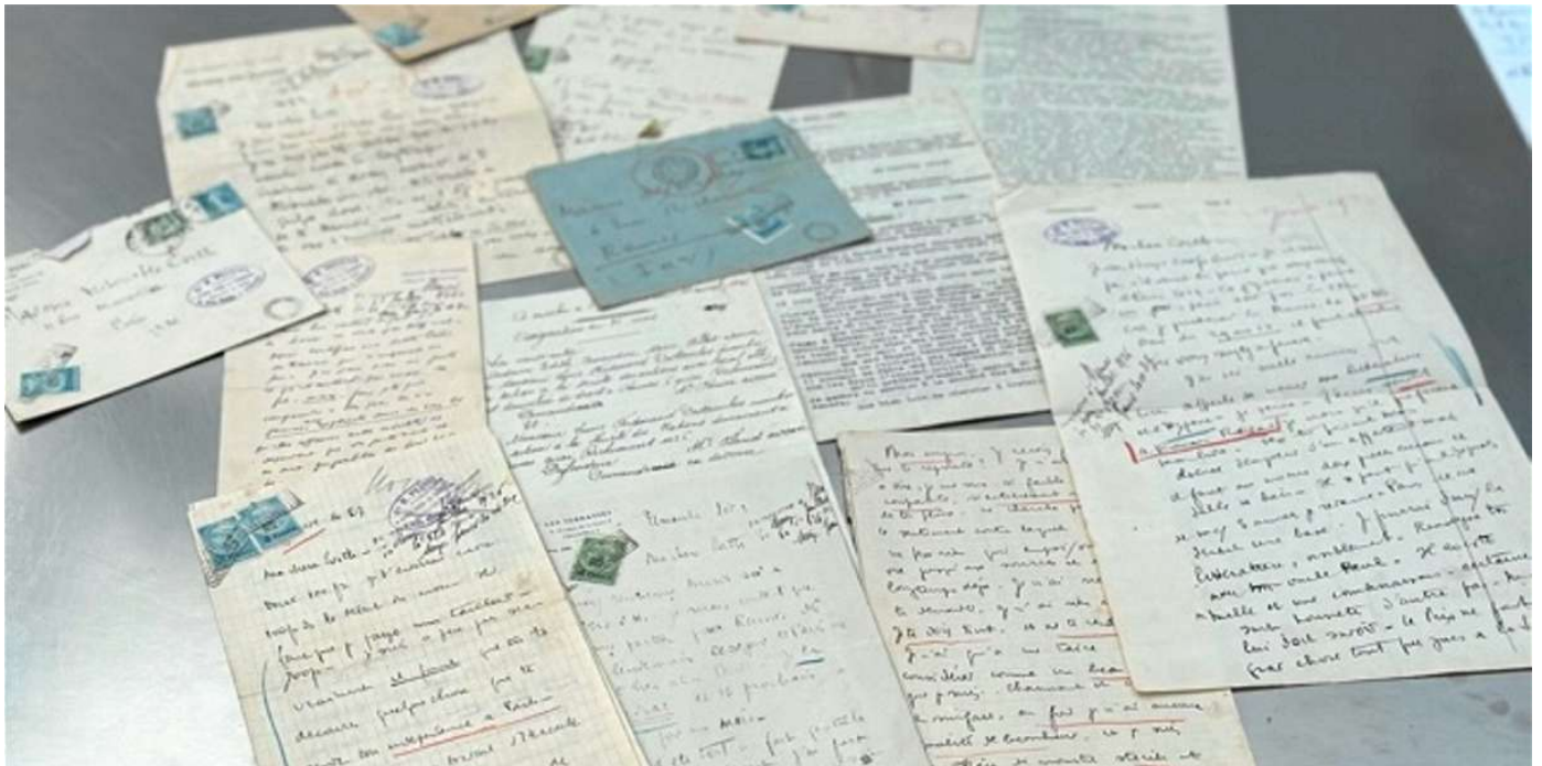
Les lettres de Céline adressées à sa première épouse.