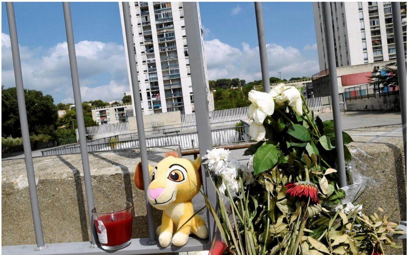
A Nîmes, le 25 août, des fleurs et objets déposés à la mémoire du petit Fayed, un enfant mort par balles à la Cité Pissevin.

Le 13 novembre 2023 à 11h29, modifié le 13 novembre 2023 à 12h26