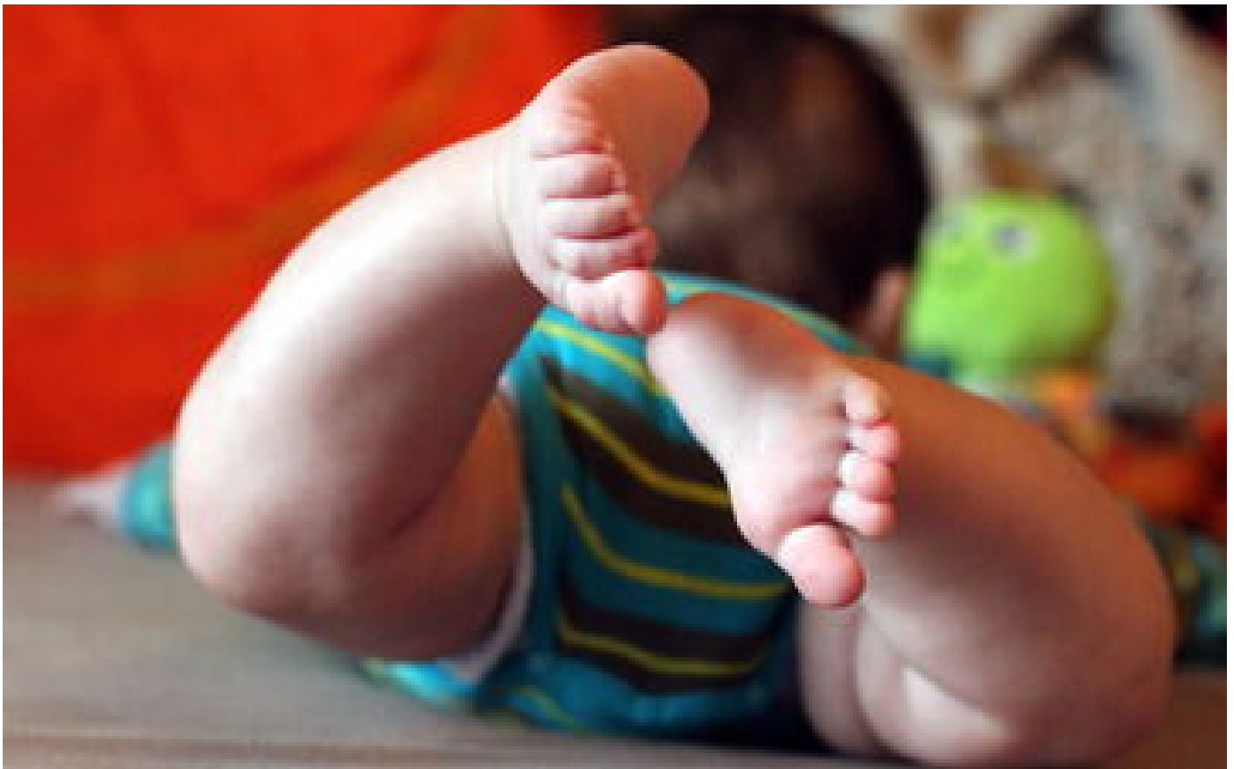
Béziers : un bébé de 3 mois découvert abandonné entre deux voitures, sa mère interpellée puis hospitalisée