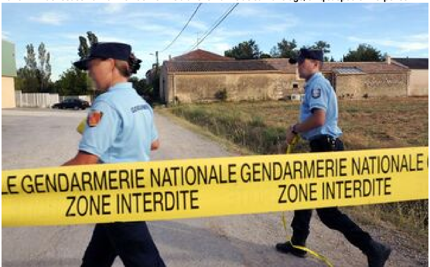
Pyrénées-Orientales : elle découvre un jeune homme mort et partiellement nu, deux hommes en garde à vue