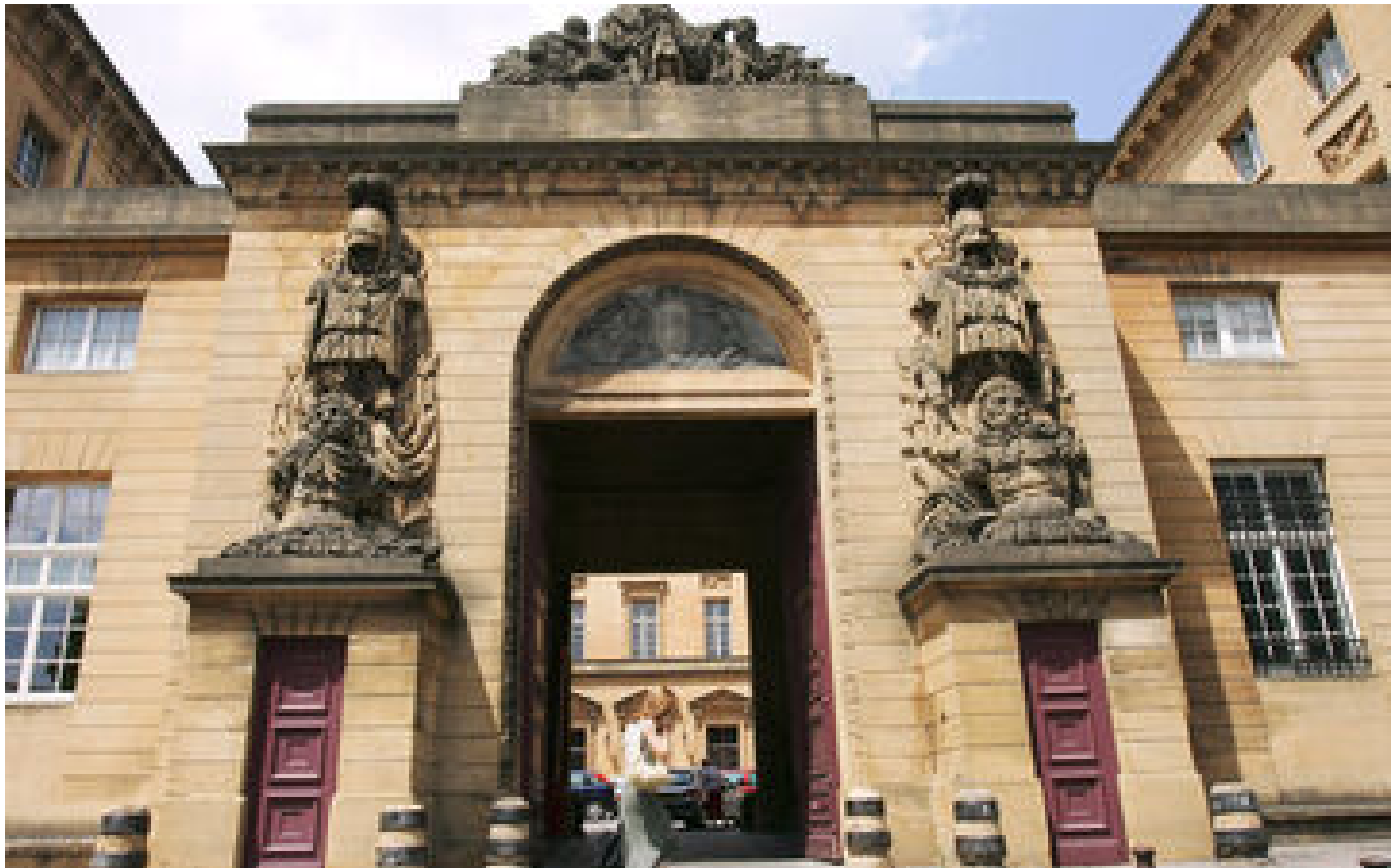
Tentative de féminicide en récidive : « Je pensais faire un mariage d'amour »