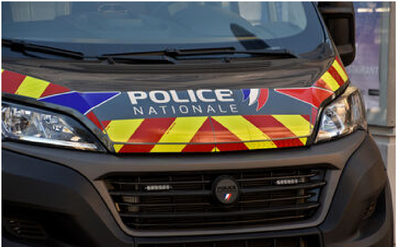
Marseille : un homme d'une vingtaine d'années mortellement blessé par balles