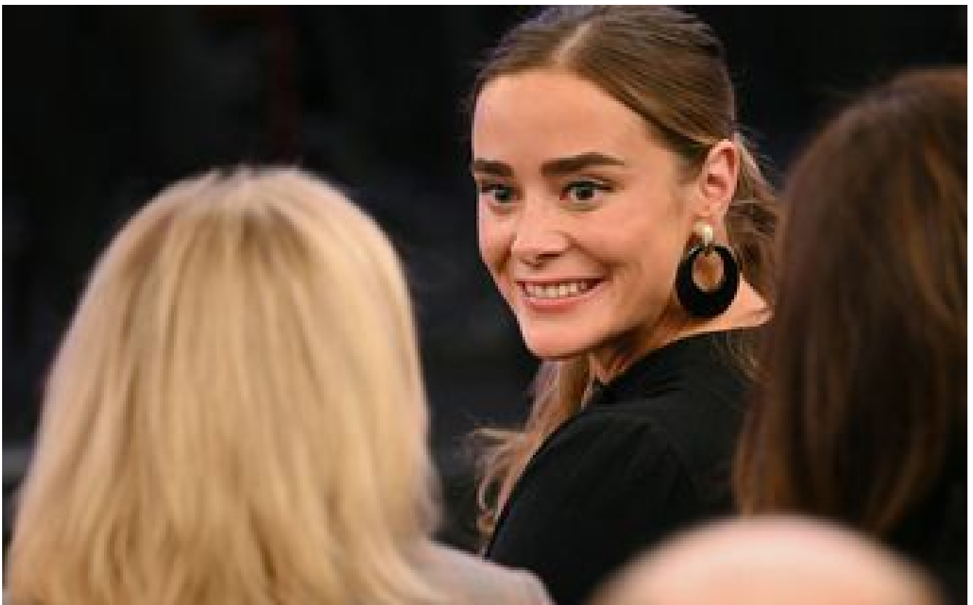
Un agent du service de sécurité de la petite-fille de Biden ouvre le feu après une tentative d'effraction sur un véhicule officiel garé