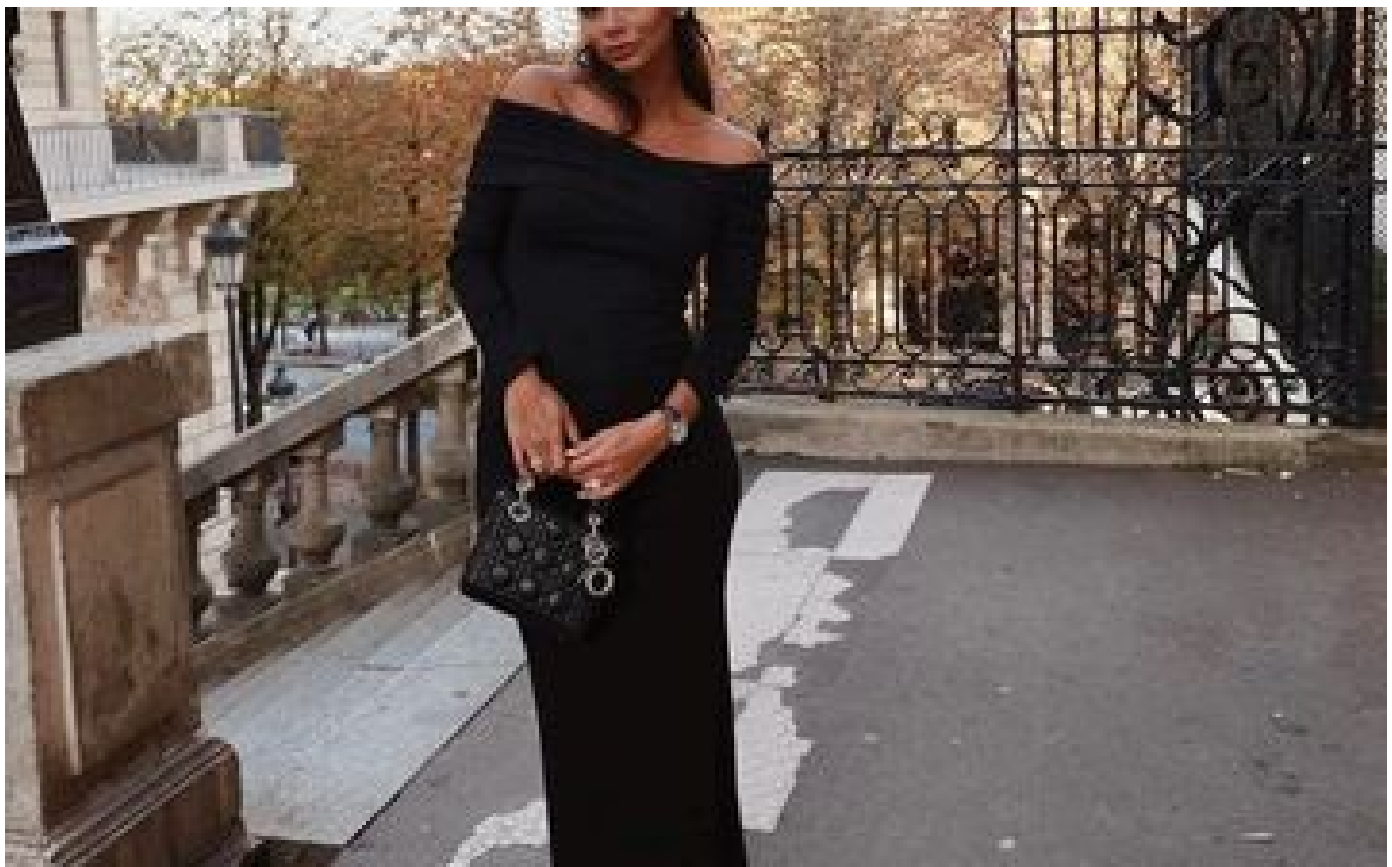
Paris : l'influenceuse Hannah Romao victime d'une tentative de cambriolage, cinq suspects interpellés