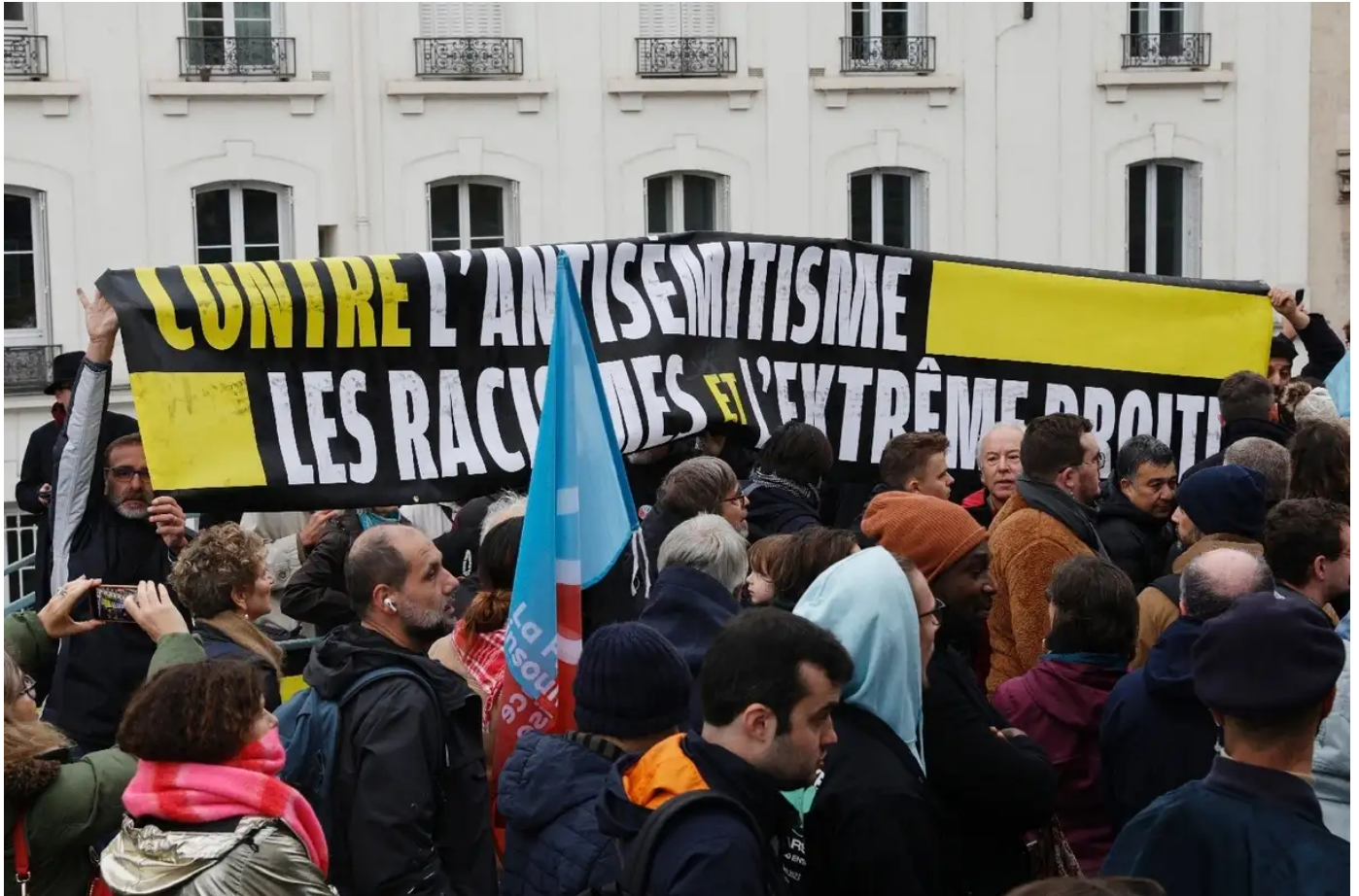
Un rassemblement de LFI contre l'antisémitisme perturbé par des contre-manifestants

Publié le 12/11/2023 à 13h24, mis à jour le 12/11/2023 à 14h03