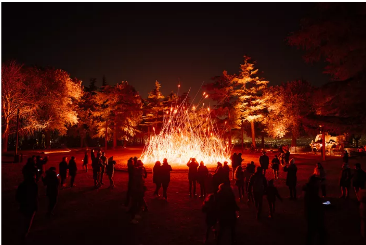
Feu de joie en perspective rue de la République avec ces bambous de 9 mètres. Ville de Lyon

Un pari aussi sur la place des jacobins, confiée aux soins du studio français 1024 qui utilisera lumière, laser et fumée pour cacher et révéler sa sublime fontaine. Quant à la place des Terreaux, dont les quatre faces fermées permettent de grandes fresques, elle verra elle aussi une œuvre expérimentale avec la projection d'images des premiers films des frères Lumière en version remodelée par l'intelligence artificielle. Entre tradition et modernité. «L'œuvre pose la question de l'intelligence artificielle et de ses effets mais avec travail très cinématographique pour avoir un effet "waouh", entraîner les gens dans un émerveillement et dans un effet qui va beaucoup plaire au public» , assure Julien Pavillard