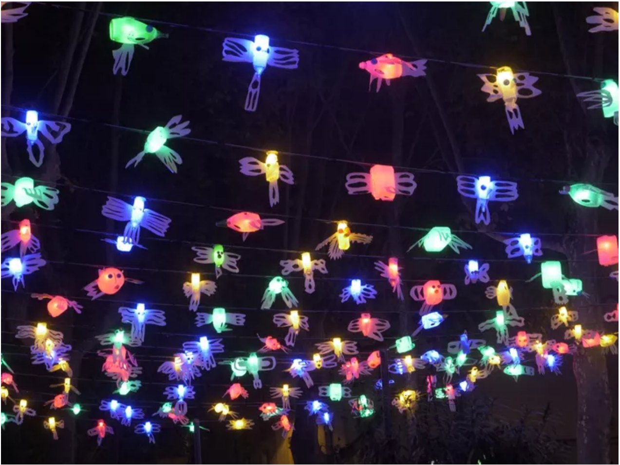
Les oiseaux en plastique de Gazouillis par BIBI illumineront la halle du 8 mai 1945 dans le quartier des États-Unis.