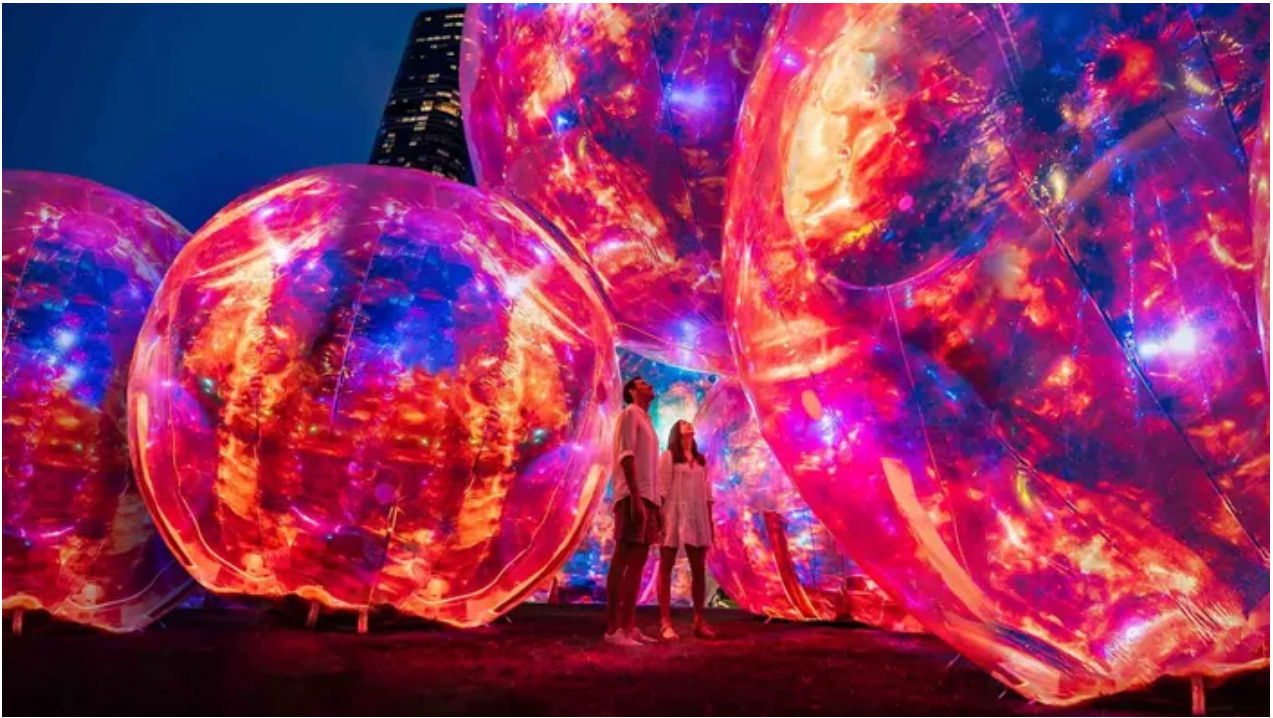
L'œuvre Evanescent viendra égayer le food court de la place Bellecour.

Côté familles toujours, l'œuvre du chanteur et plasticien Philippe Katerine au parc de la Tête d'or, pleine de « mignonitude », propose des sculptures roses toutes en rondeur. Six des 32 œuvres présentés le seront dans ce parc. C'est le cas des tulipes de couleur des lumignons du cœur, programme caritatif en faveur du centre d'oncologie Léon Bérard, qui verront les participants créer avec leurs bougies un chemin coloré jusqu'au dragon du parc. En continuant sur l'île Gandhi, on découvrira d'oniriques geysers avant de croiser une centaine de coquelicots sur l'allée Achille Lignon, qui longe Interpol.