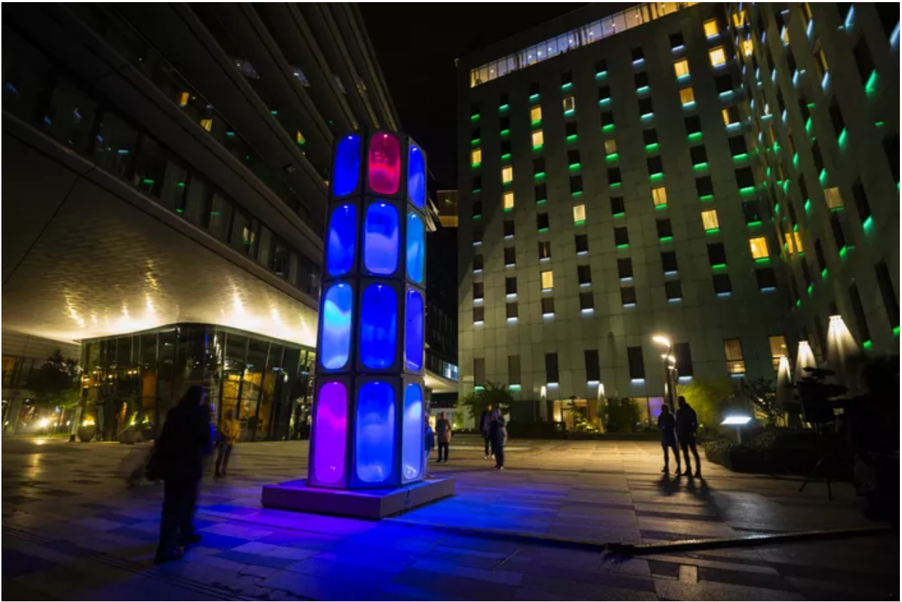
Un totem de 32 baignoires éclairées sera positionné place de la Bourse. Ville de Lyon

Plus classique, Gilbert Coudène, habitué du 8 décembre, reviendra avec Étienne Guiol et leur œuvre Redessine-moi Lyon , qui anime la célèbre fresque des Lyonnais. Le bassin de la République sera quant à lui allumé d'un feu de bambou de neuf mètres scintillant dans la nuit. Et le Soleil nuit de Sébastien Lefevre viendra baigner des reflets de sequins la place des Célestins. De nuit cette fois.