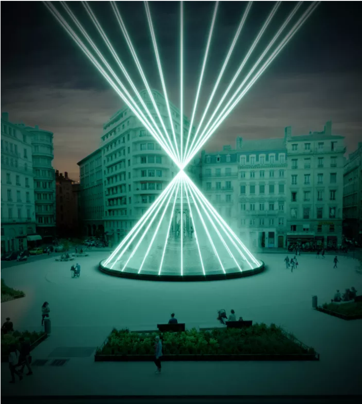
La fontaine des jacobins sublimée. Ville de Lyon