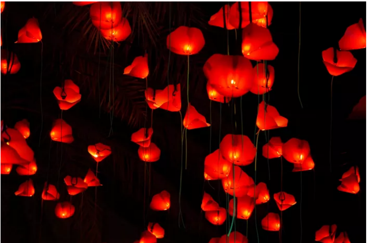
Les tulipes suspendues ont été financées par Interpol.

Côté familles toujours, l'œuvre du chanteur et plasticien Philippe Katerine au parc de la Tête d'or, pleine de « mignonitude », propose des sculptures roses toutes en rondeur. Six des 32 œuvres présentés le seront dans ce parc. C'est le cas des tulipes de couleur des lumignons du cœur, programme caritatif en faveur du centre d'oncologie Léon Bérard, qui verront les participants créer avec leurs bougies un chemin coloré jusqu'au dragon du parc. En continuant sur l'île Gandhi, on découvrira d'oniriques geysers avant de croiser une centaine de coquelicots sur l'allée Achille Lignon, qui longe Interpol.