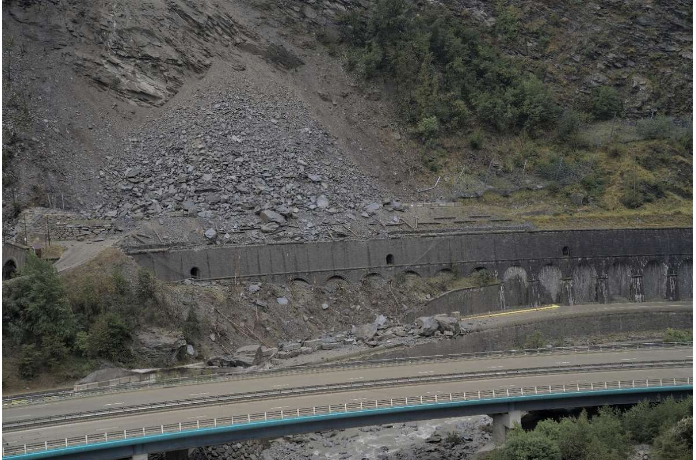
Falaise éboulée de Maurienne: début d'une série de purges