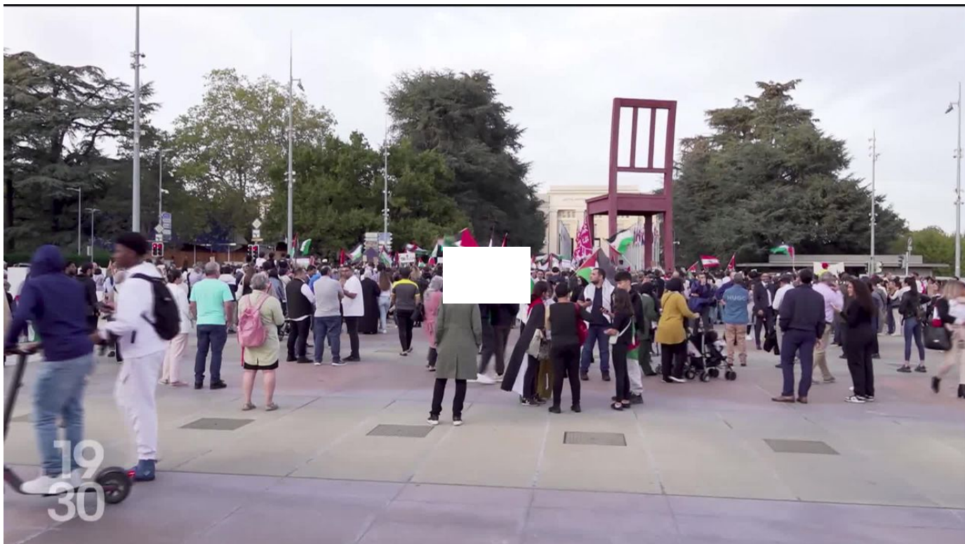
Le conflit entre le Hamas et Israël se répercute aussi en Suisse / 19h30 / 1 min. / hier à 19:30

De nombreux tags antisémites sont apparus en Ville de Genève depuis l'attaque du Hamas contre Israël. Une cinquantaine ont déjà été effacés